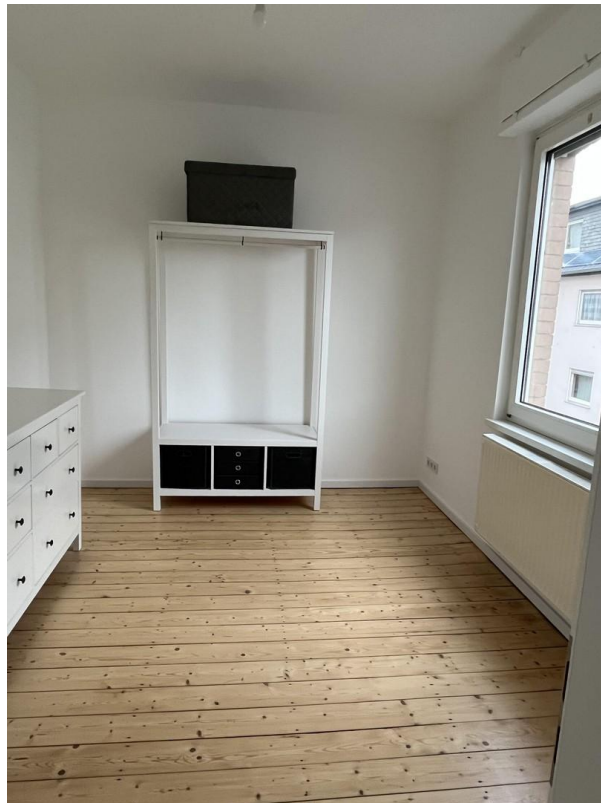
Schlafzimmer 1. OG