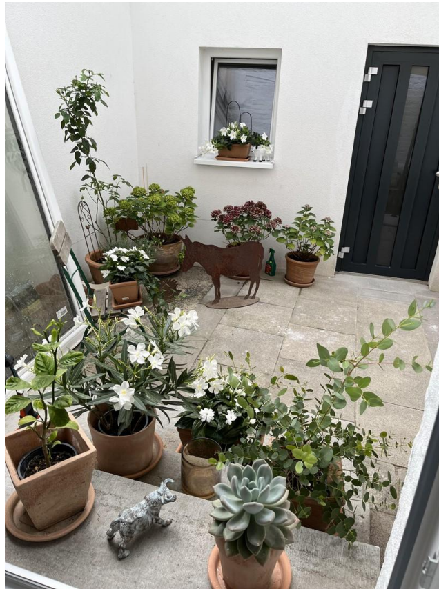
Blick in den Hof