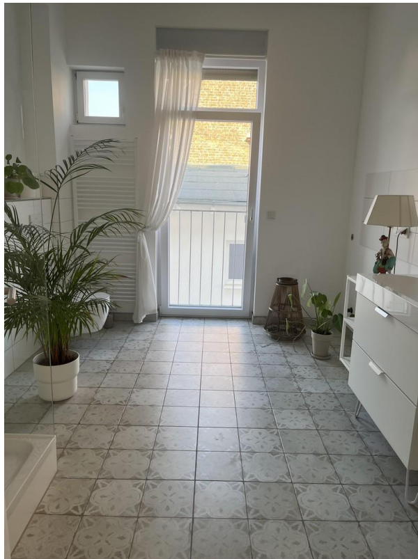
Badezimmer 1. OG