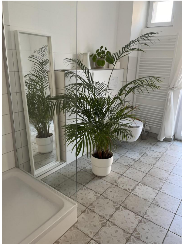
Badezimmer 1. OG