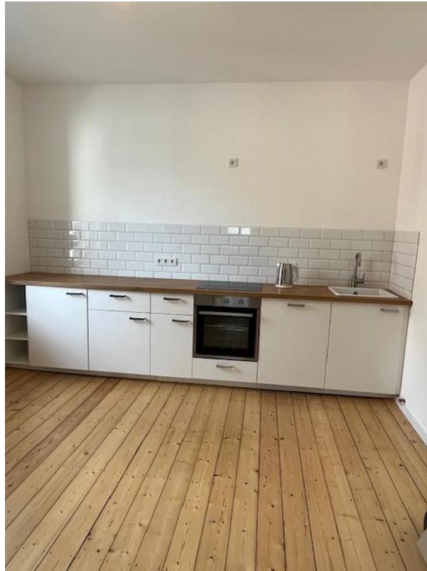
Wohnküche 1. OG