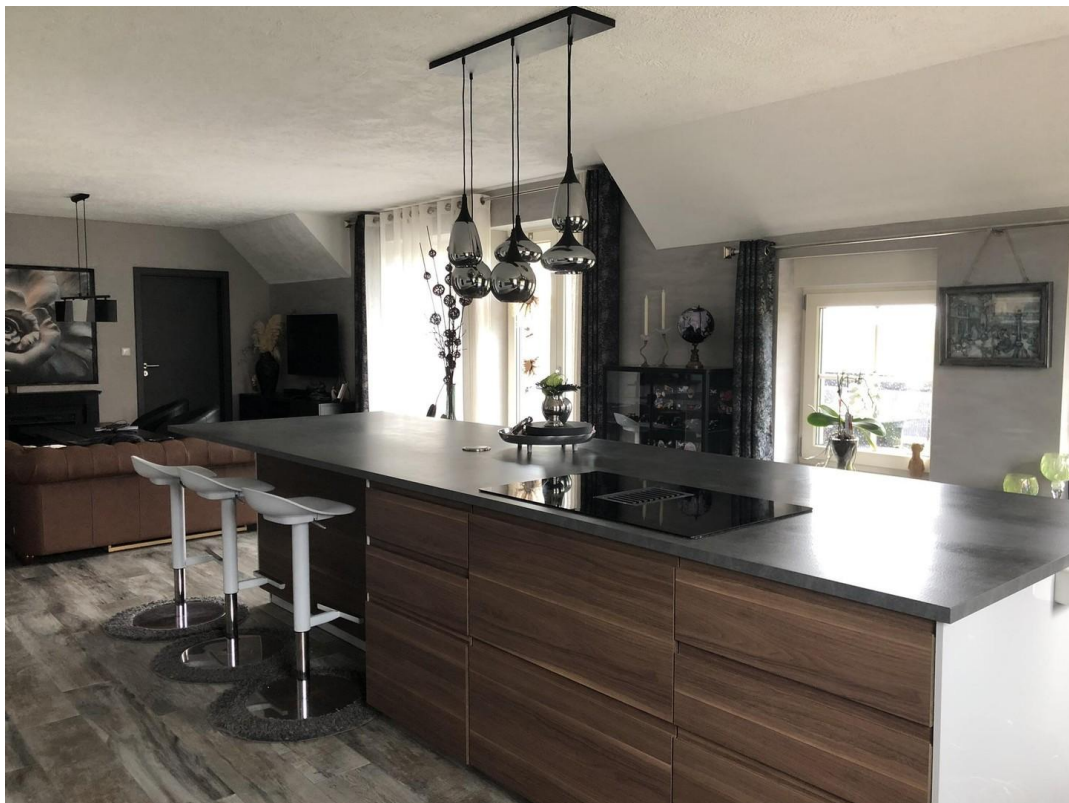
40 m2 große Wohnküche IV