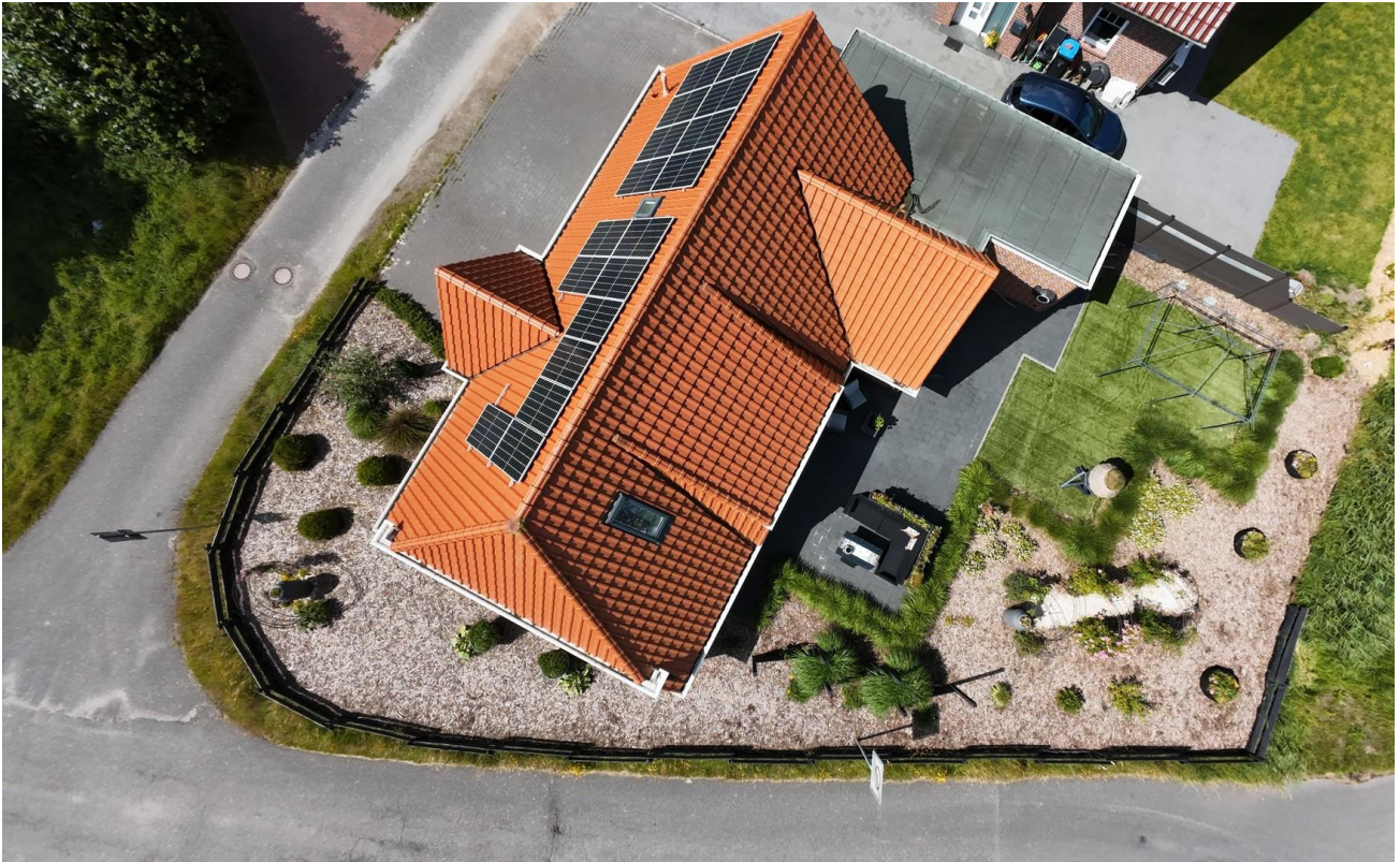
Drone Bild I