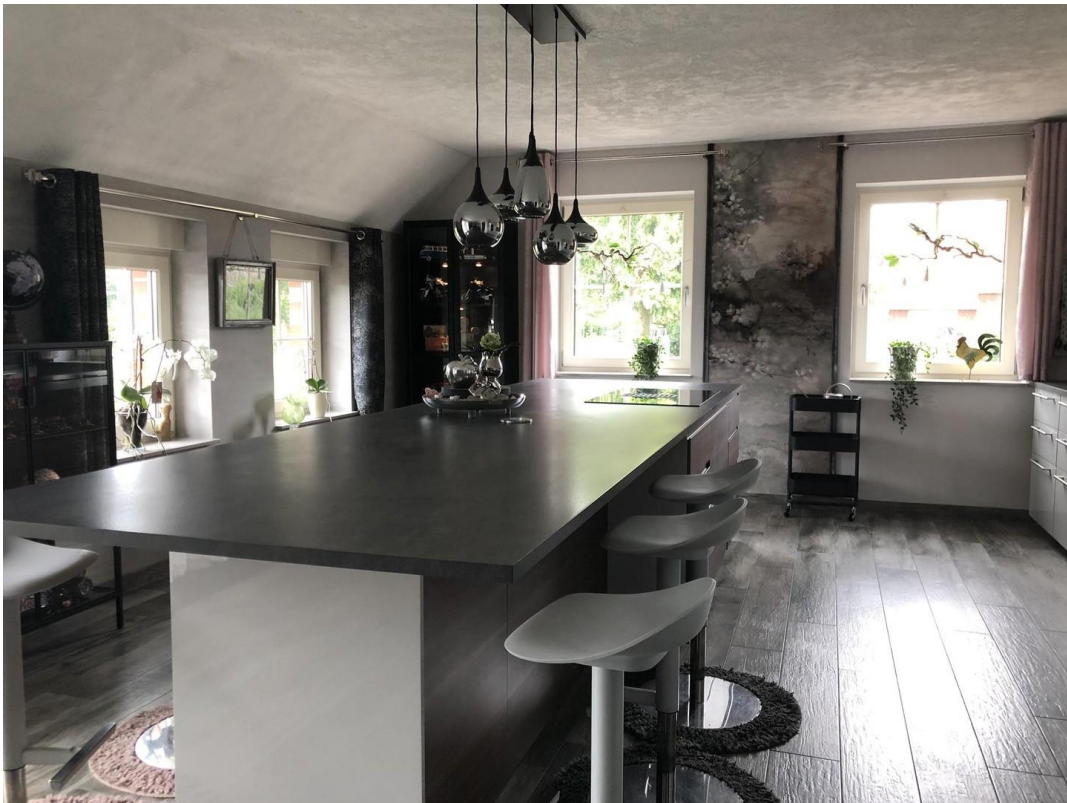
40 m2 große Wohnküche II