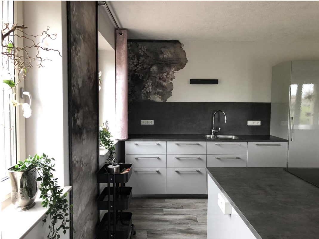
40 m2 große Wohnküche III