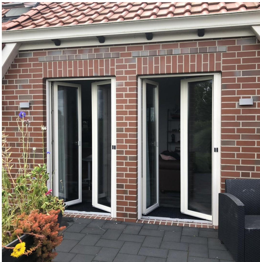
zwei große Terrassentüren