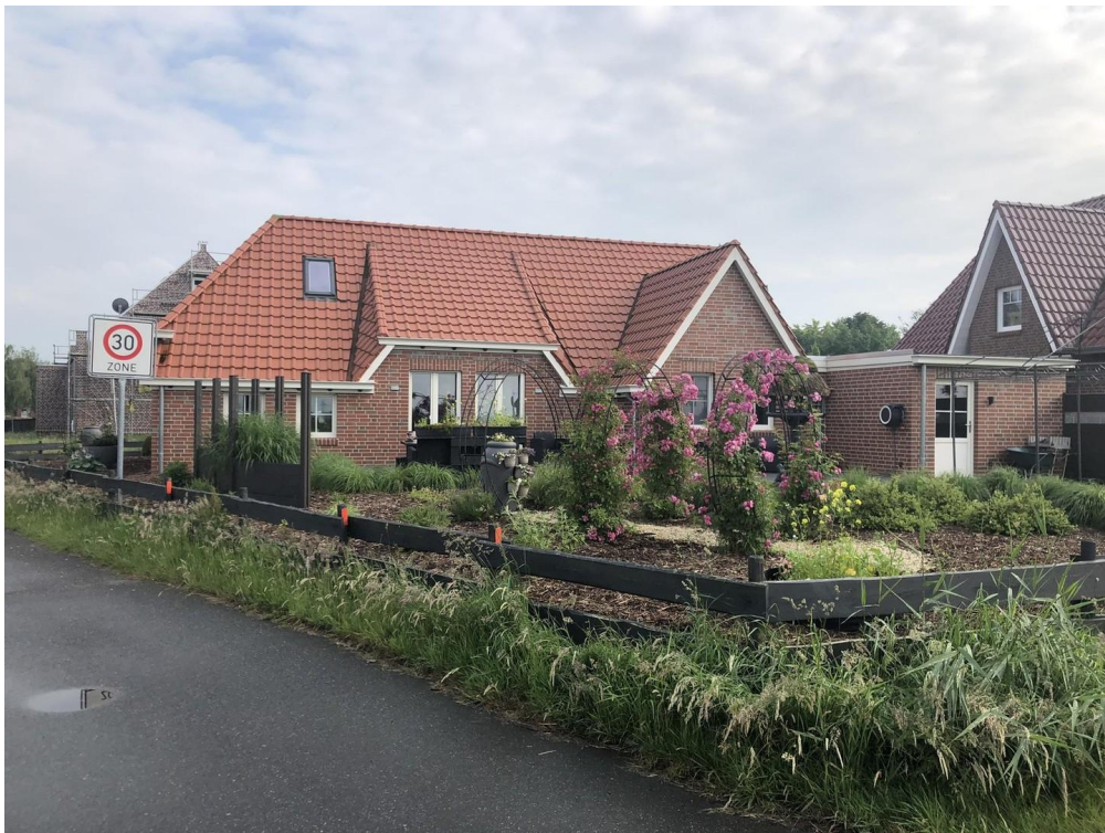
Ansicht Strassenseite II