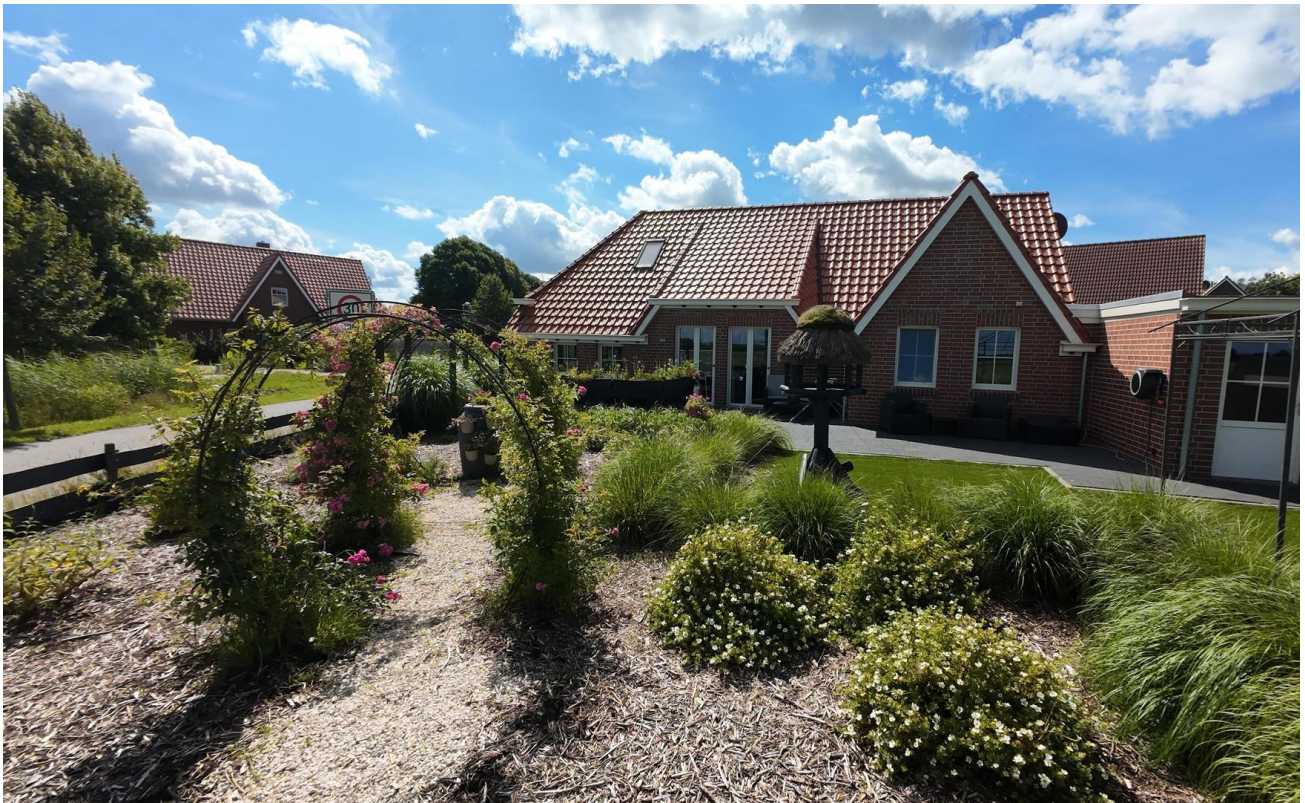
Ansicht Strassenseite II