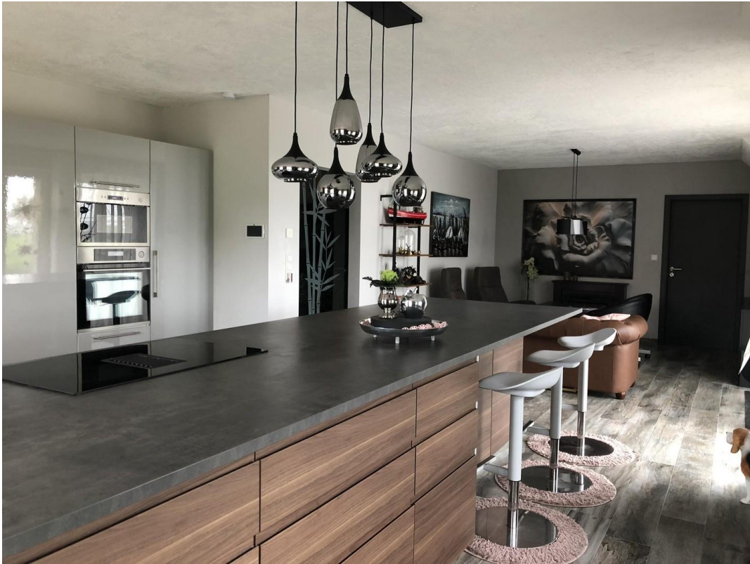
40 m2 große Wohnküche