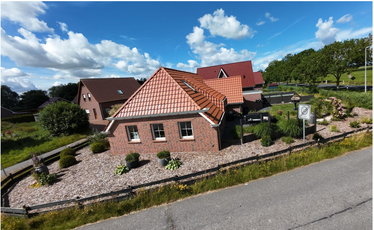
Drone Bild II