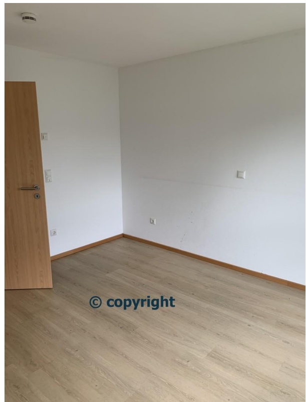
SZ 1 2