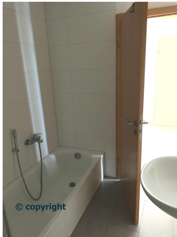
SZ I 3