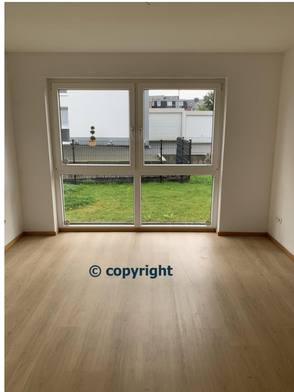
SZ I 3