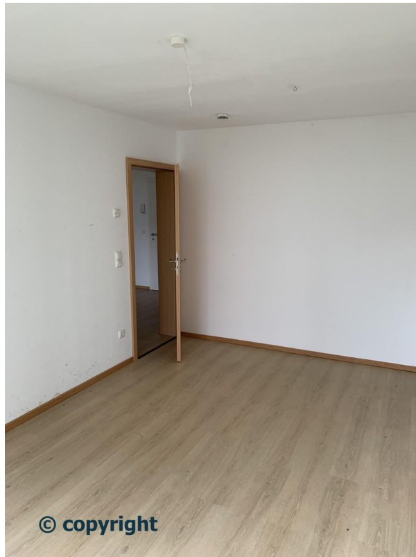
SZ II 1