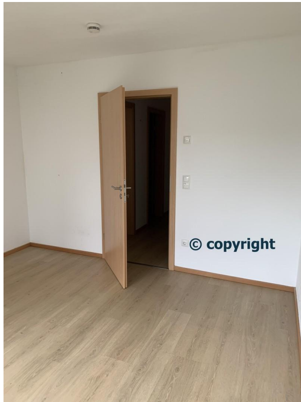
SZ I 1