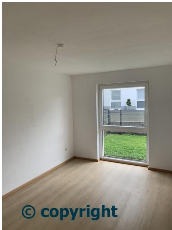
SZ II 2