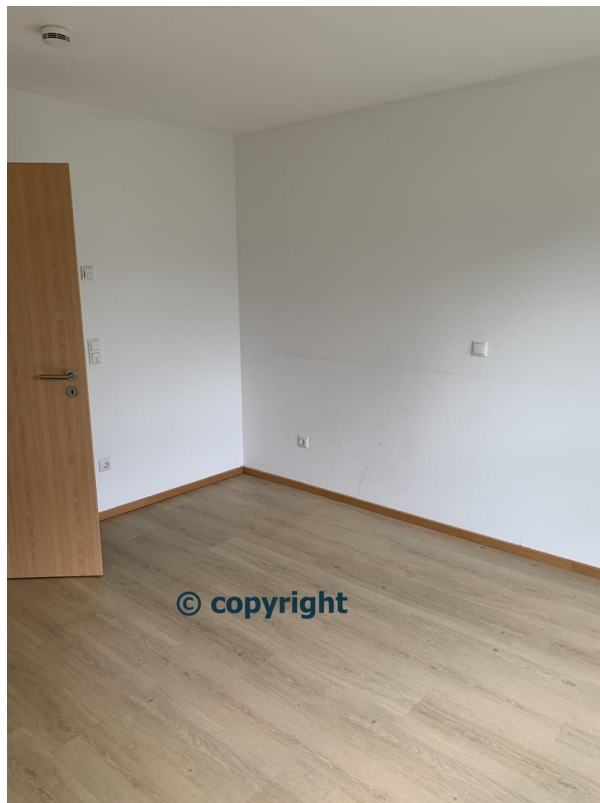
SZ I 2