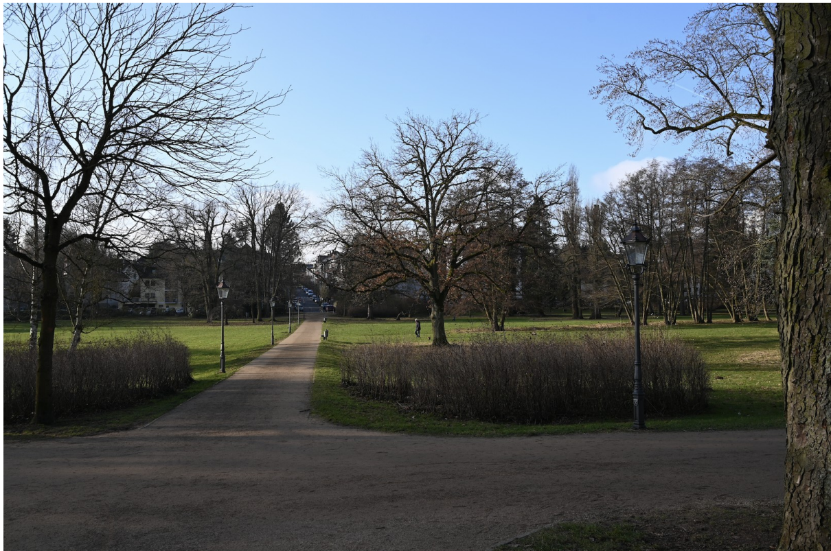
Kurpark 300m entfernt