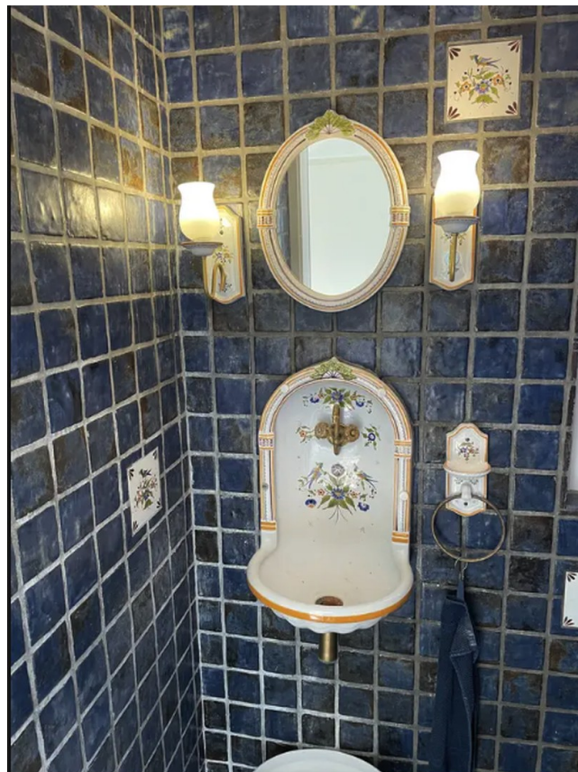
Gäste WC EG