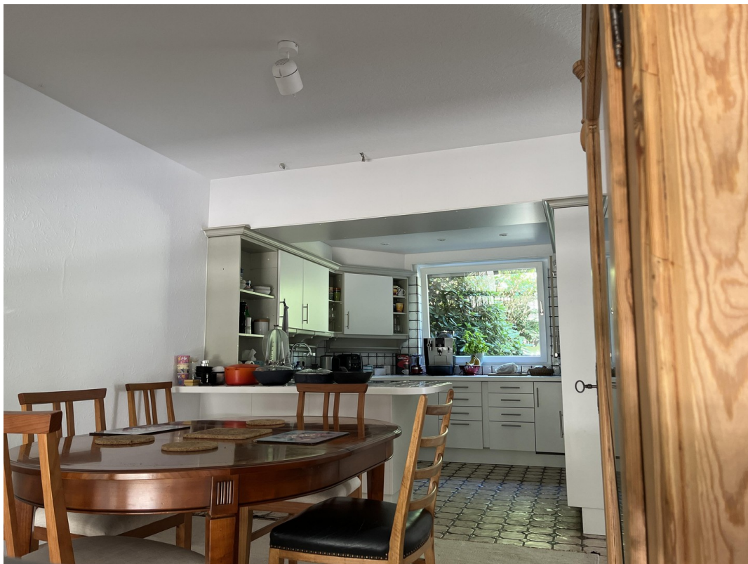
Essen und Küche