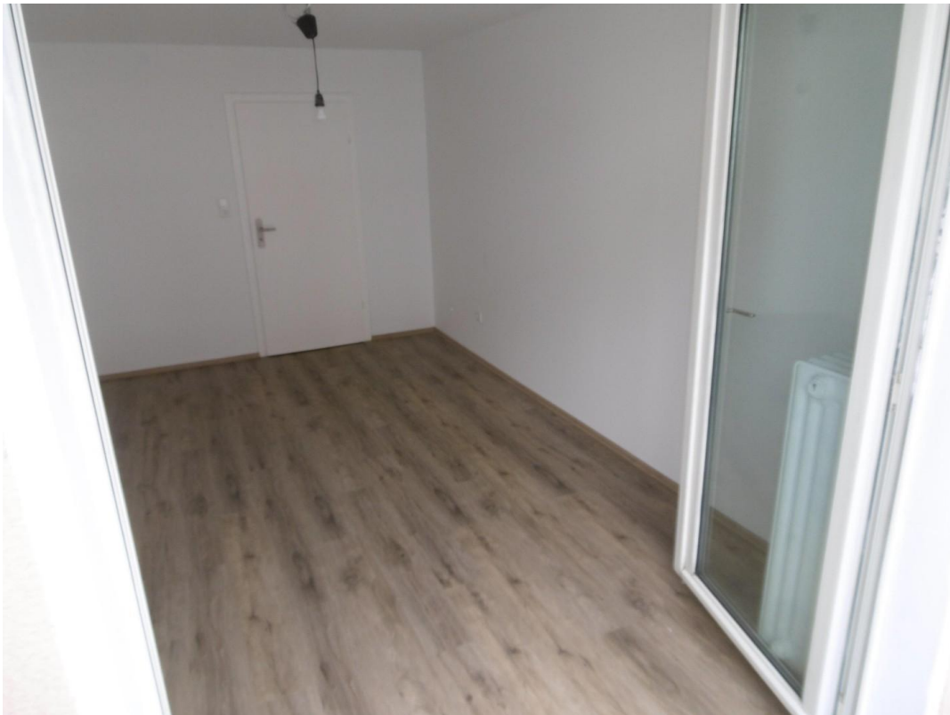
Schlafzimmer 2/ Kinderzimmer