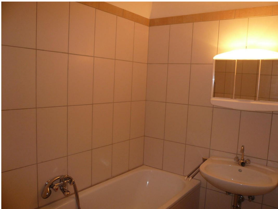
Wannenbad 4,18 qm