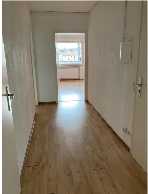
Diele 5,76 qm