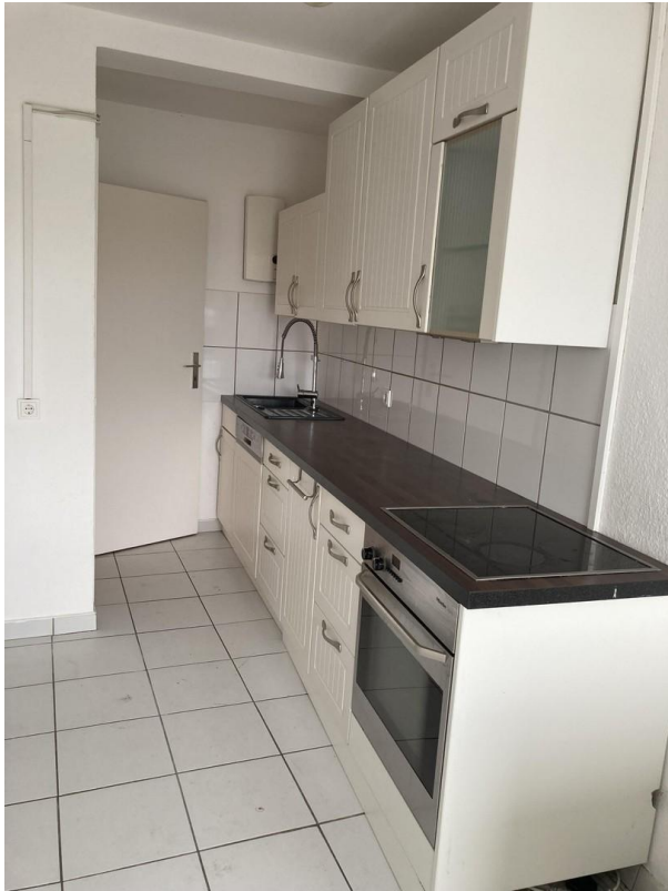
Küche 8,89 qm