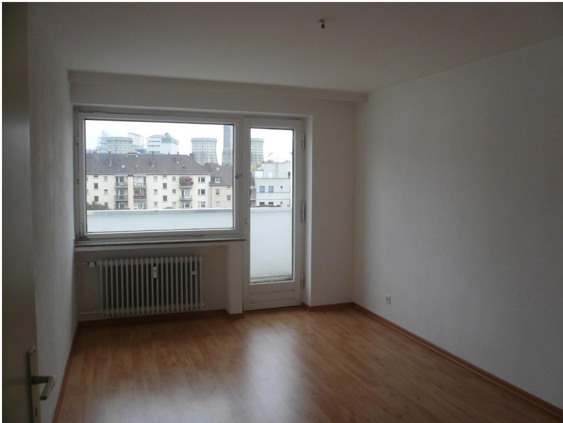
Schlafzimmer 13,88 qm