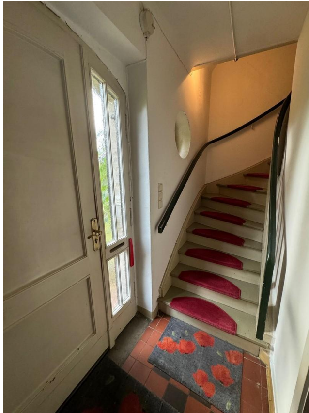
Hauseingang und Zugang DG