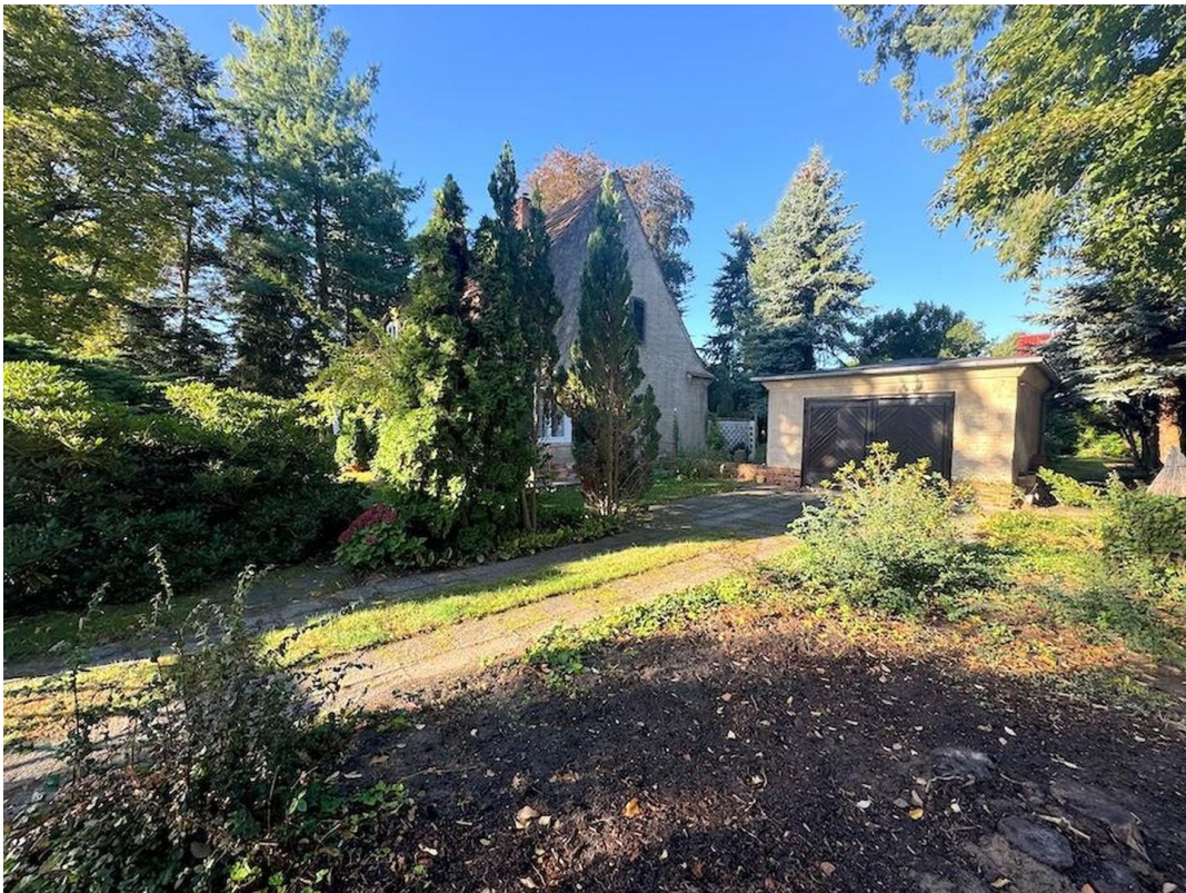
Vorgarten und Garage