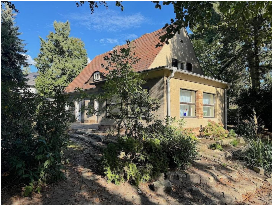
Gartenansicht mit Wintergarten