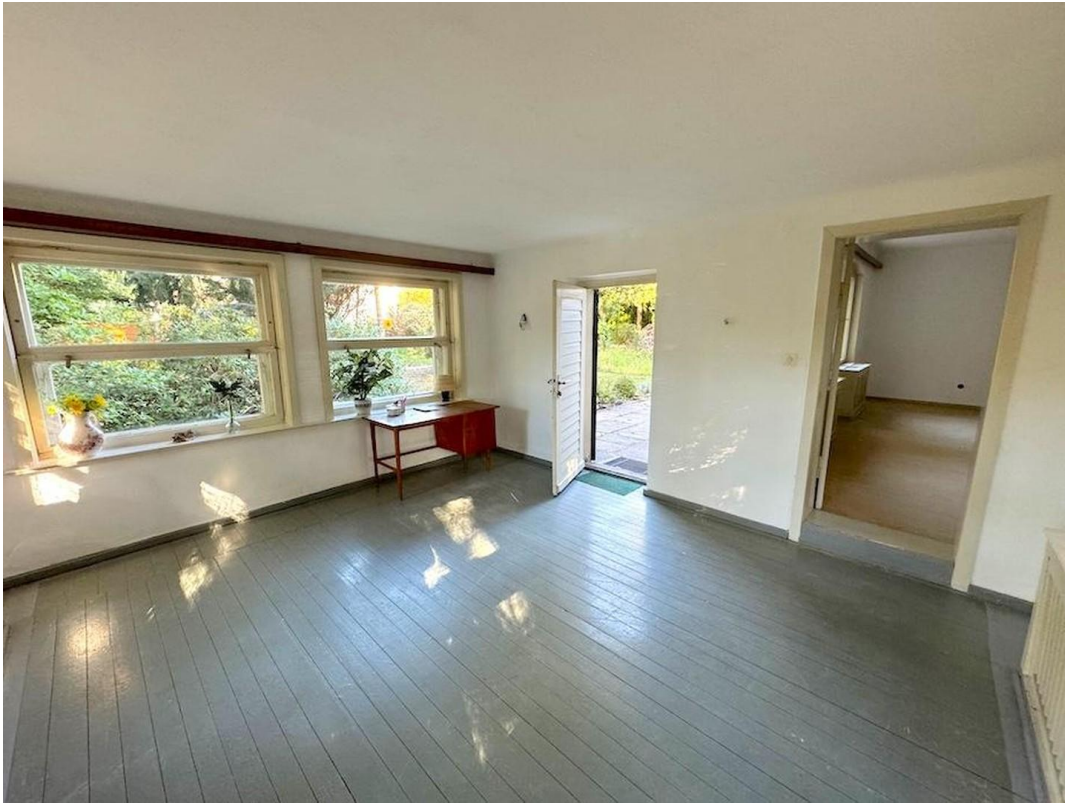
Wintergarten mit Terrassentür