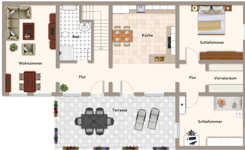
Exposplan, nicht maßstäblich