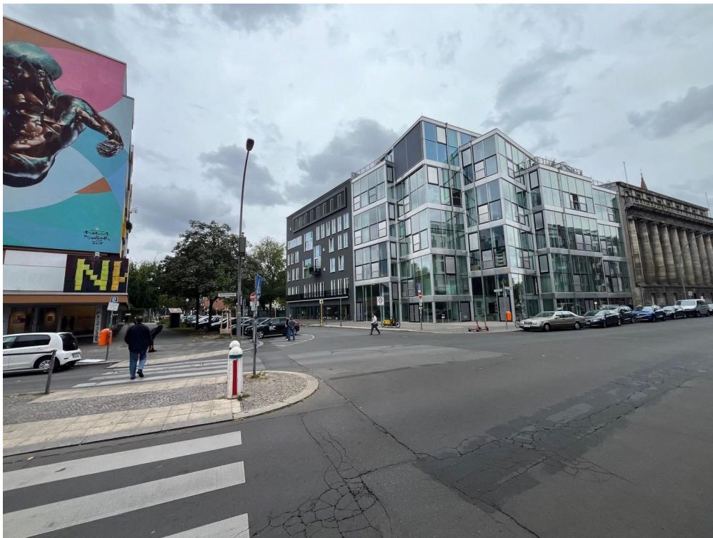
Präsenz zur Kurfürstenstraße