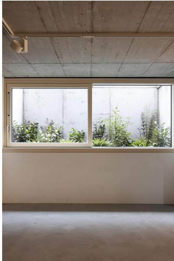
Natürliche Belichtung UG