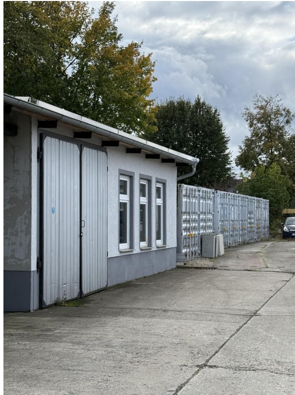
Halle links und Container