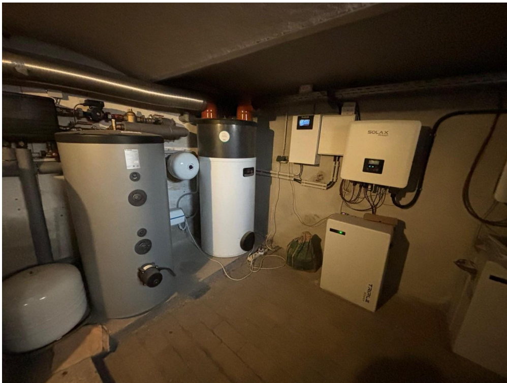
Pufferspeicher und Akkusystem