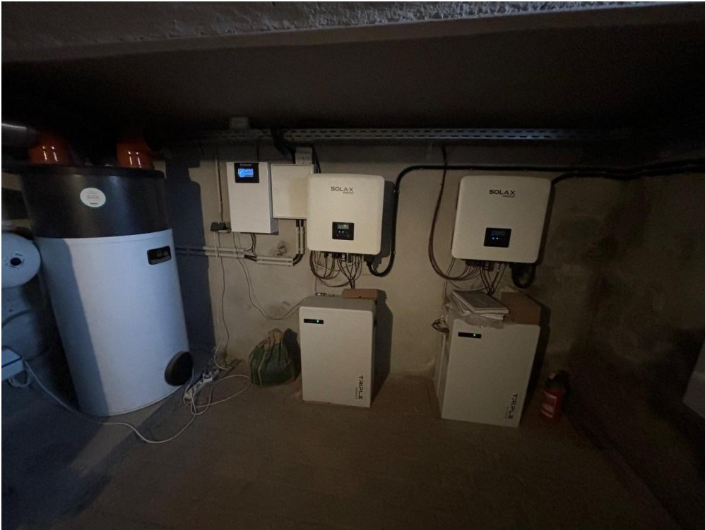
Akku System PV-Anlage