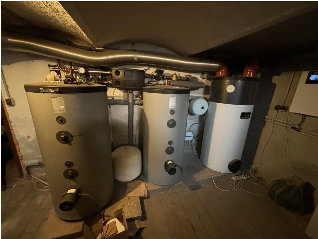
Heizungsanlage von 2023