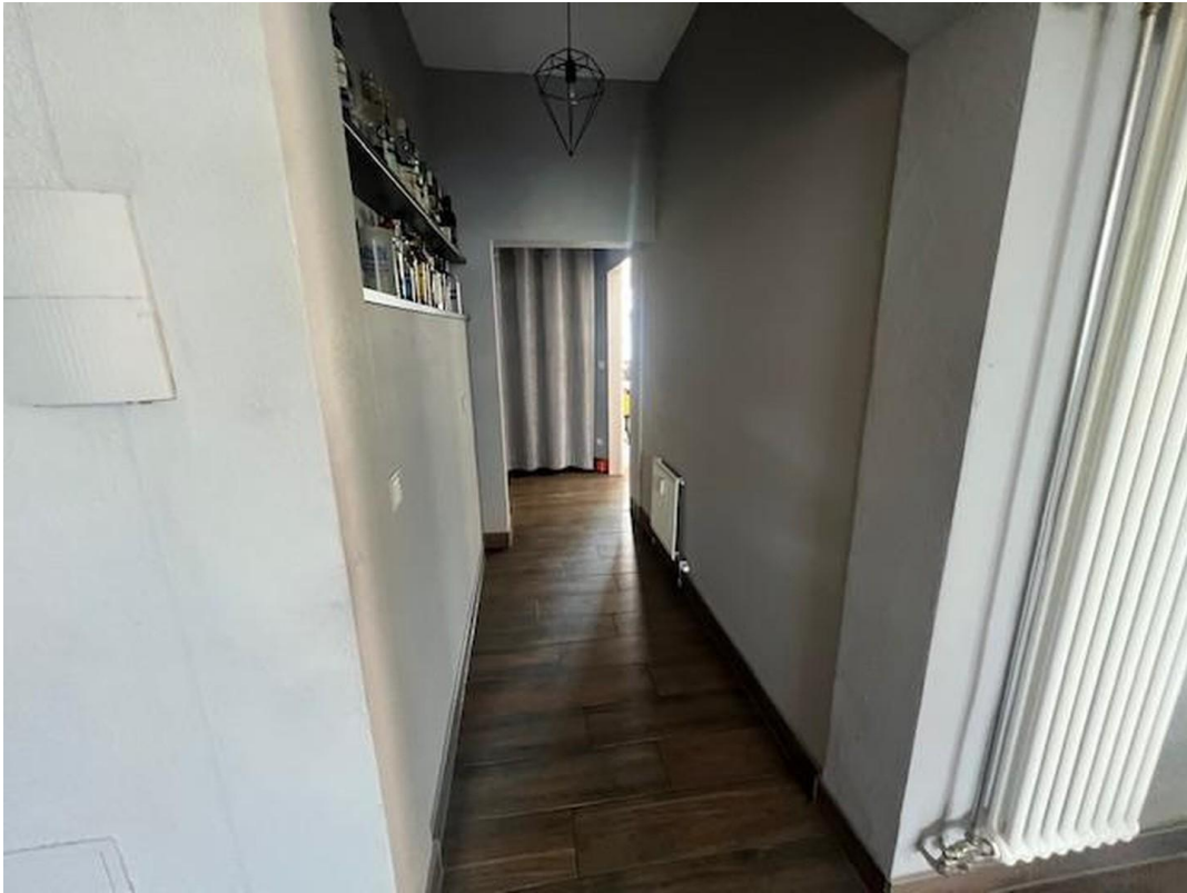
Ansicht Flur zum Nebenraum