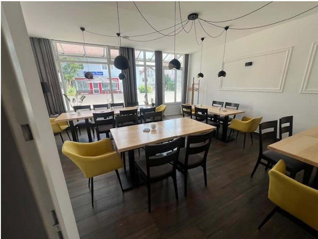
Ansicht Innenraum Raum 2