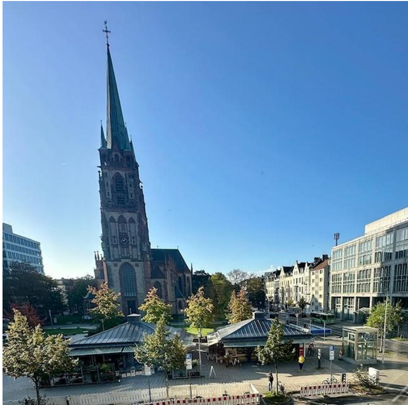
Blick auf den Kirchplatz