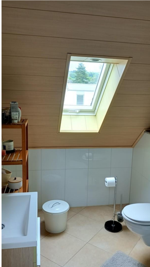
Duschbad mit WC oben