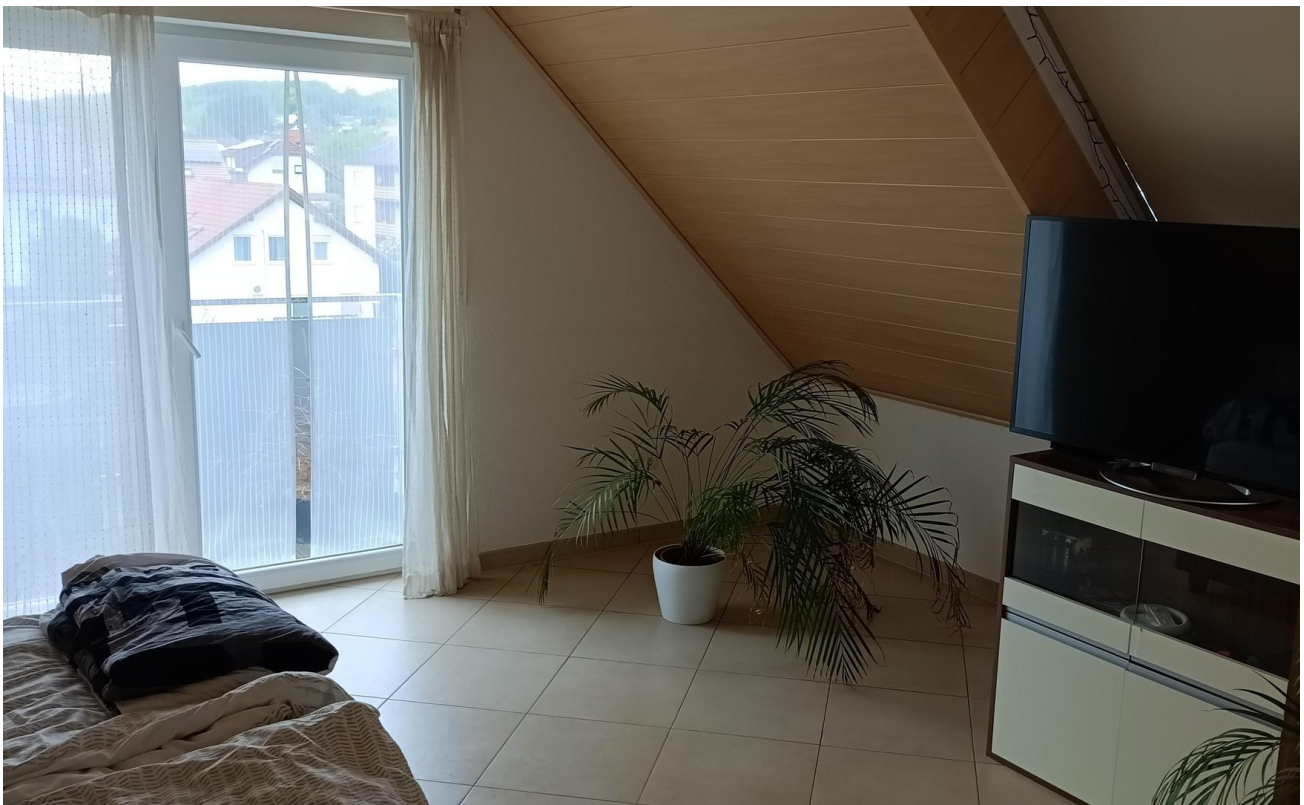
Schlafzimmer oben mit Balkon