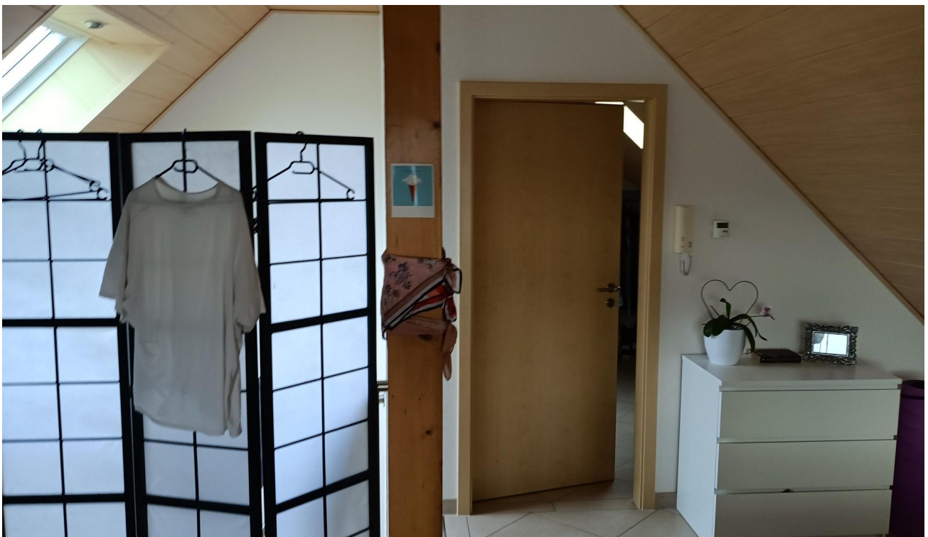
Schlafzimmer oben Rt WC Vorrat