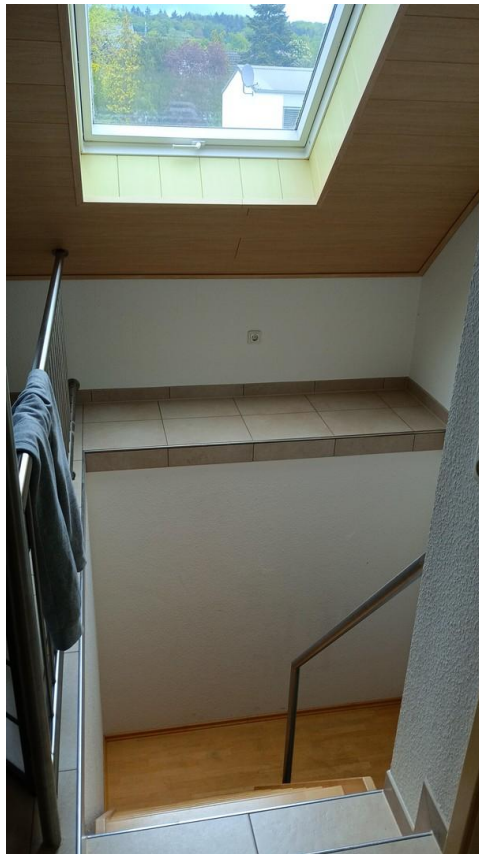
Treppenanlage für die 2. Etage