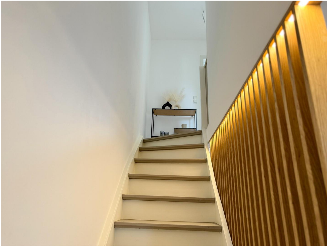
Treppe ins OG