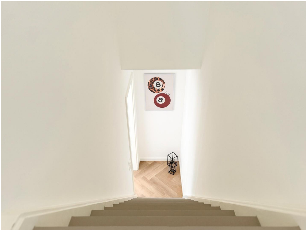
Treppe ins DG