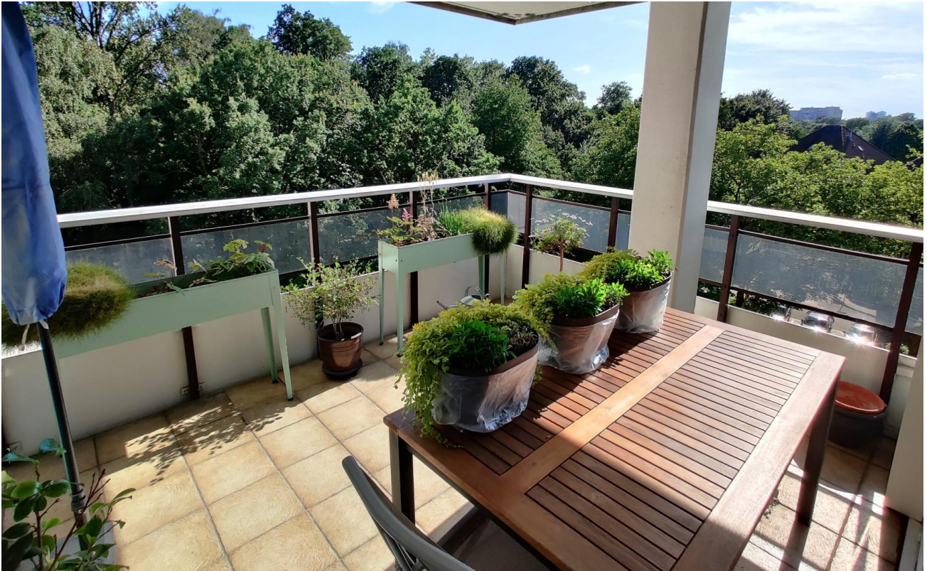
kl. Whg Balkon