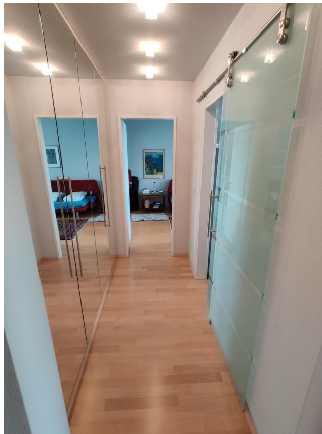
kl. Whg Flur mit Einbauschränk