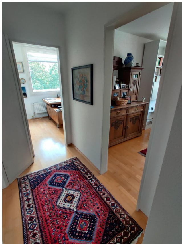
gr. Whg Flur 2