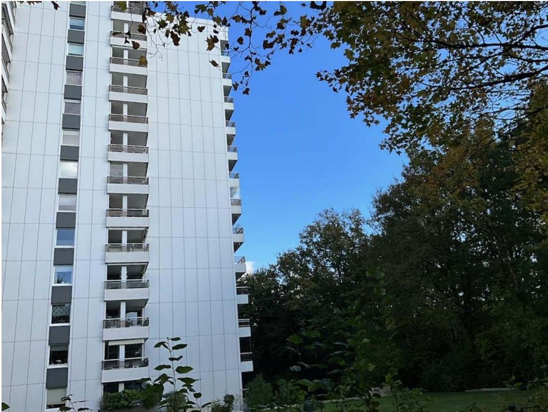
Haus Totale Seitenansicht