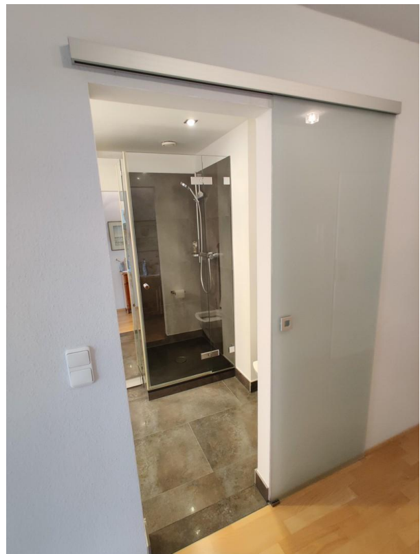
kl. Whg Bad Eingang Schiebetür