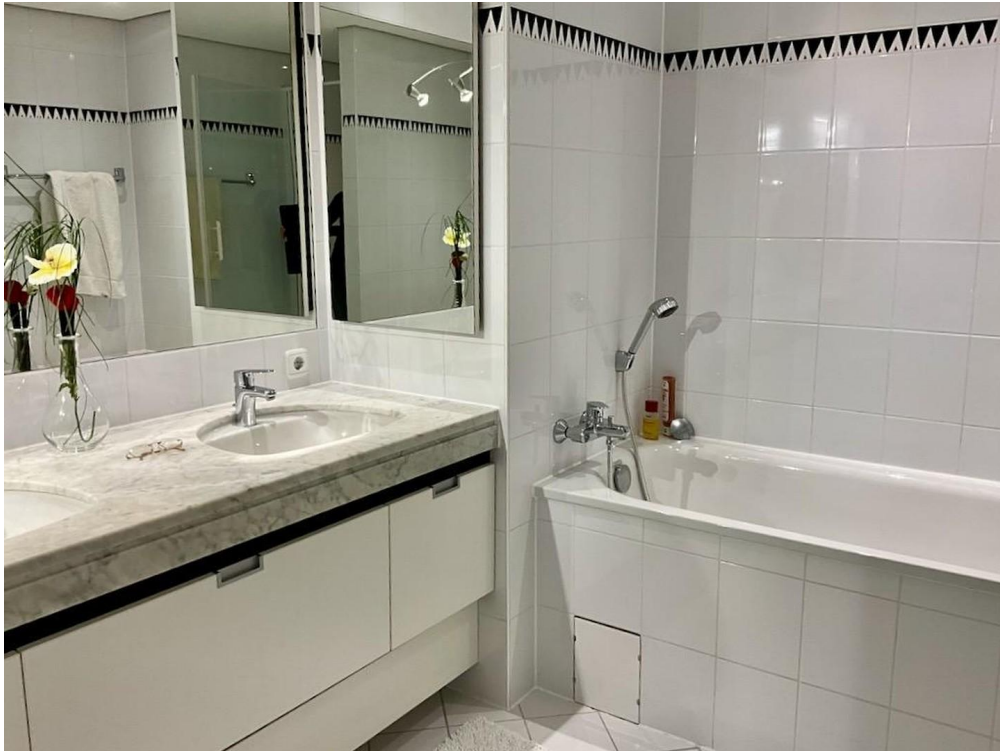
gr. Whg Bad