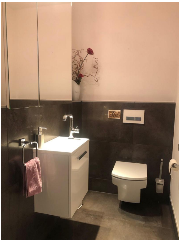
kl. Whg Gäste-WC