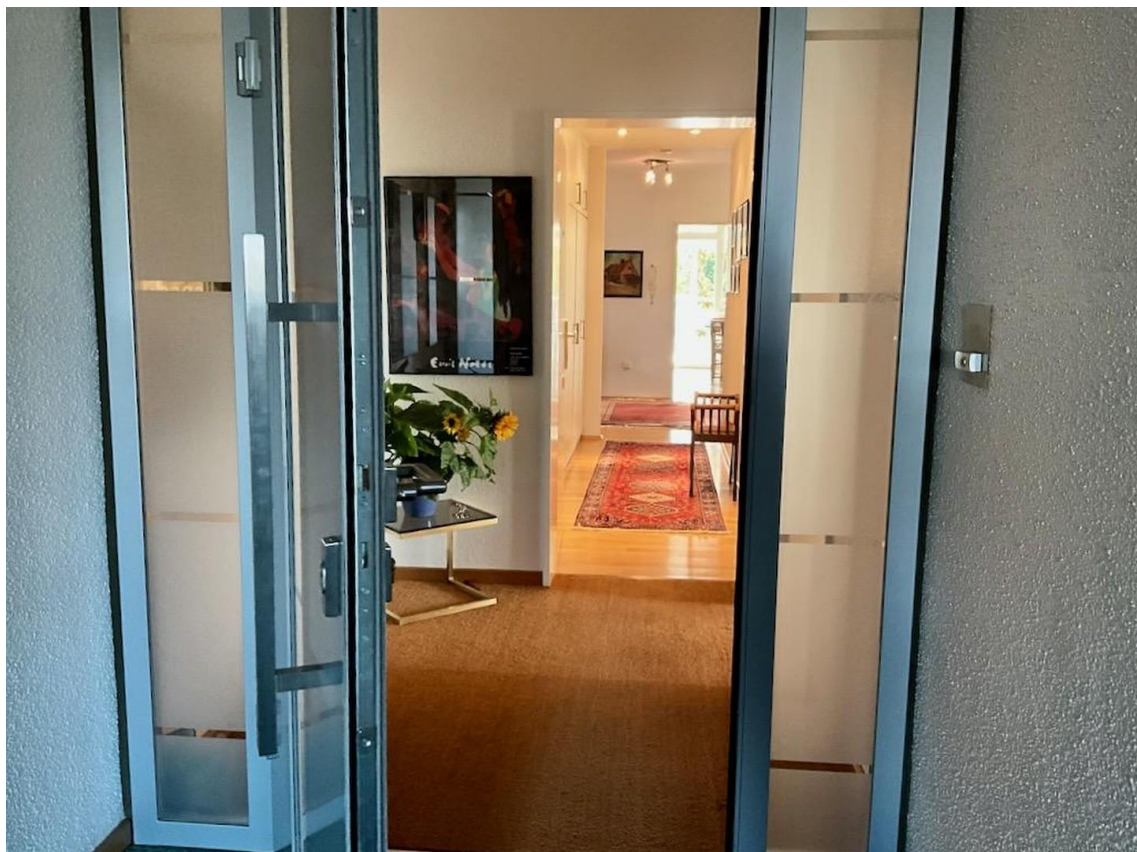
Entrée für beide Wohnungen