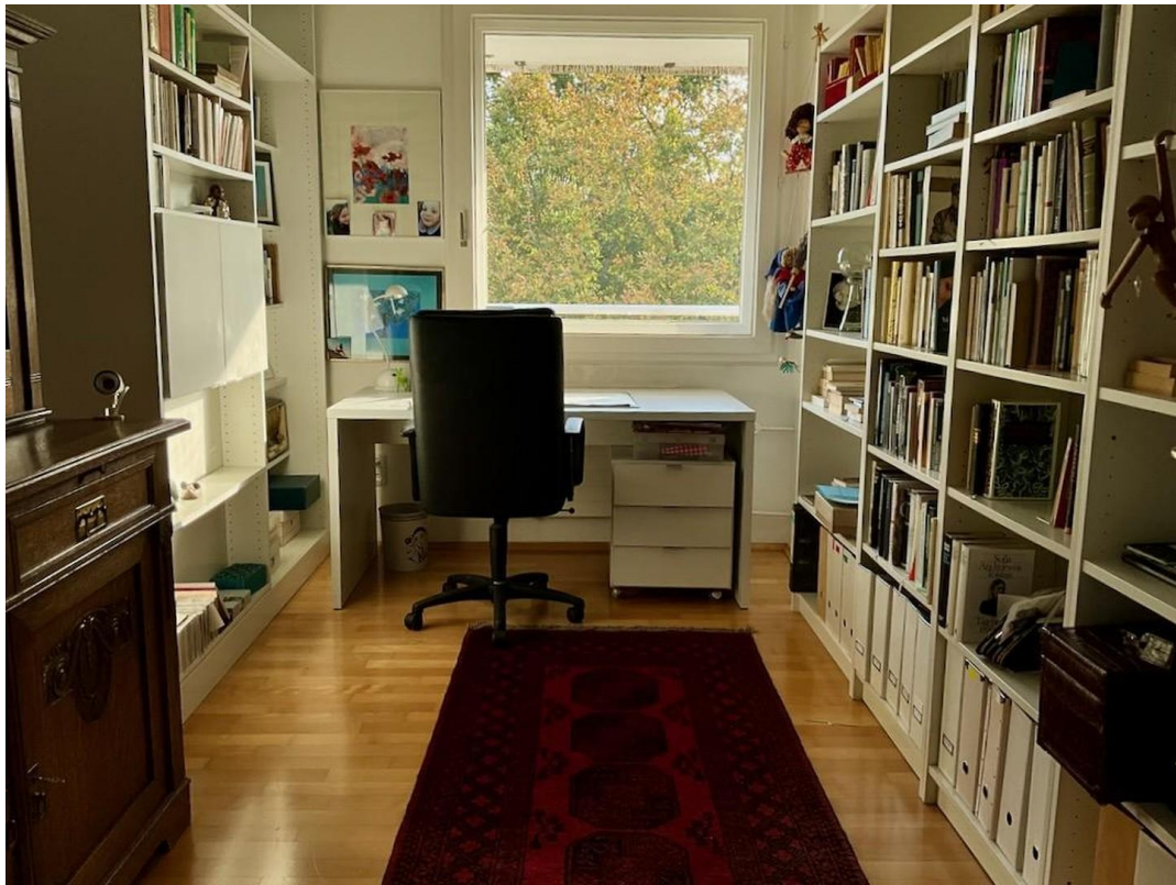
gr. Whg Arbeitszimmer 1