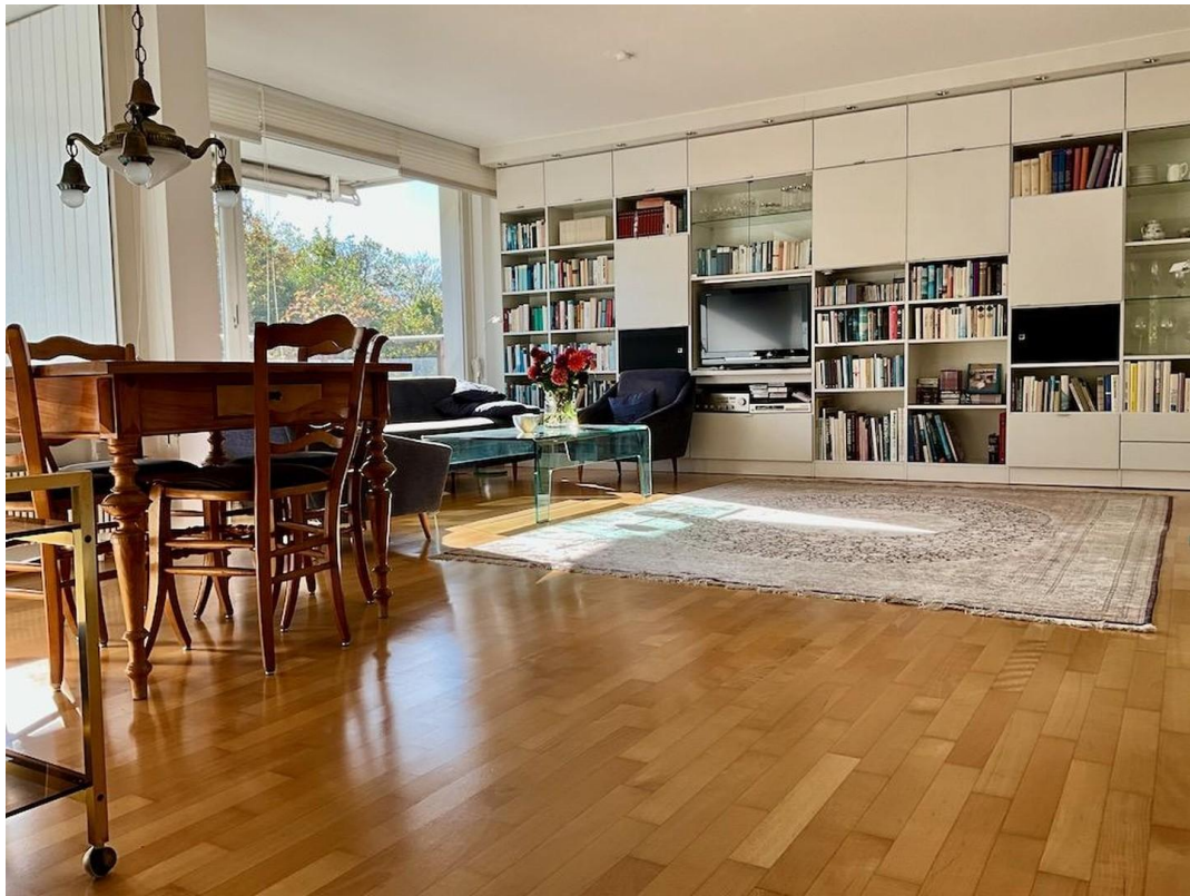
gr. Whg Wohnzimmer