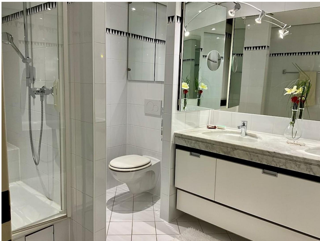
gr. Whg Bad