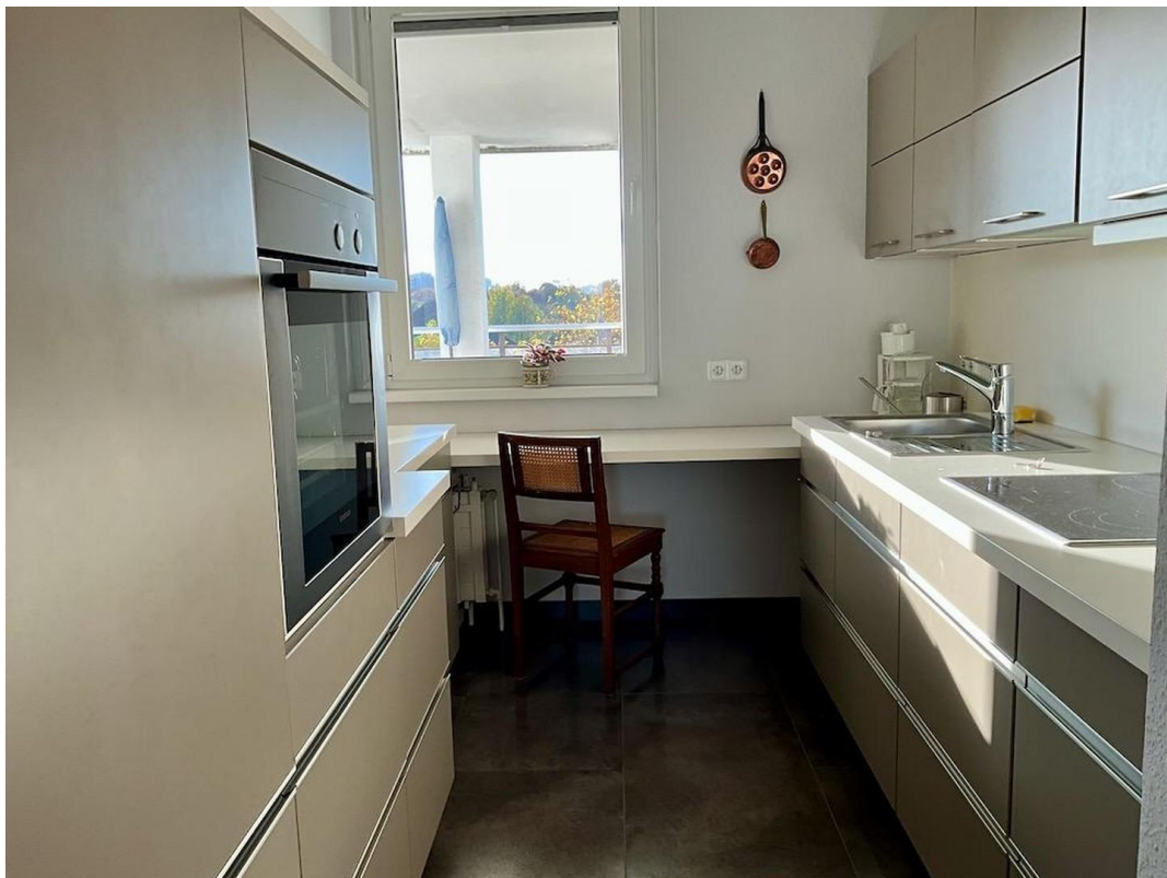
kl. Whg Küche