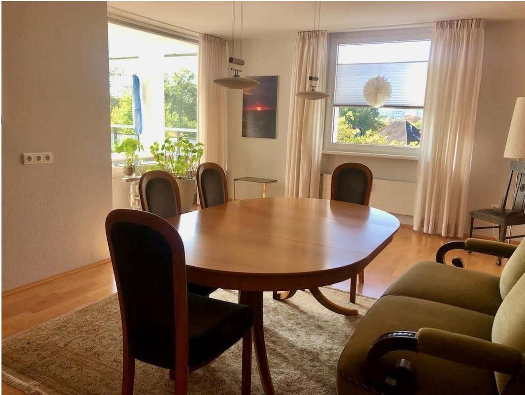
kl. Whg Wohnzimmer