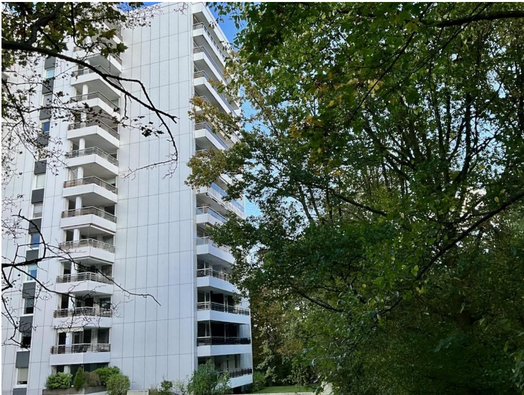
Haus Totale Rückansicht