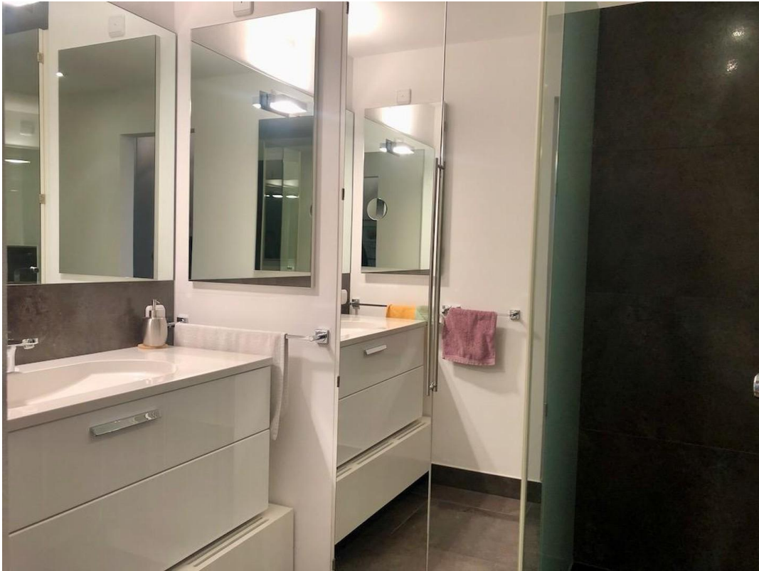
kl. Whg Bad