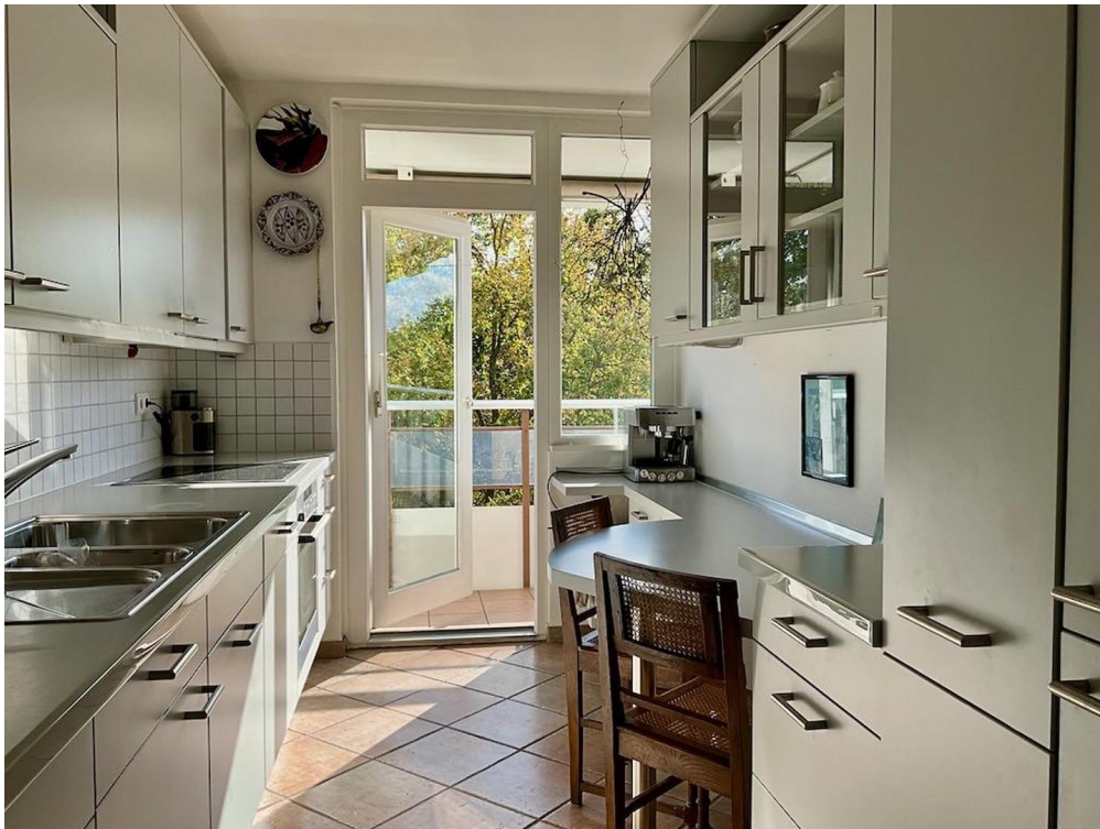
gr. Whg Küche