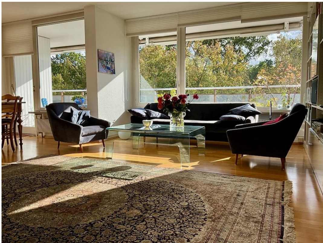
gr. Whg Wohnzimmer