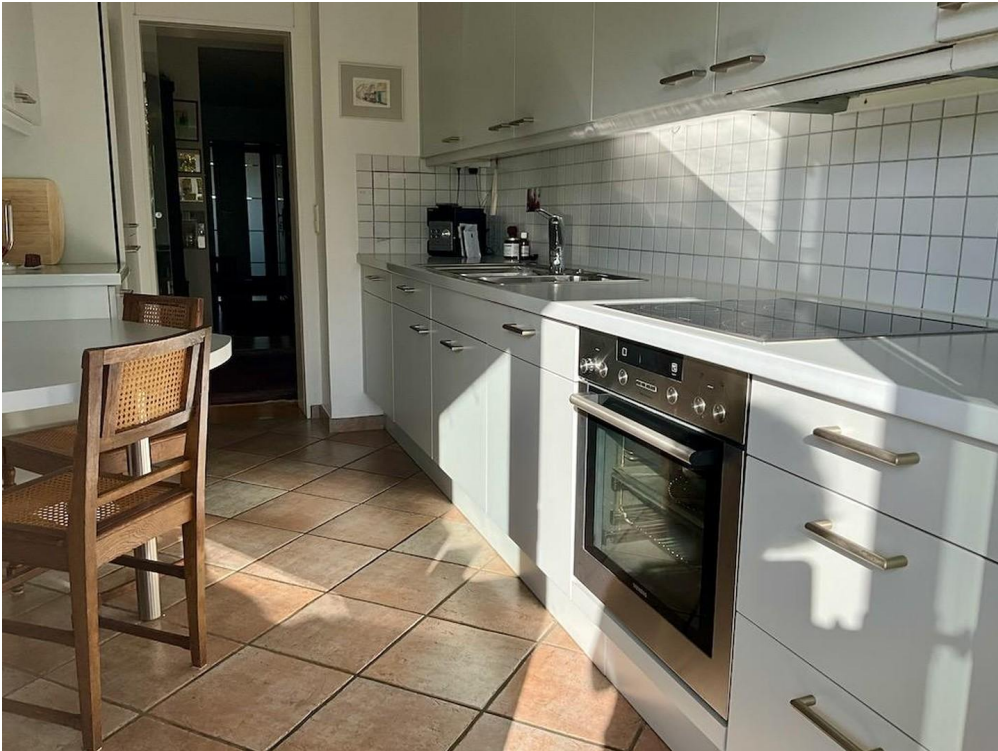
gr. Whg Küche Blick vom Balkon