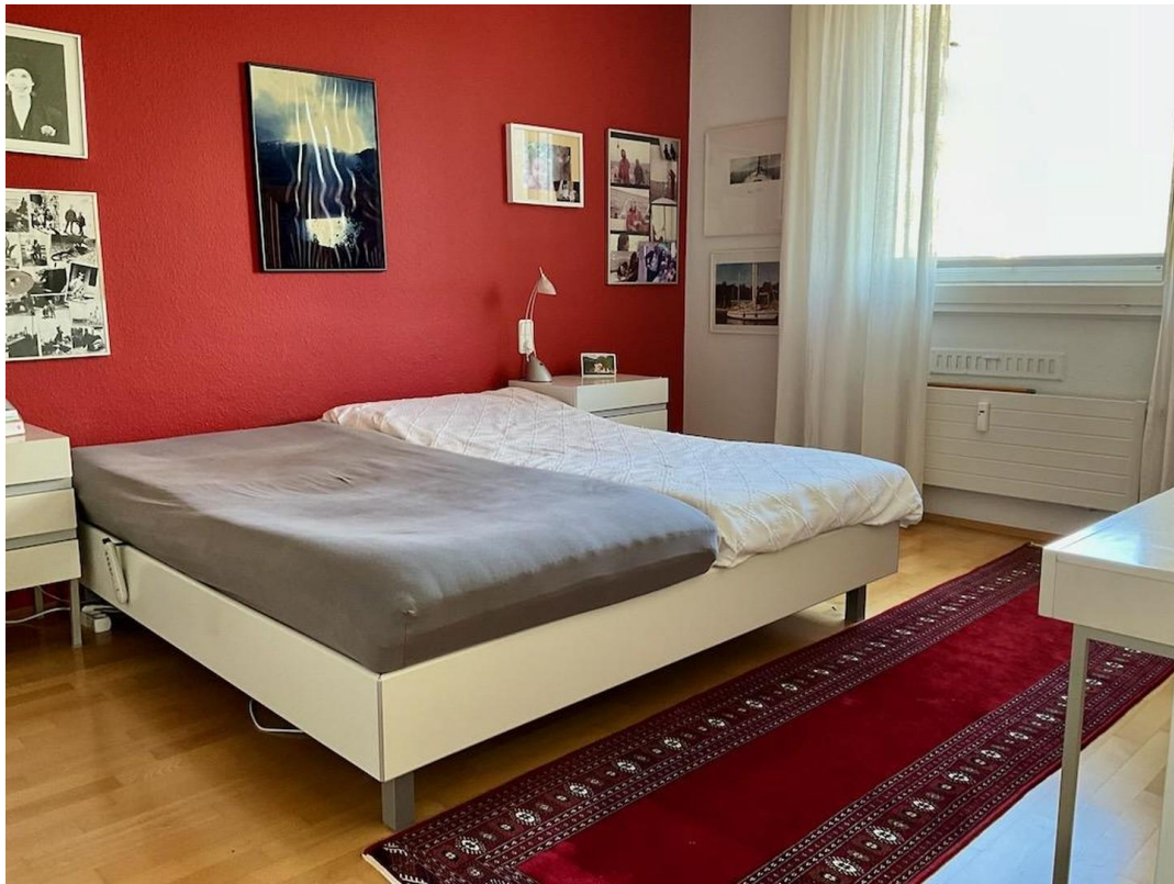
gr. Whg Schlafzimmer