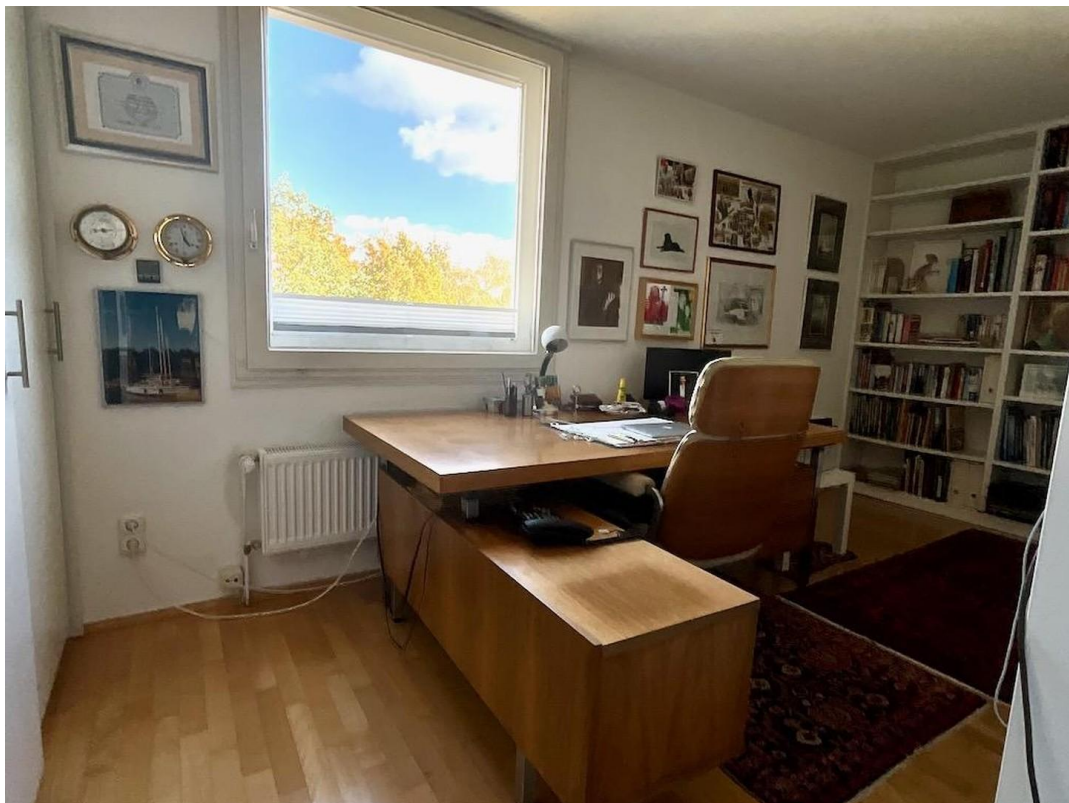
gr. Whg Arbeitszimmer 2