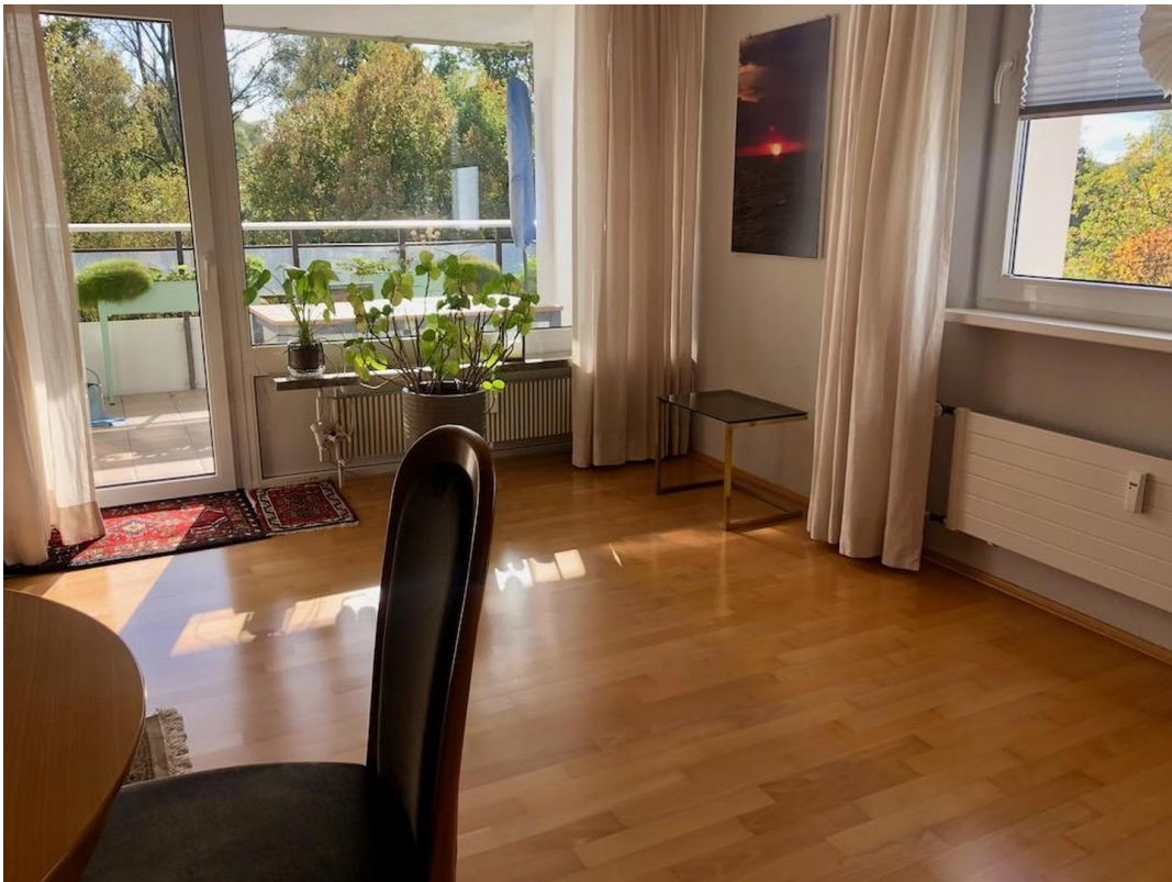
kl. Whg Wohnzimmer