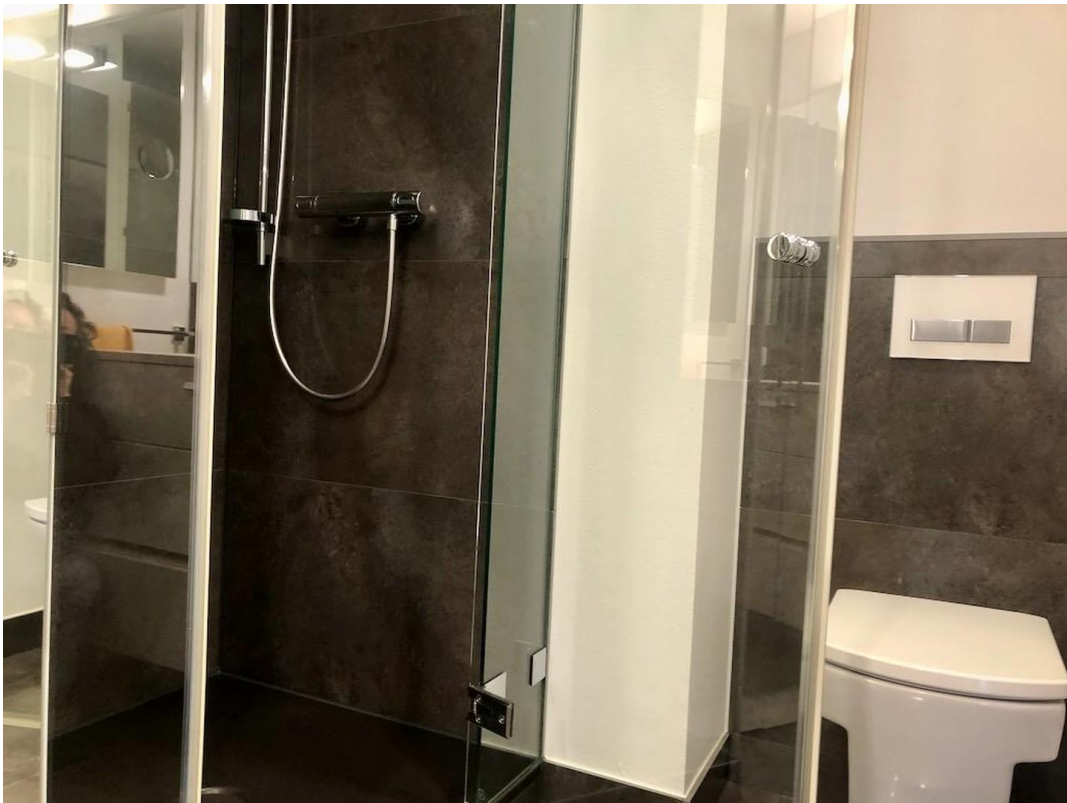
kl. Whg Bad