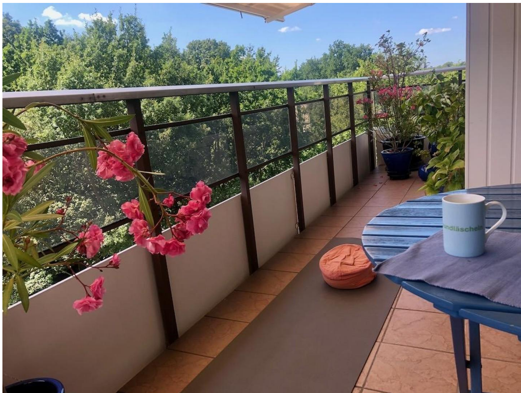
gr. Whg Balkon