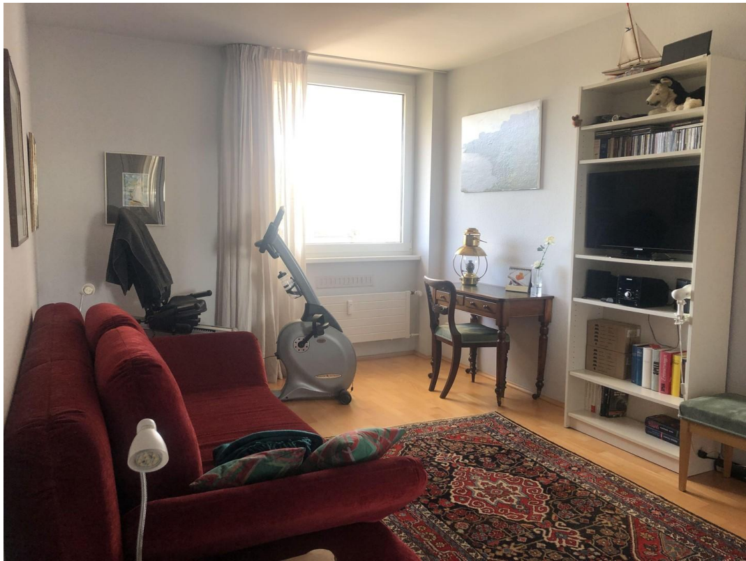
kl. Whg Gästezimmer