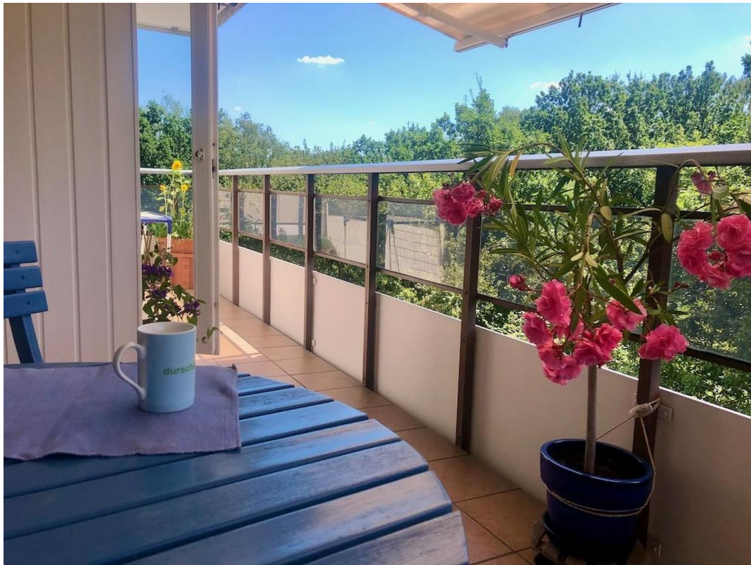
gr. Whg Balkon