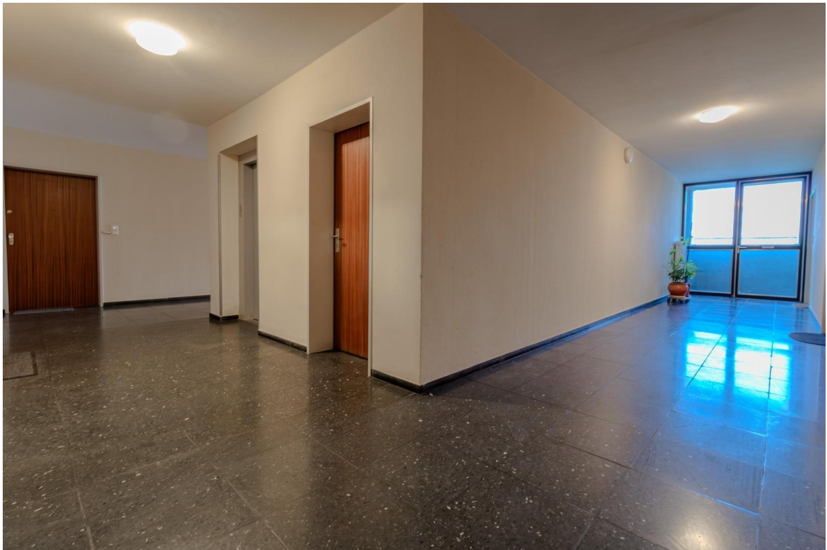
Flur - Haus