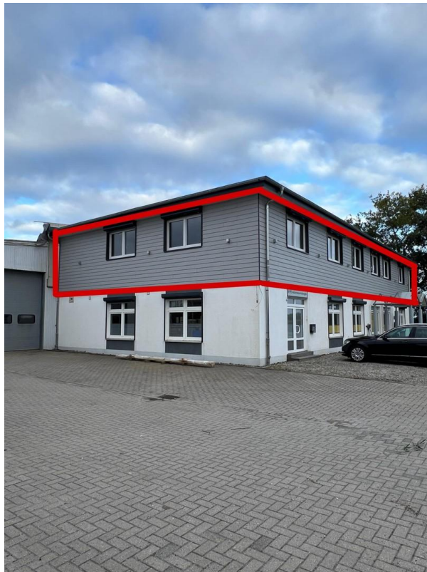
Mietobjekt OG : Straßenseite