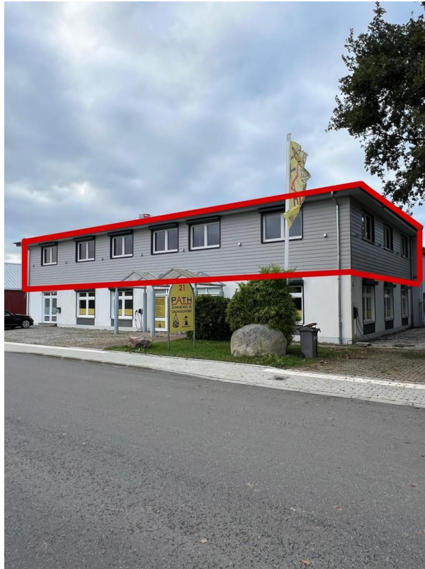
Mietobjekt OG : Straßenseite