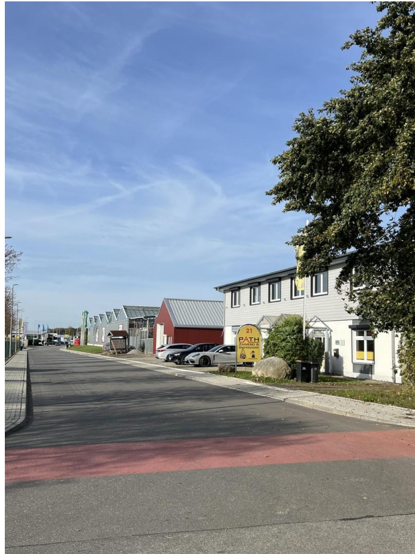
Straße : Am Voßberg