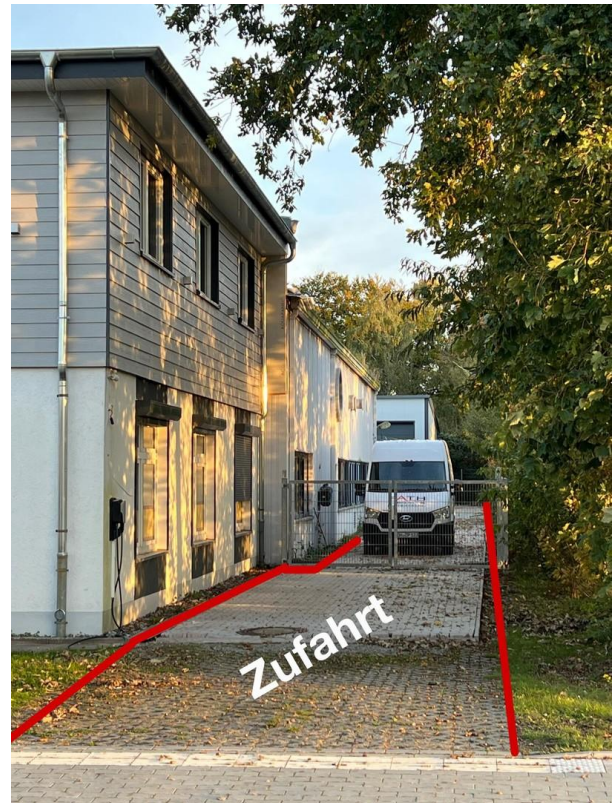
evtl Zufahrt zu den Lagerräumen