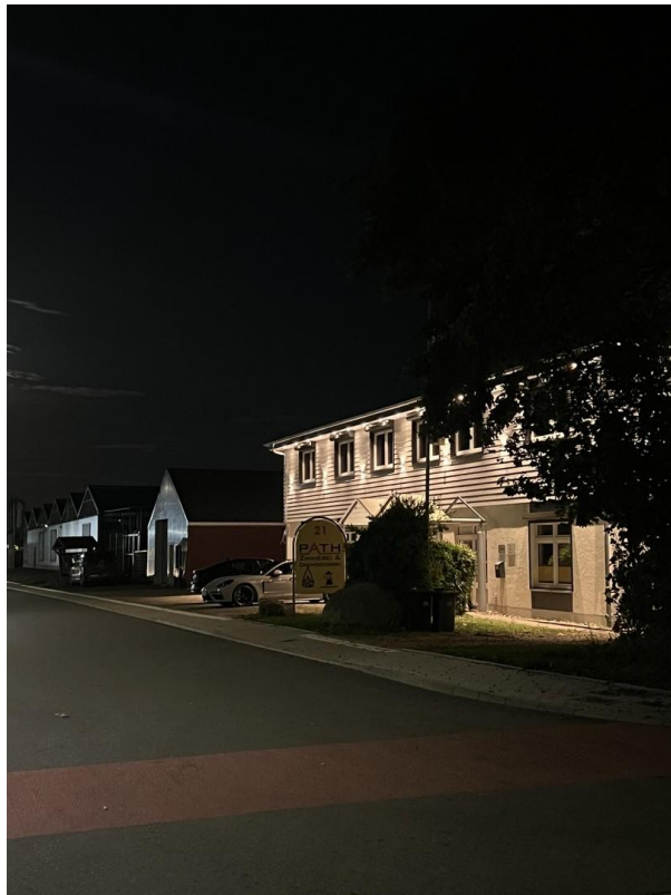
Ansicht von der Straße