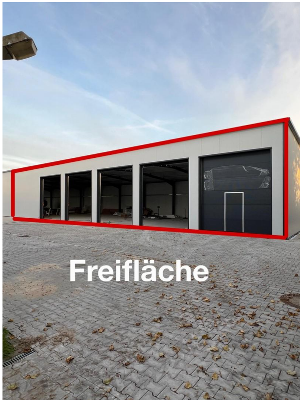
evtl. zu mietbare Lagerräum