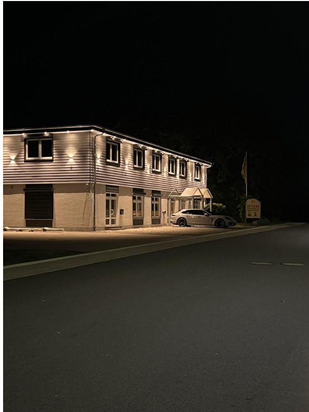
Ansicht von der Straße