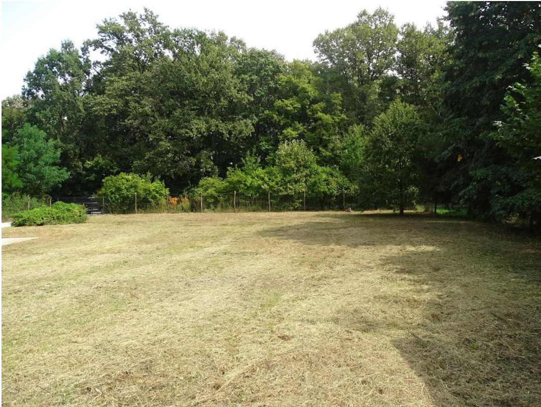
Blick von der Terrasse