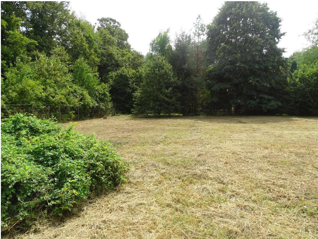
Blick von der Auffahrt