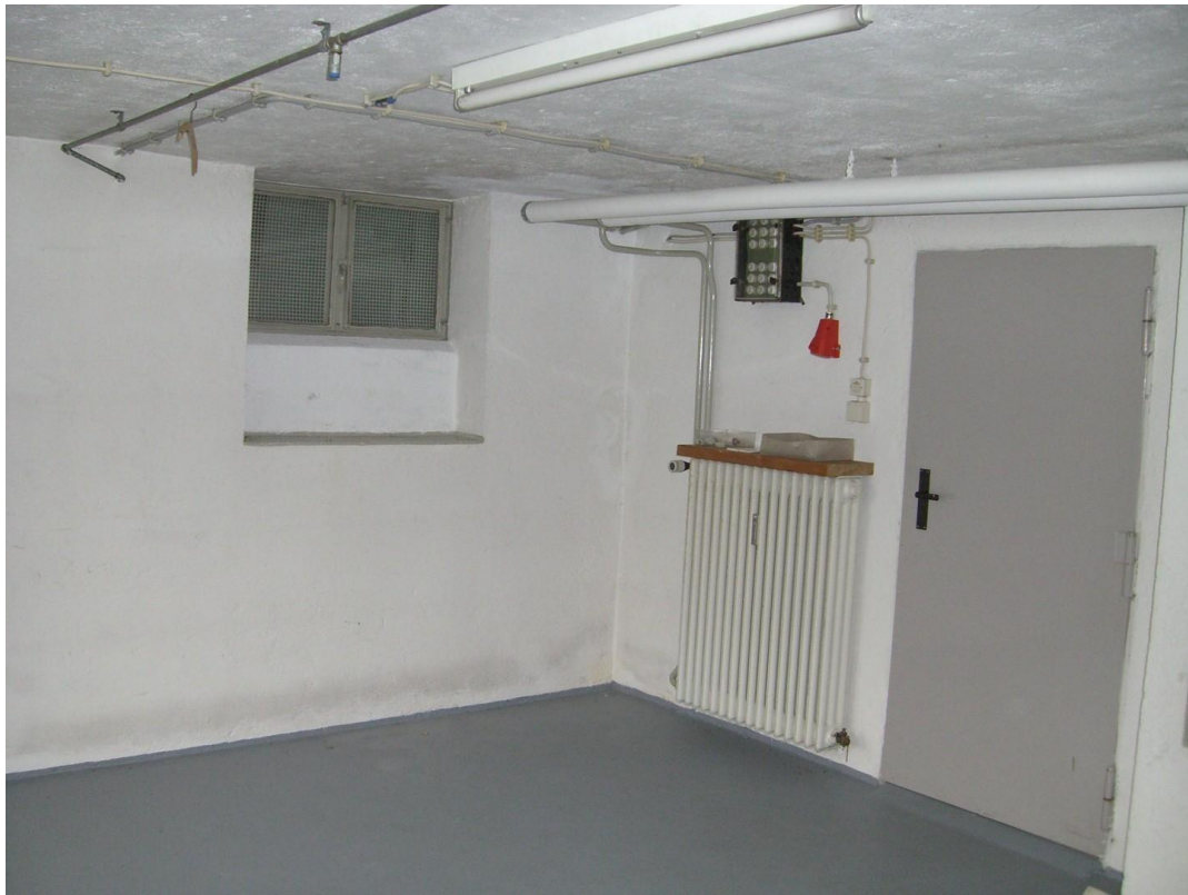
li Seite mit Tür zum allg.Kell