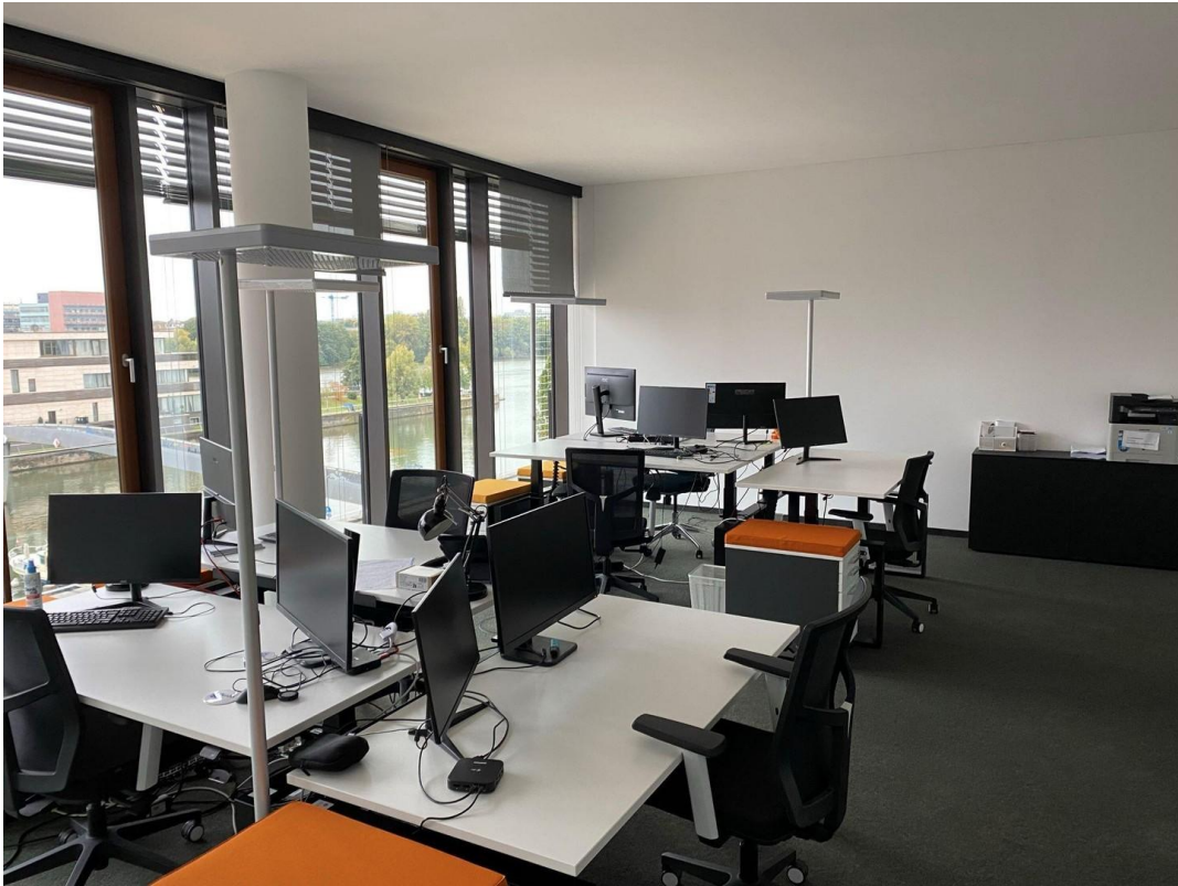
Bürofläche Bild 2