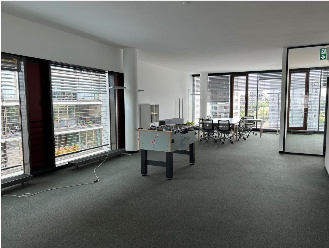
Lounge- und Relaxbereich