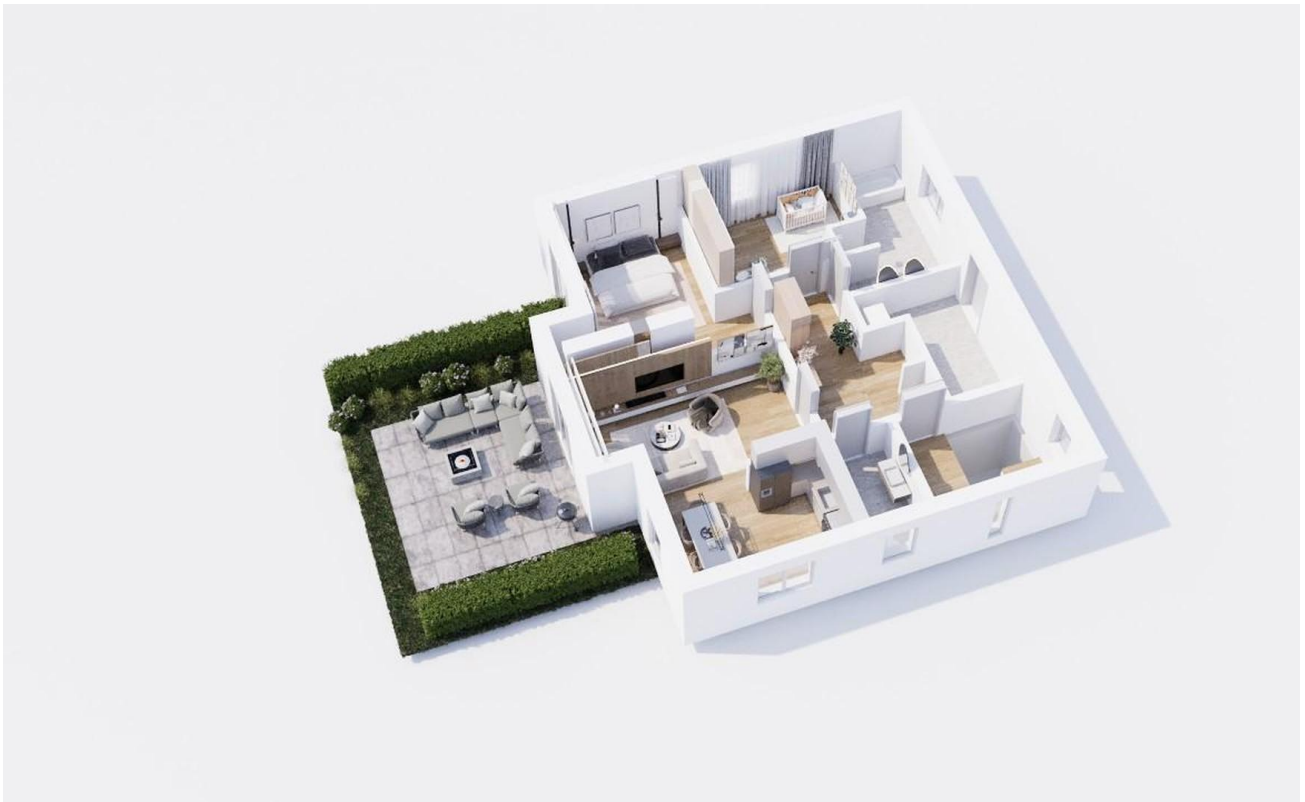
EG - Grundriss 3D