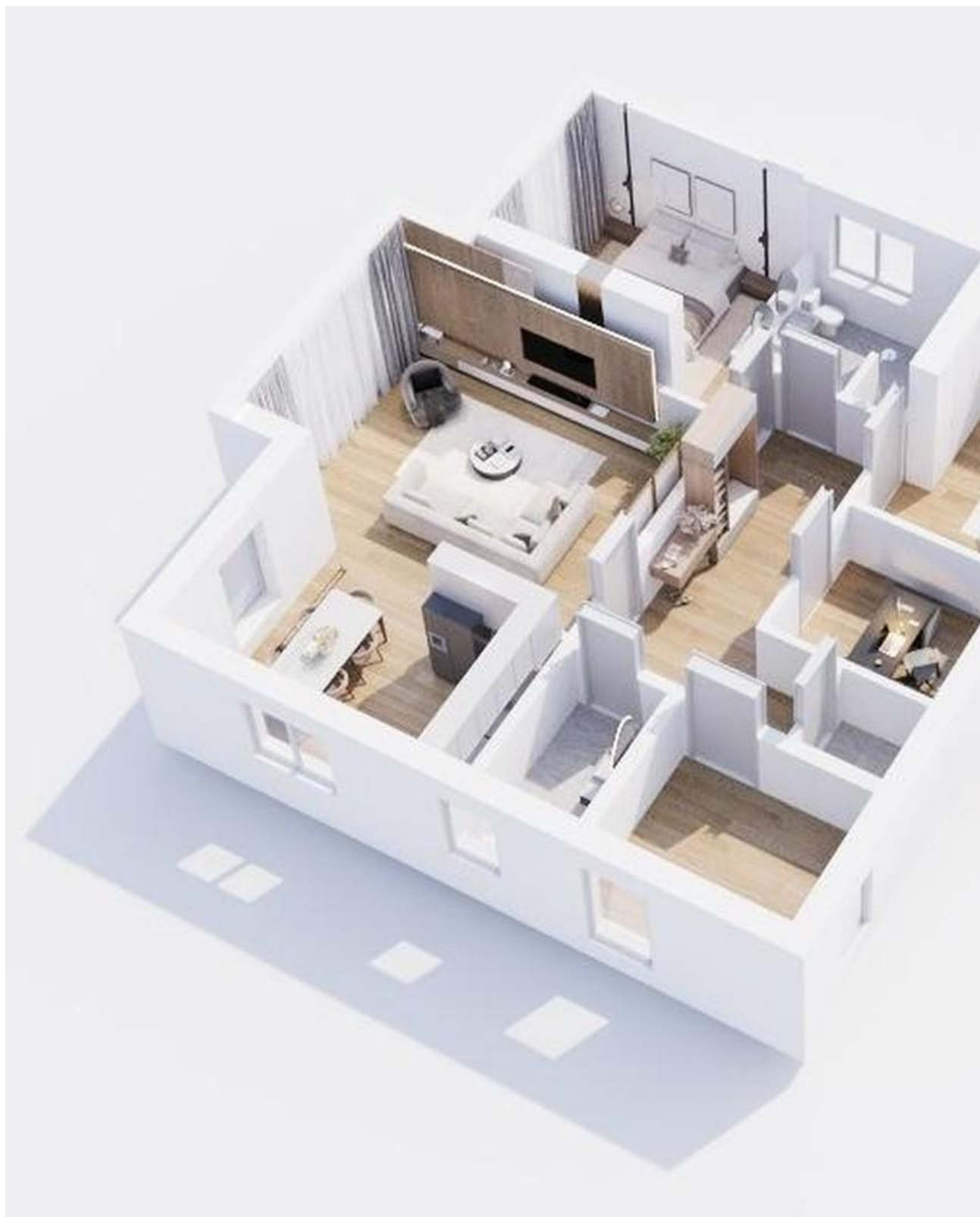
OG - Grundriss 3D