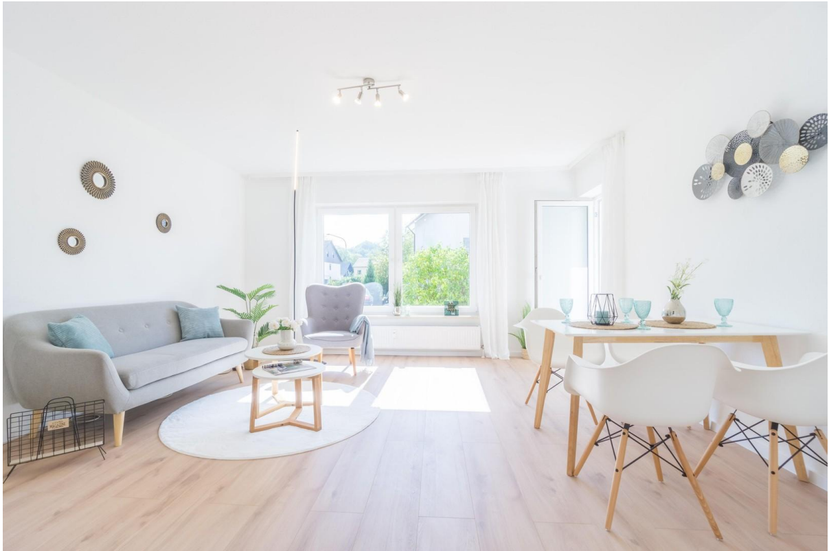
Wohnzimmer mit Südbalkon