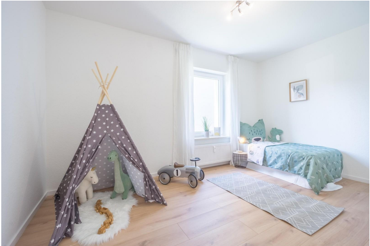
Kinderzimmer oder Büro