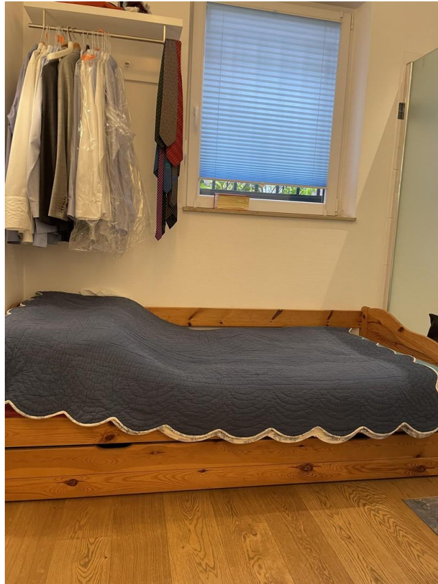
Dusche/Toilette privat 3