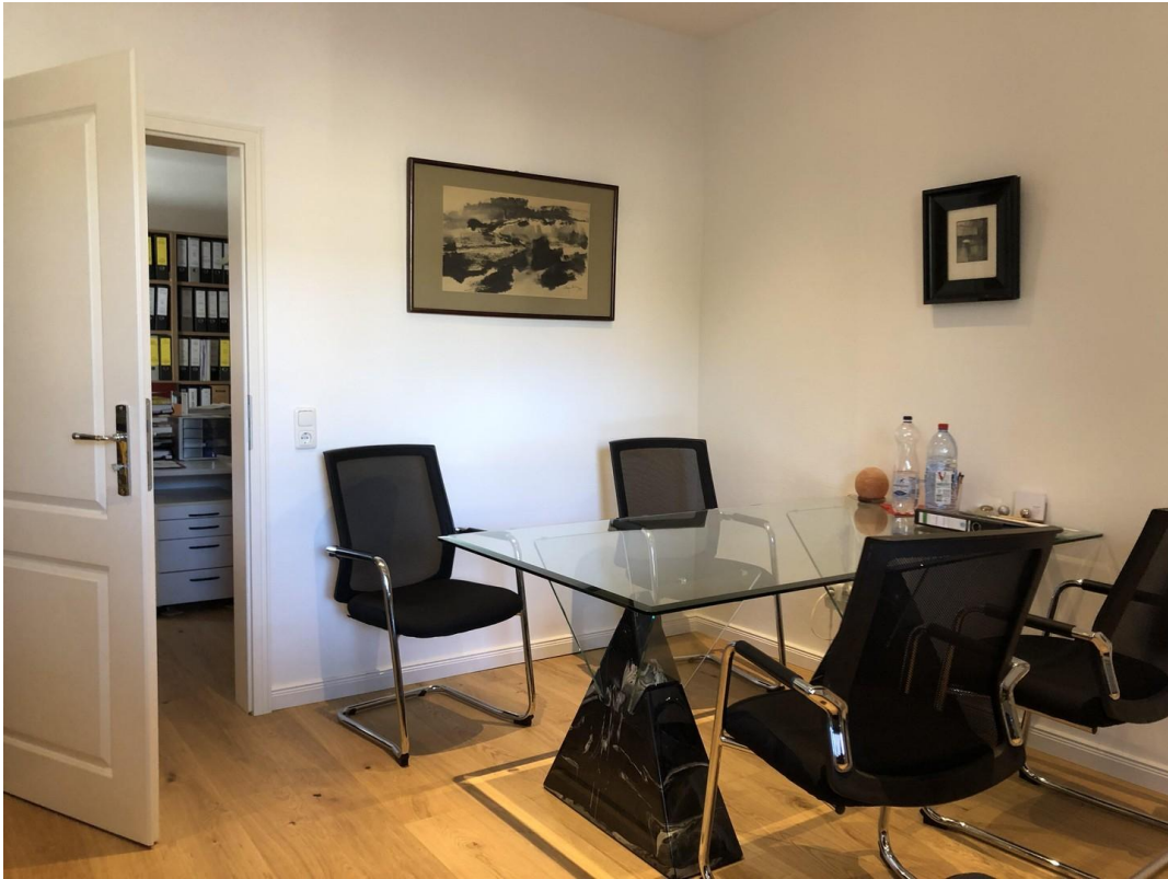
Büro groß 2