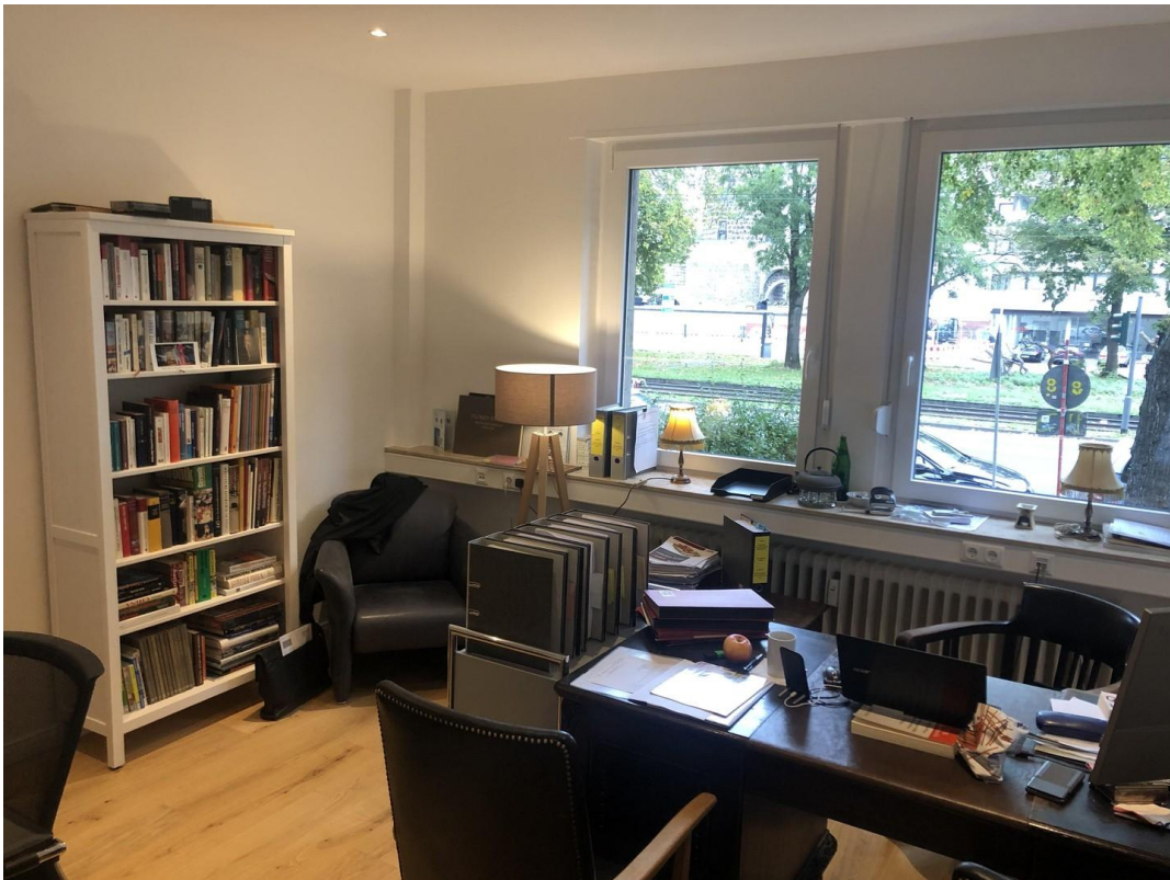
Büro groß 1