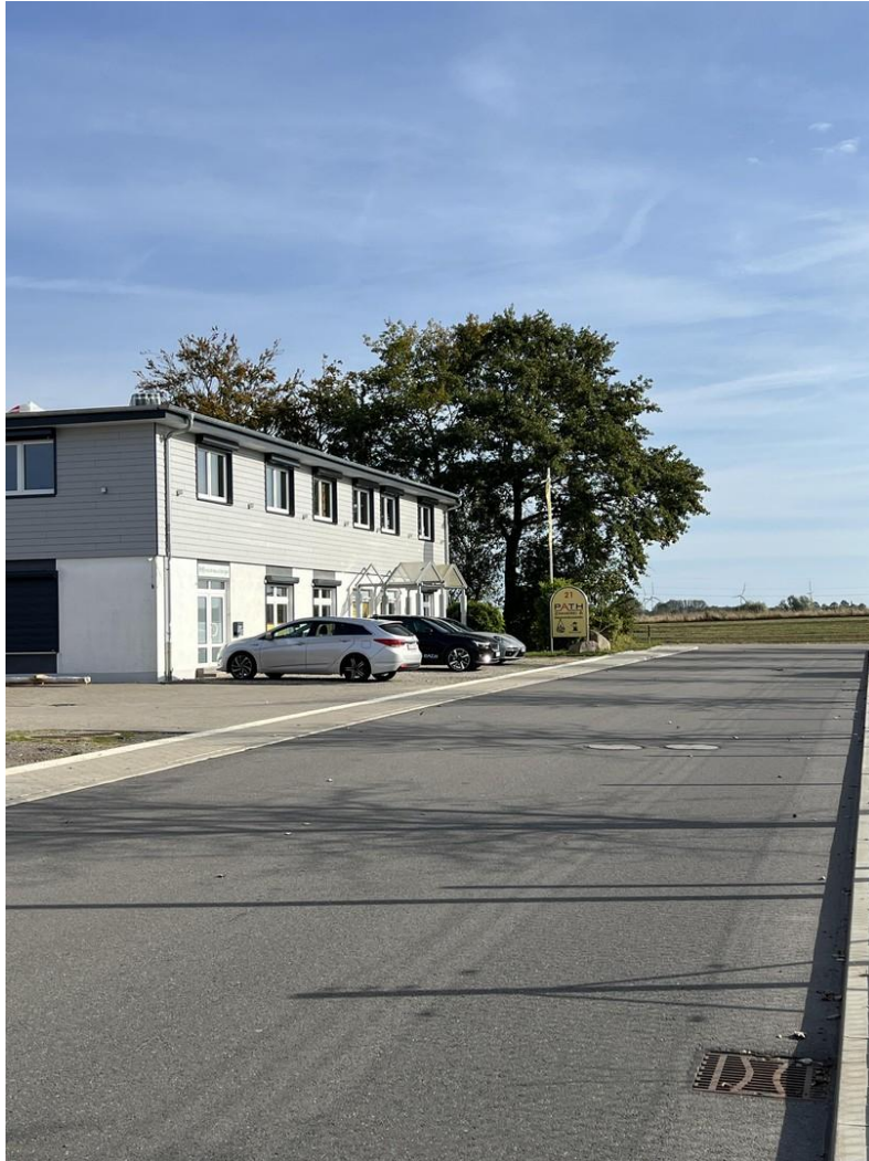
Straße: Am Voßberg,Zuwegung