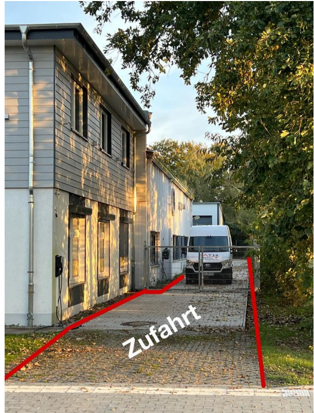
Zufahrt rechts vom Hauptgebäude