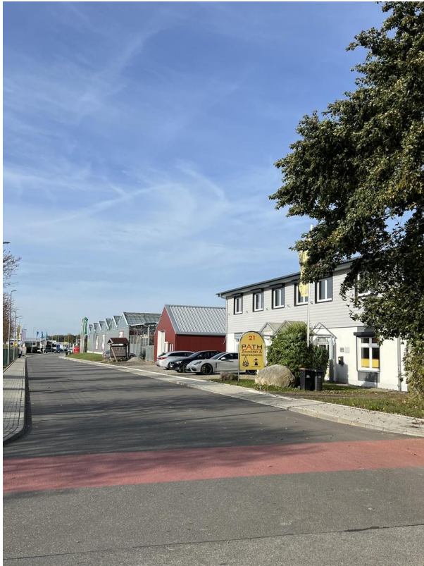
Straße: Am Voßberg / Zuwegung