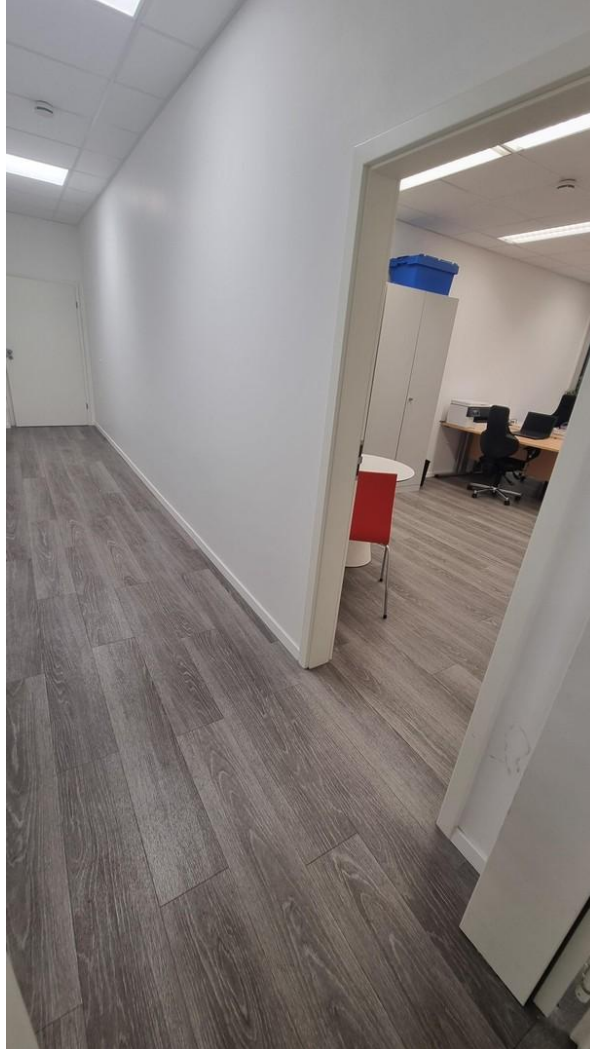
Eingang mit Blick ins Büro