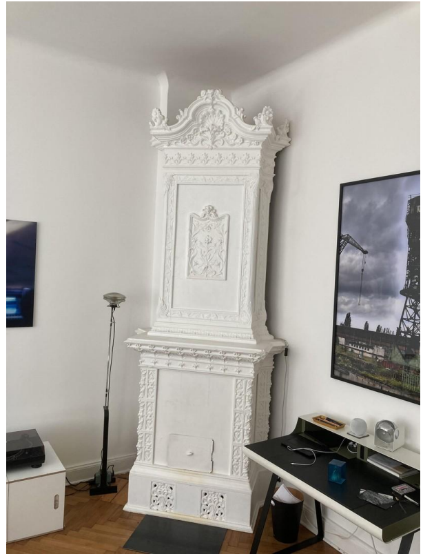
Kachelofen Zimmer 1