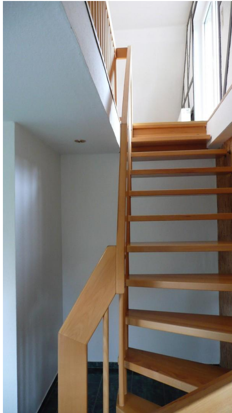
Flur Aufgang zum OG