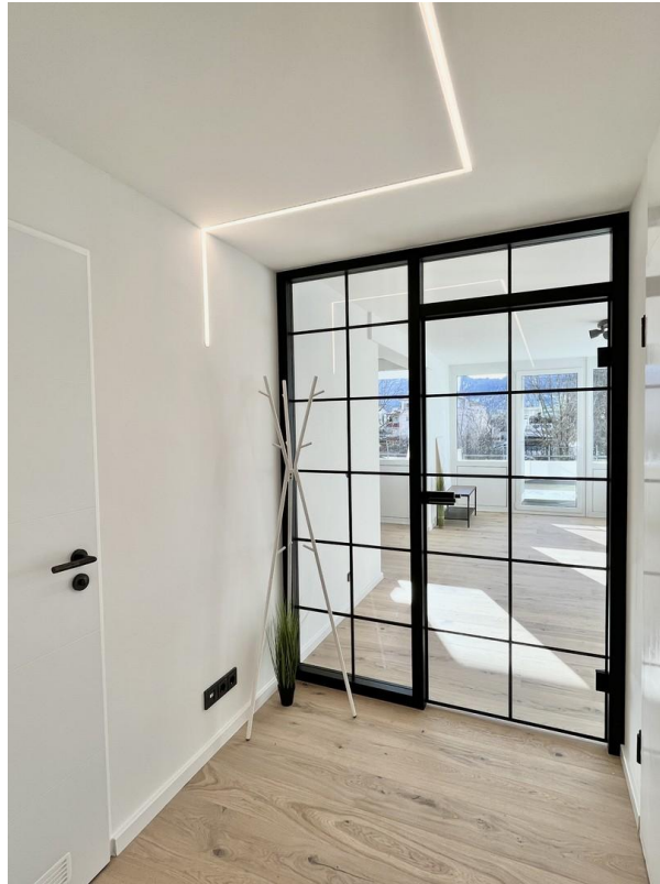
Flur / Eingangsbereich