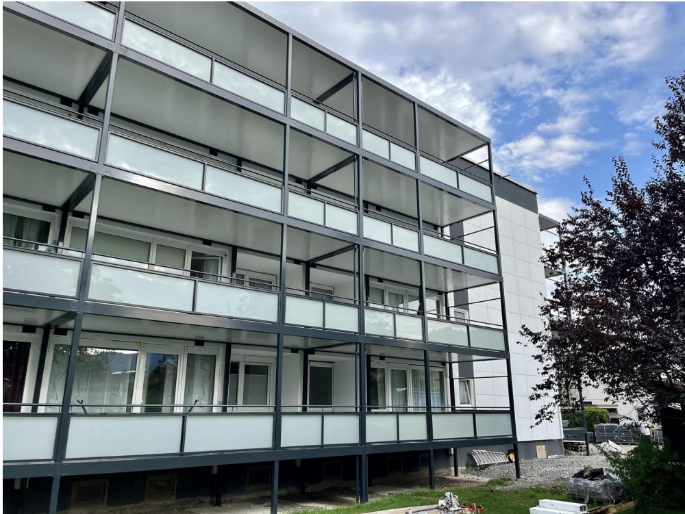
Neue Fassade + Stahlbalkone