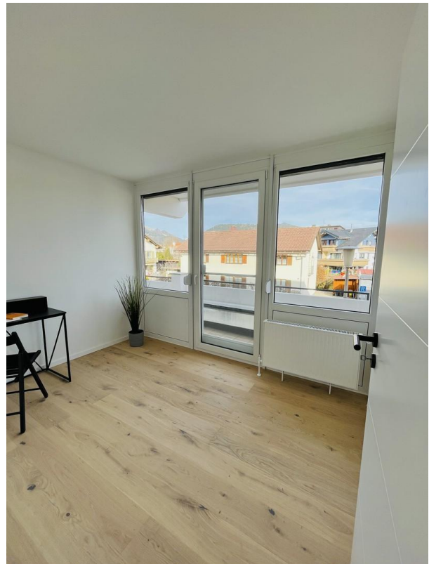
Kinderzimmer / Schlafen 3