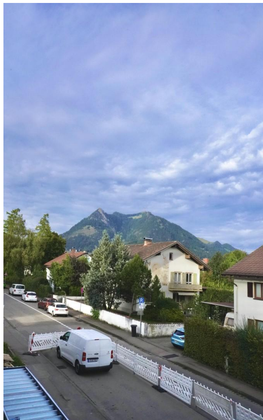
Ausblick Grünen (Balkon)