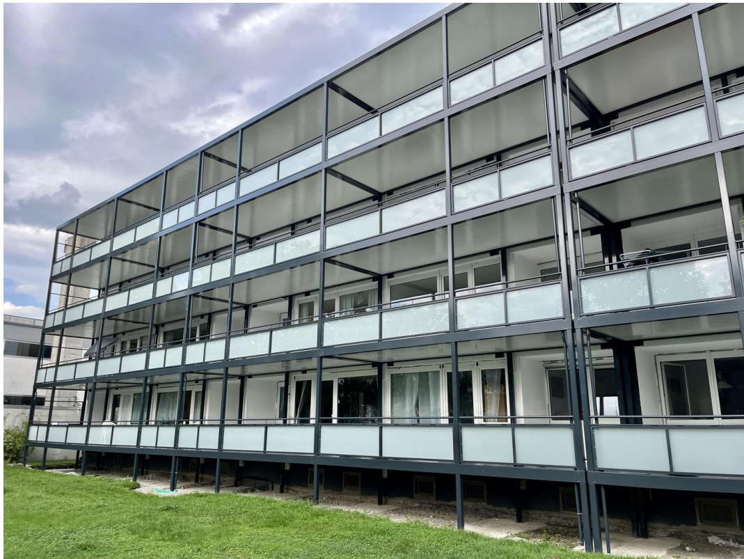
Neue Fassade + Stahlbalkone