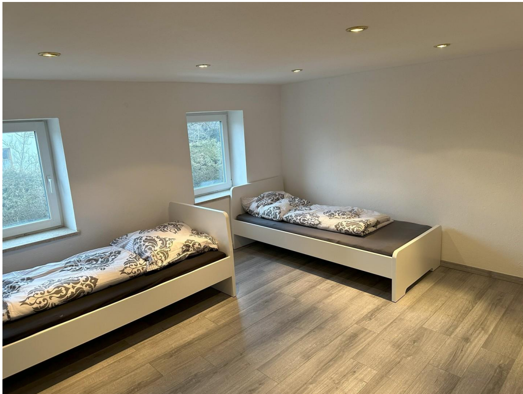
OG Schlafbereich/ Wohnbereich