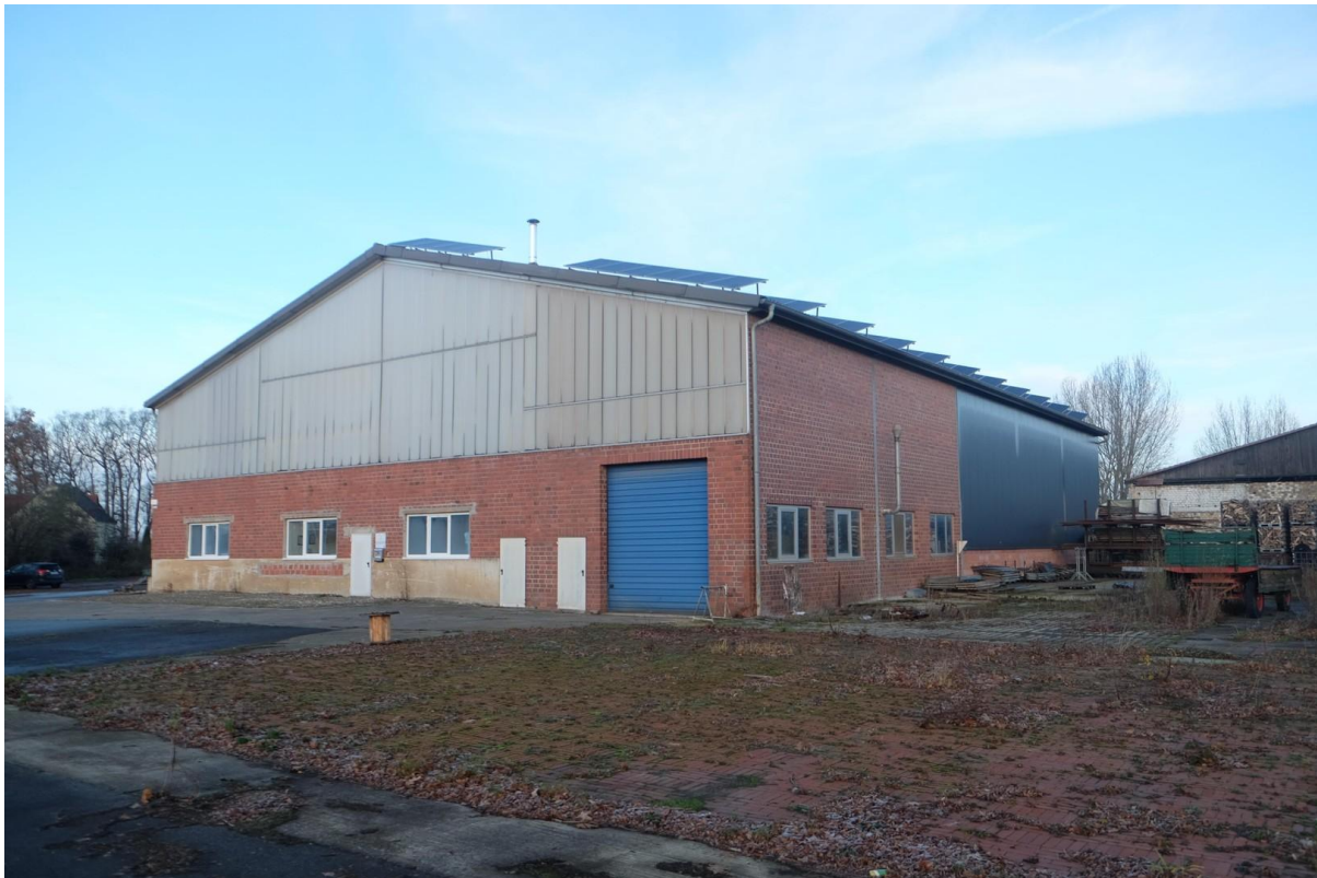
Gebäude 1 SüdOst