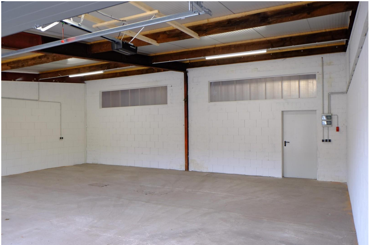
Gebäude 2 - 100 m 2 - Innen