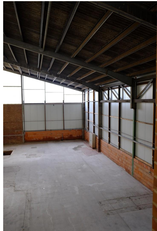
Gebäude 1 Innen