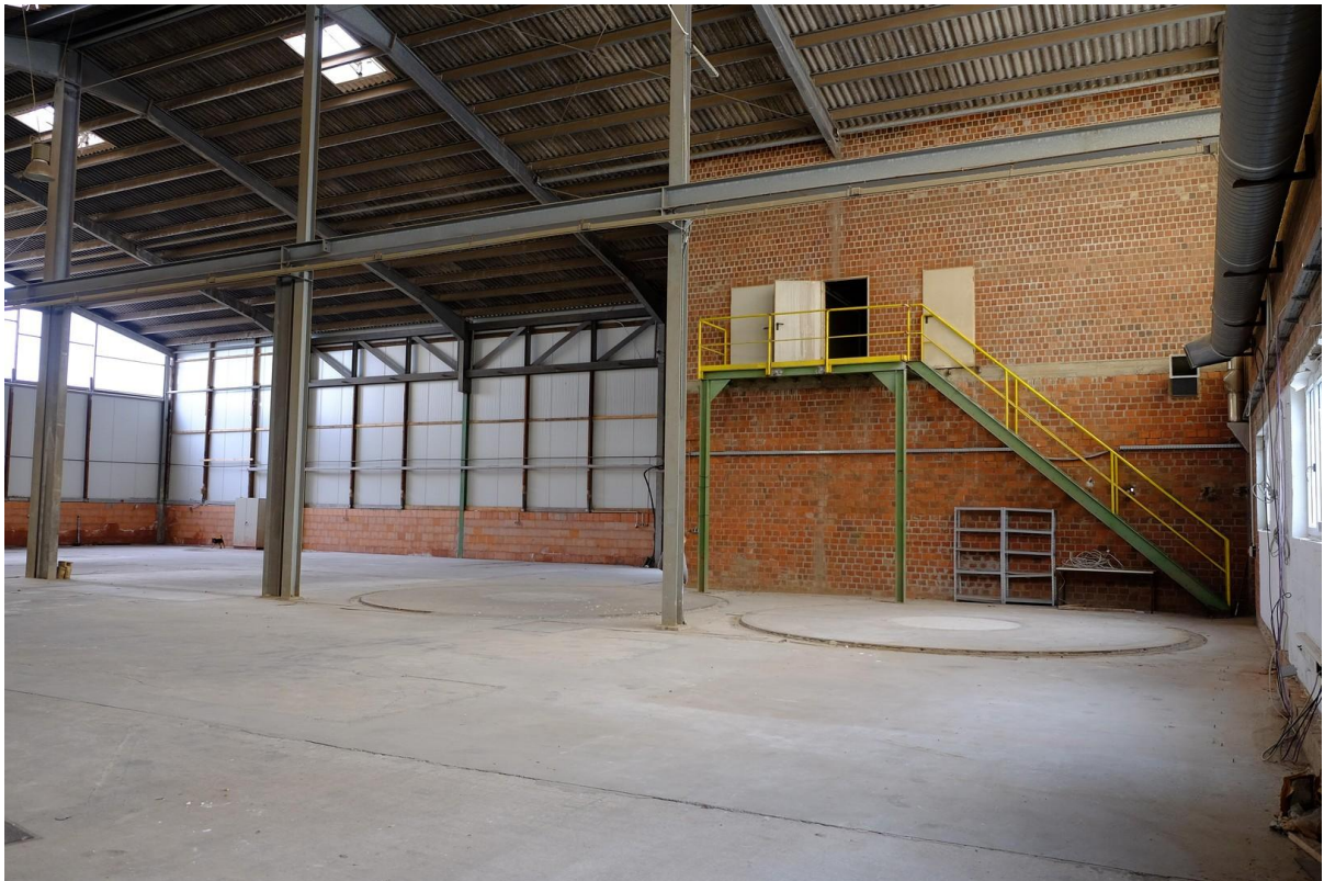
Gebäude 1 Innen