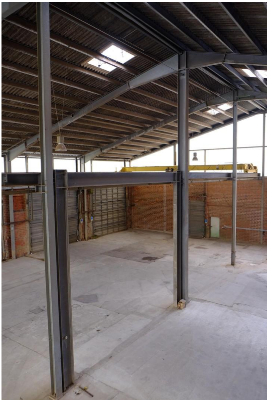
Gebäude 1 Innen