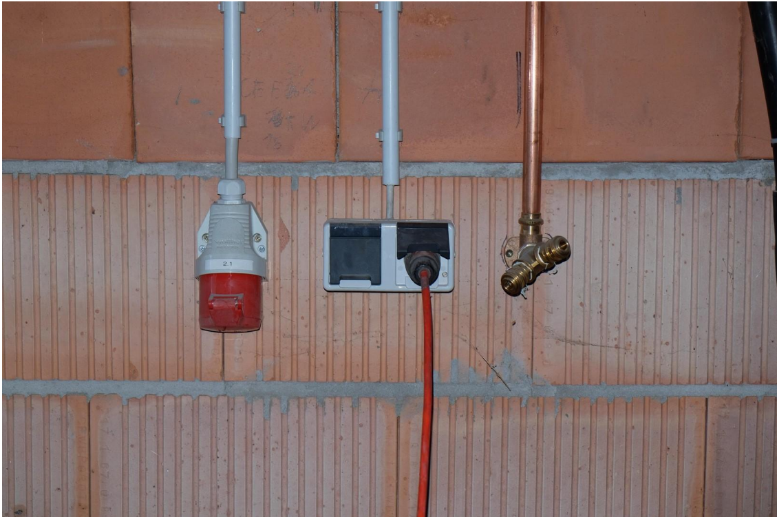
Gebäude 1 Technik