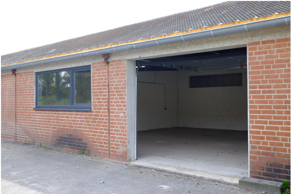
Gebäude 2 Front