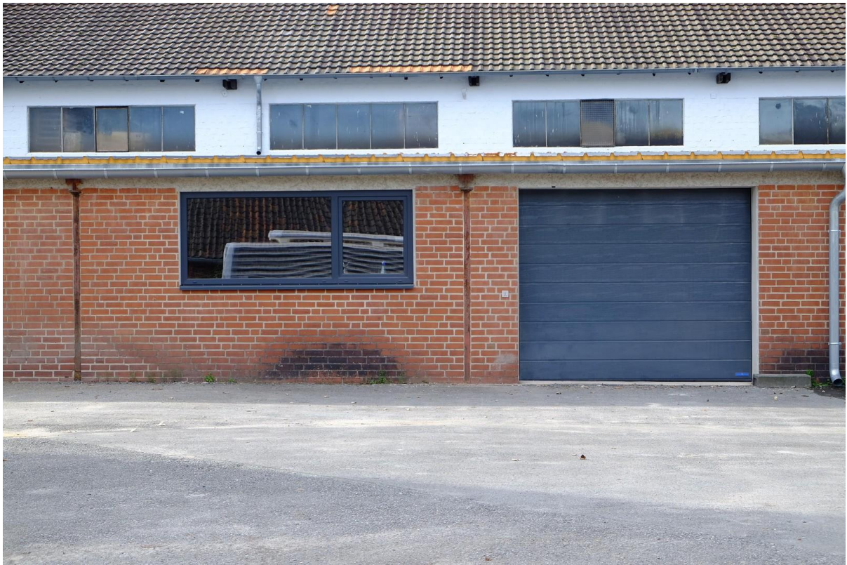
Gebäude 2 Sektionaltor