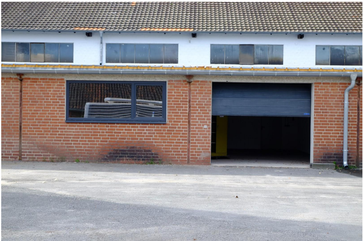
Gebäude 2 Sektionaltor