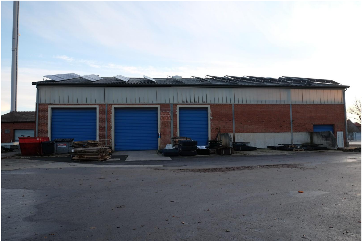
Gebäude 1 West