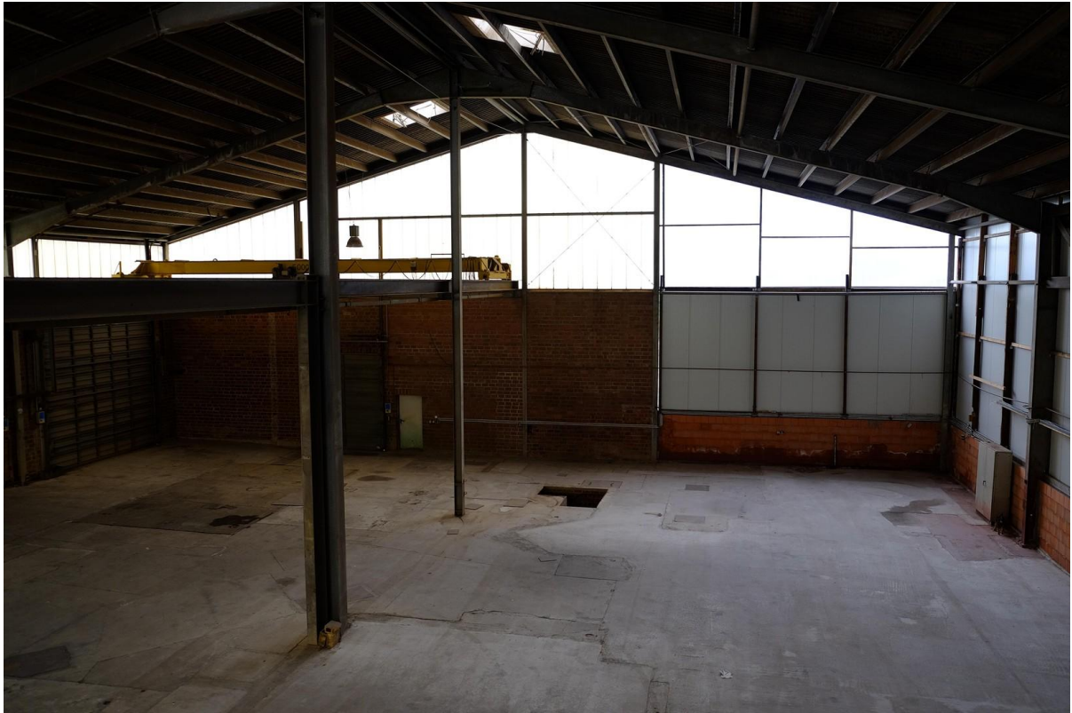
Gebäude 1 Innen