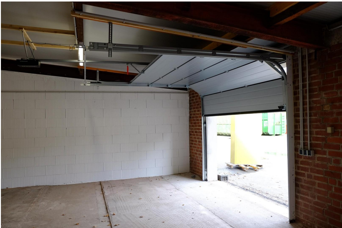
Gebäude 2 Sektionaltor