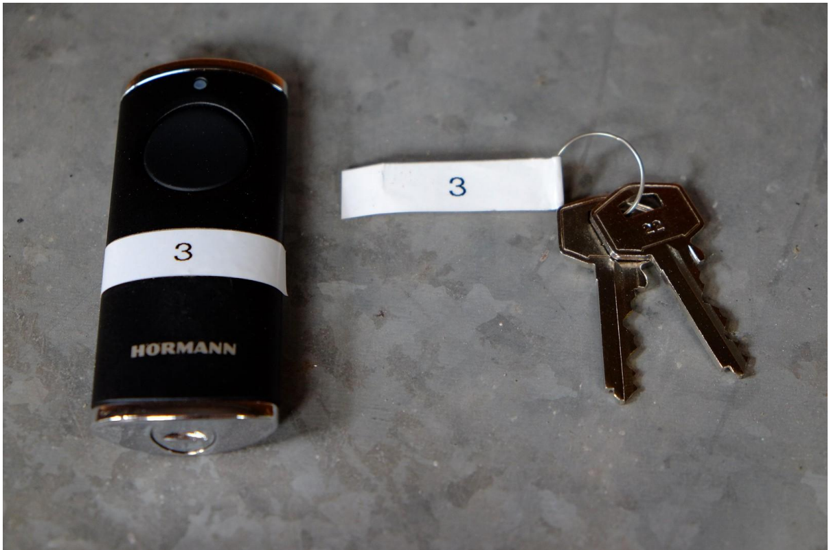
Gebäude 2 Bedienung / Schlüss