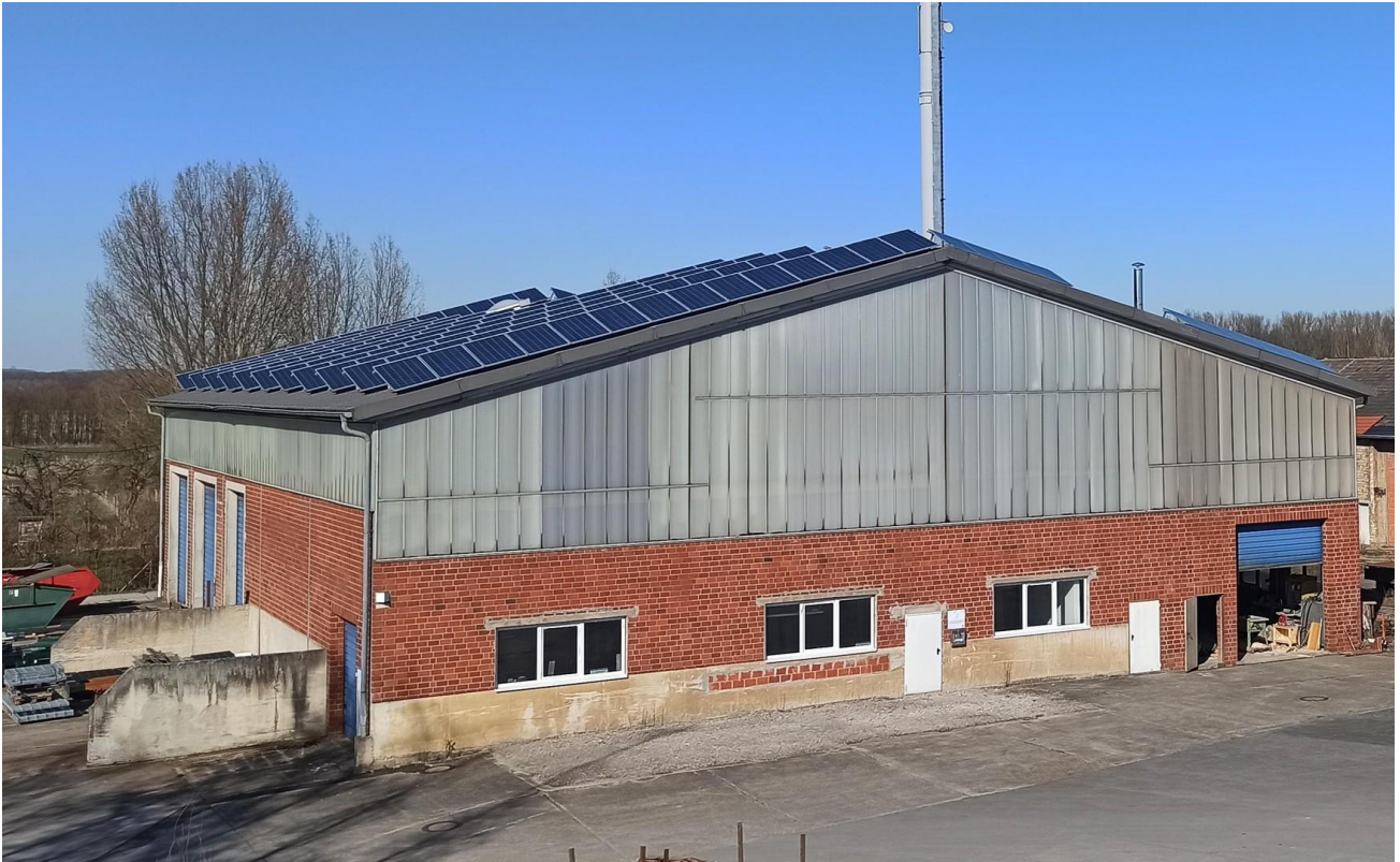
Gebäude 1 Süd