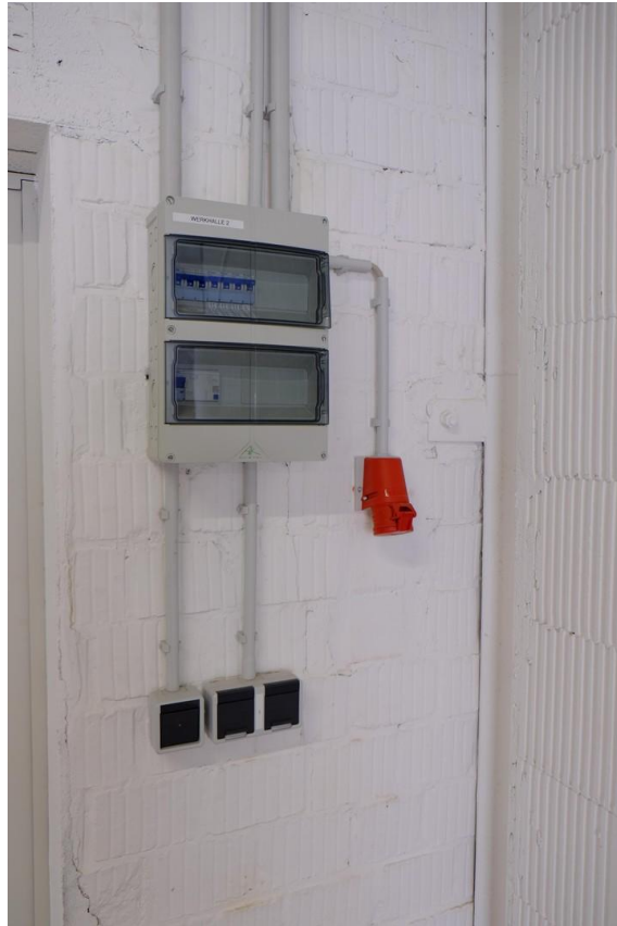
Gebäude 2 Technik