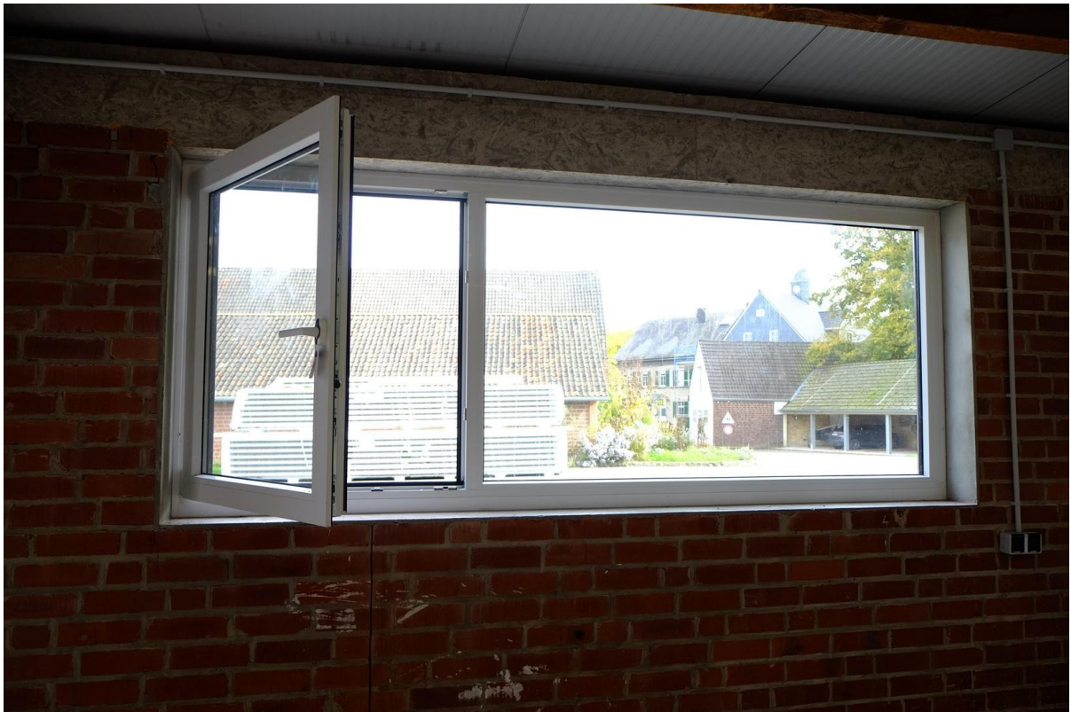
Gebäude 2 - 100 m 2 - Fenster