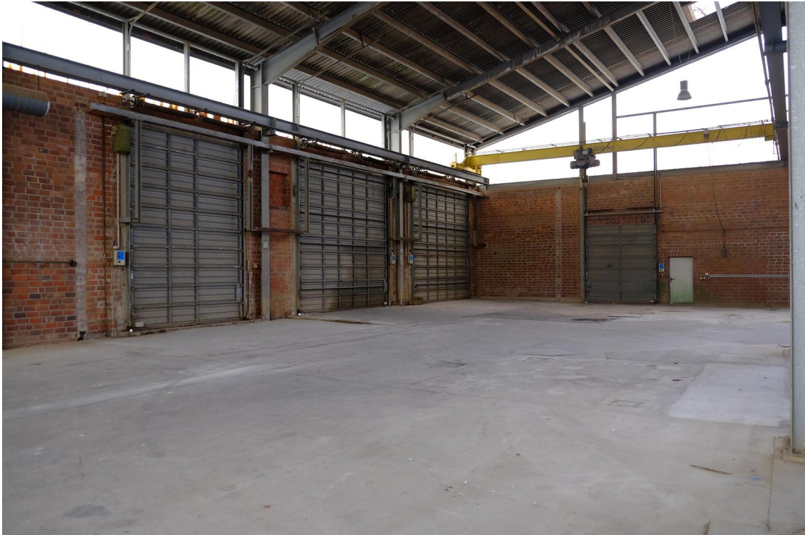
Gebäude 1 Innen