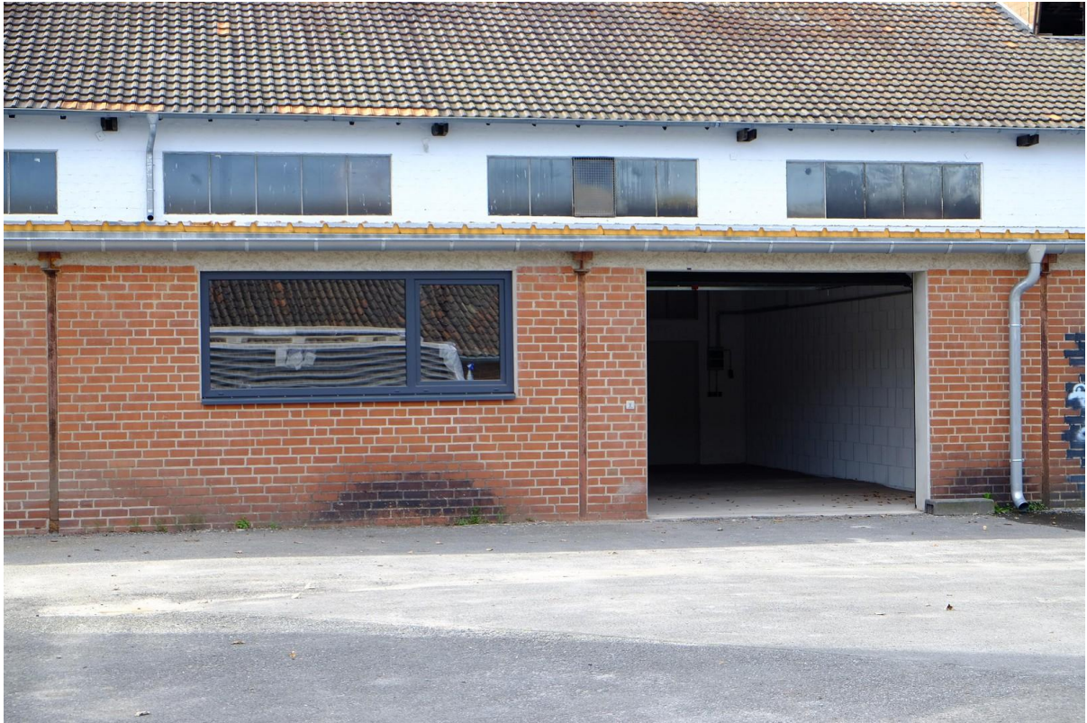
Gebäude 2 - 100 m 2 - Front