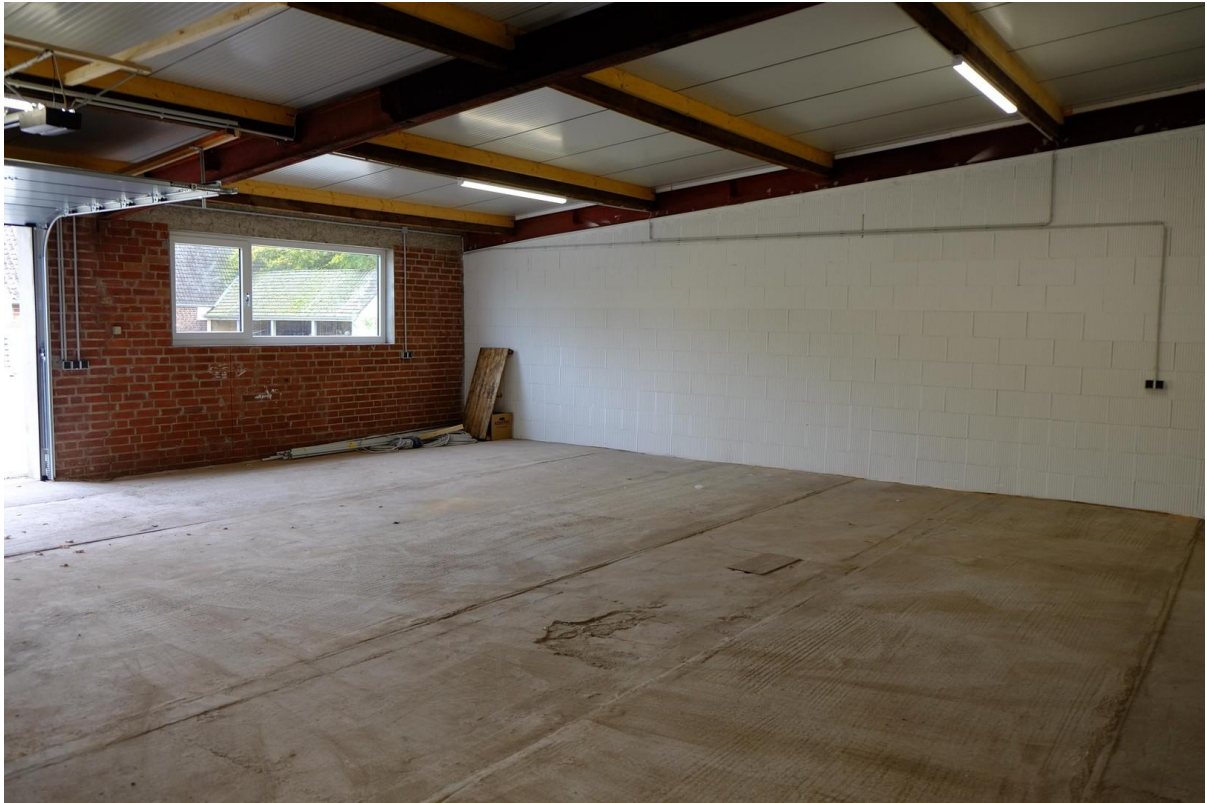
Gebäude 2 - 100 m 2 - Innen