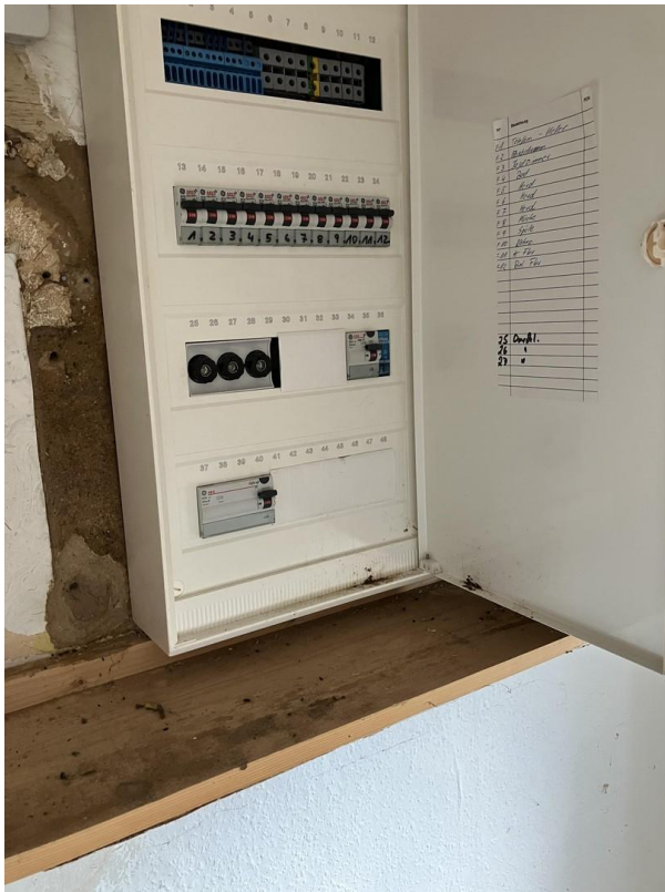
Obergeschoß Elektro Unterverte