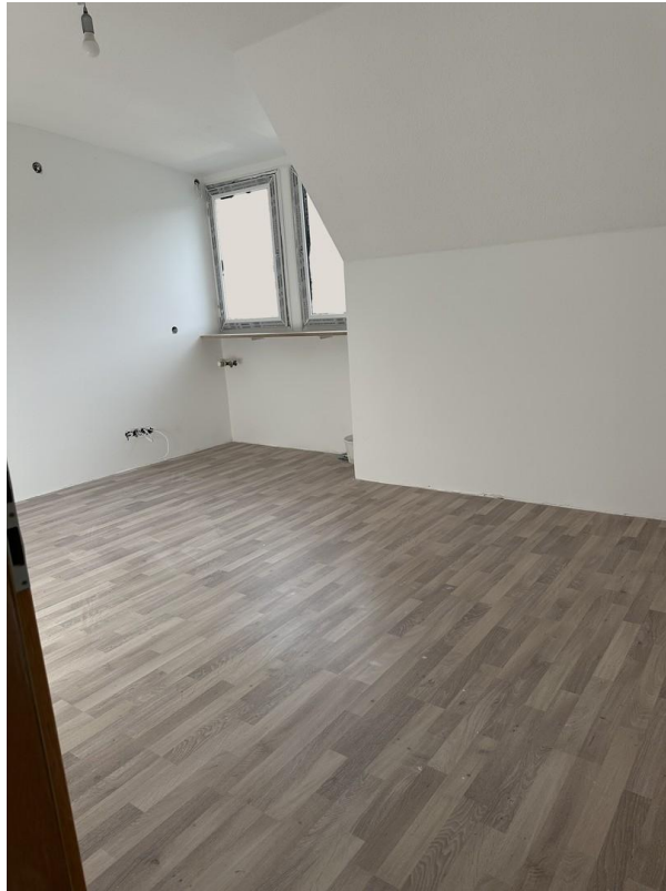
Schlafzimmer (noch Baustelle!)