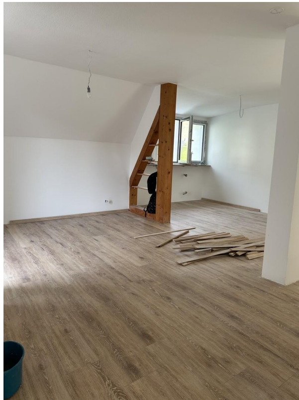
Wohnen_Essen (noch Baustelle!)