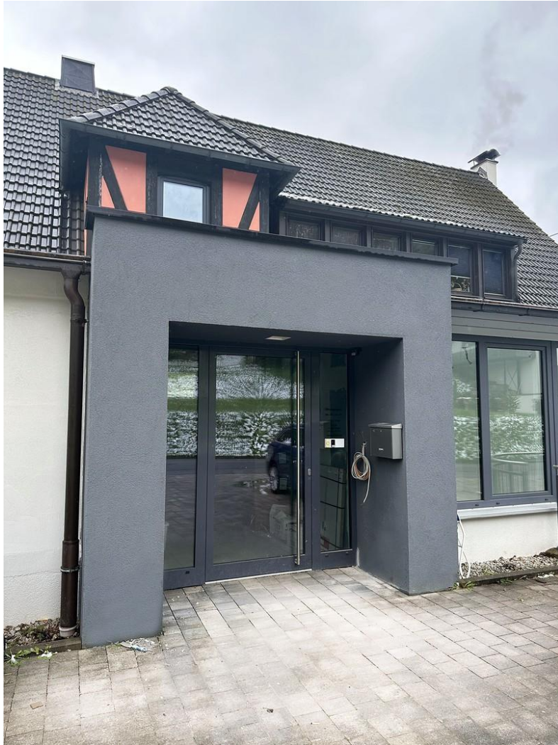
Eingang (noch Baustelle!)