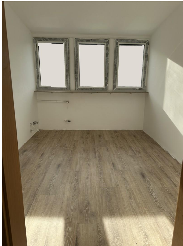
Kinderzimmer (noch Baustelle!)