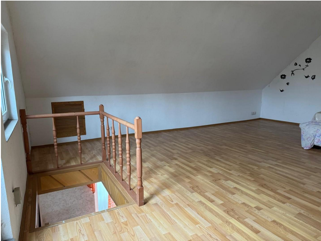
Schlafzimmer 2. OG