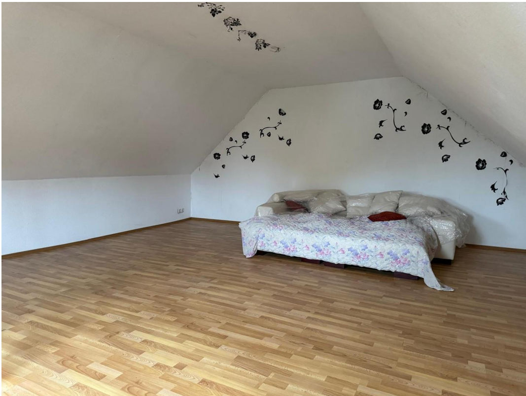
Schlafzimmer 2. OG