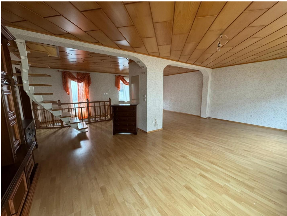
Wohn-Ess-Zimmer 1. OG