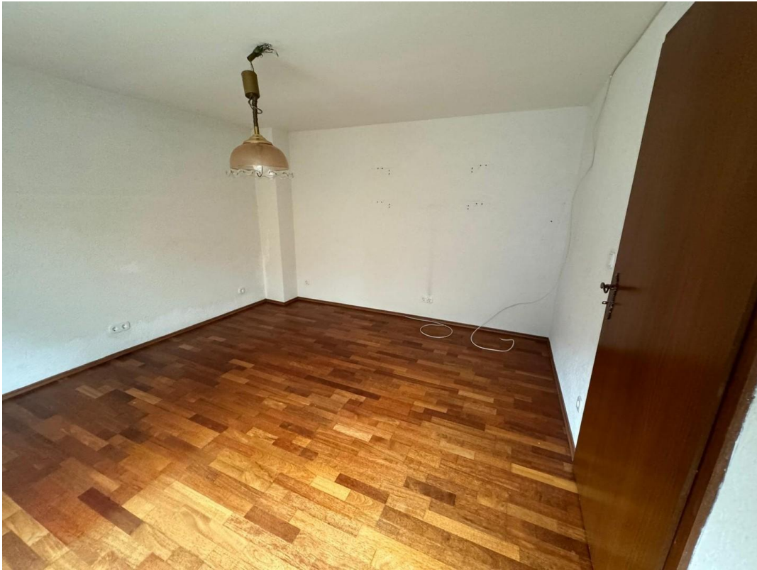
2. Schlafzimmer EG