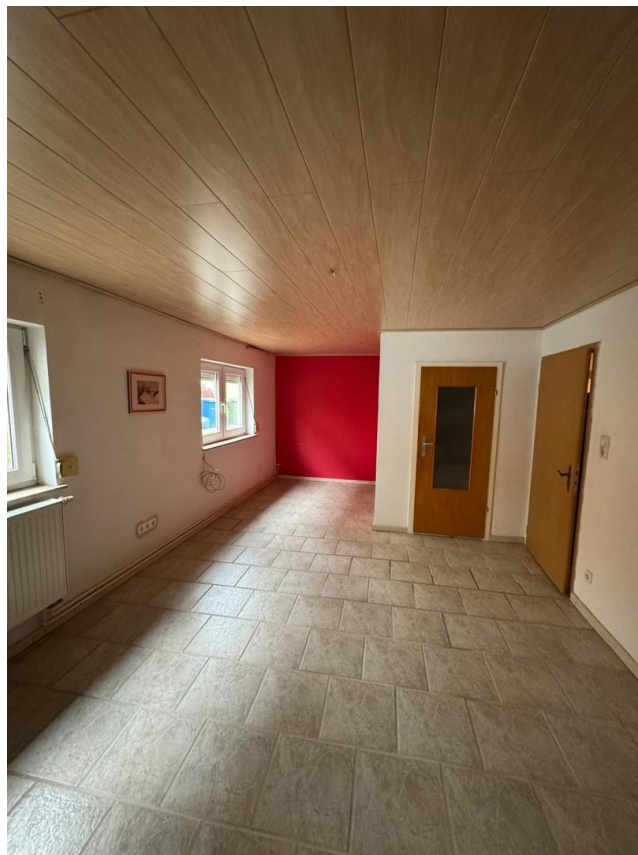
1. Schlafzimmer EG