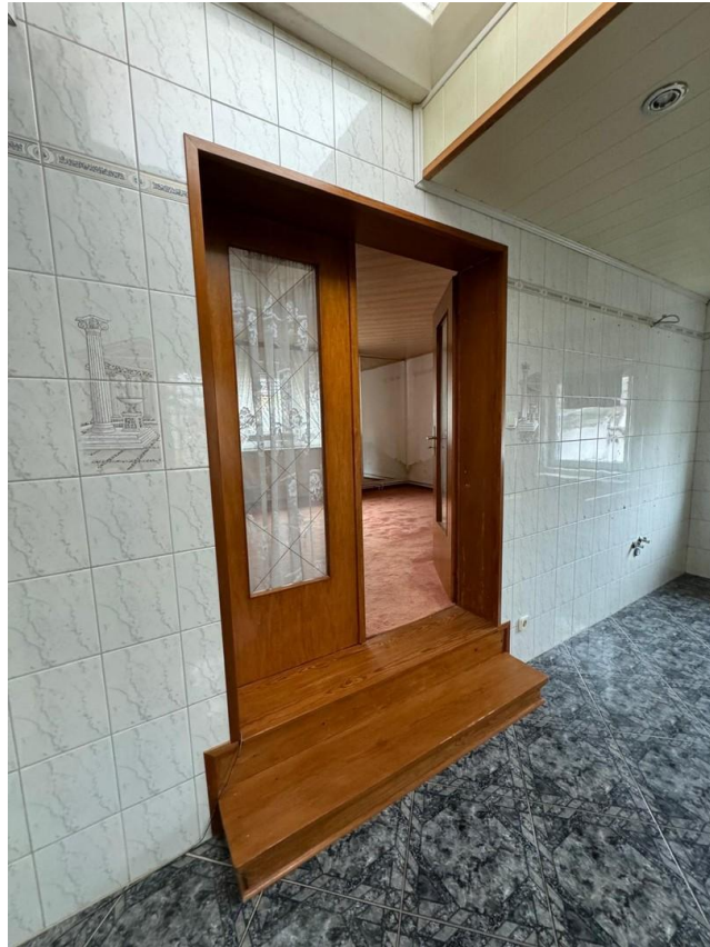
Schlafzimmer 1. OG