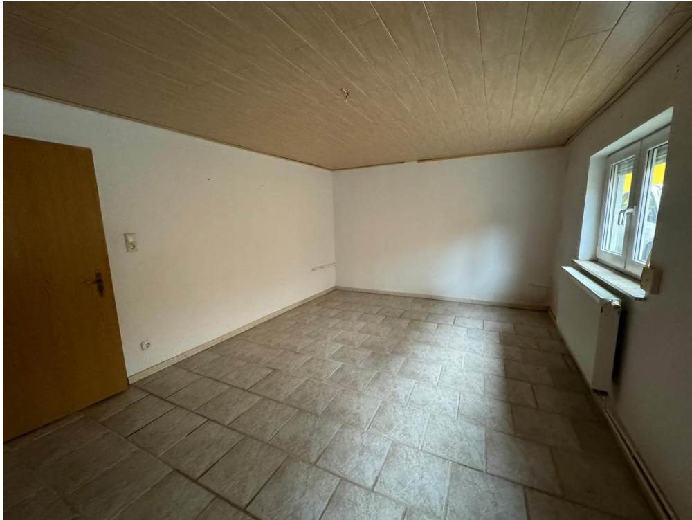
1. Schlafzimmer EG