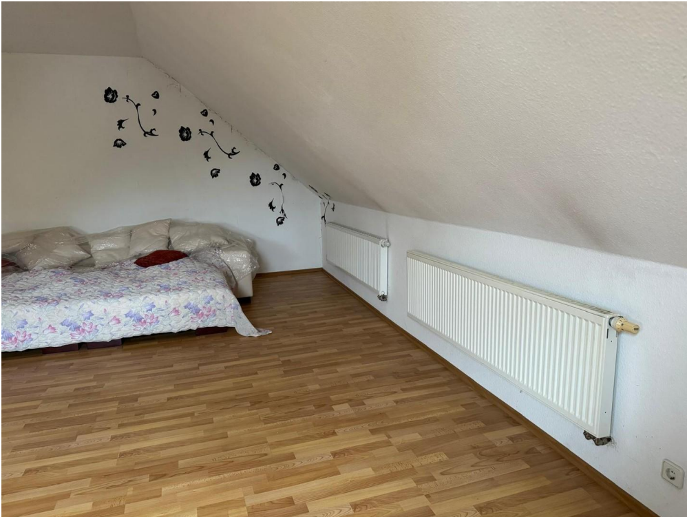
Schlafzimmer 2. OG