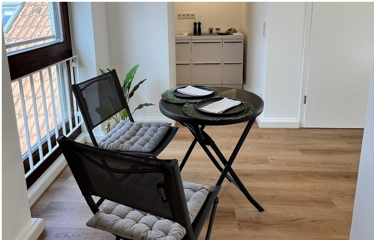
Blick zur Küche