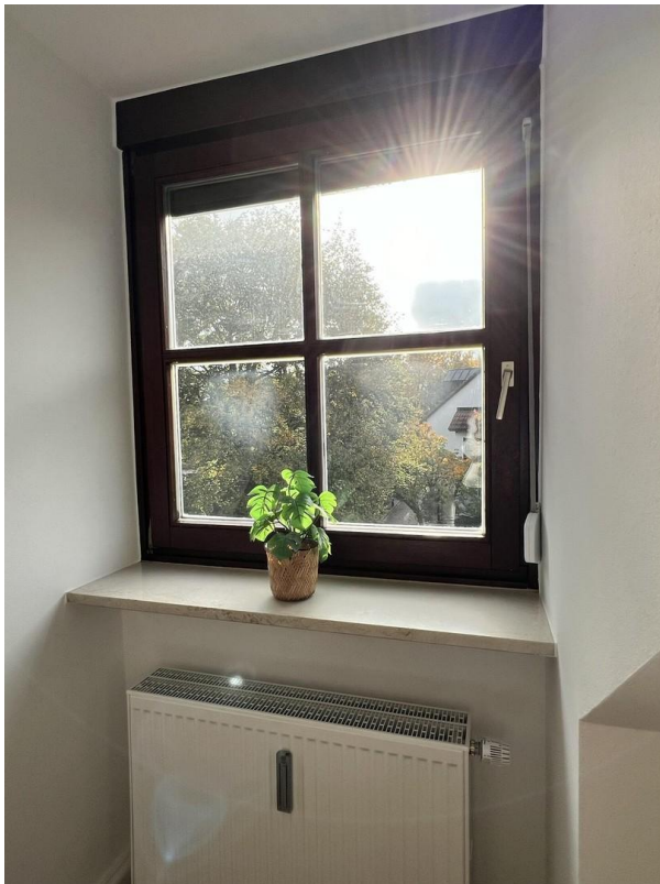
Hell und grün