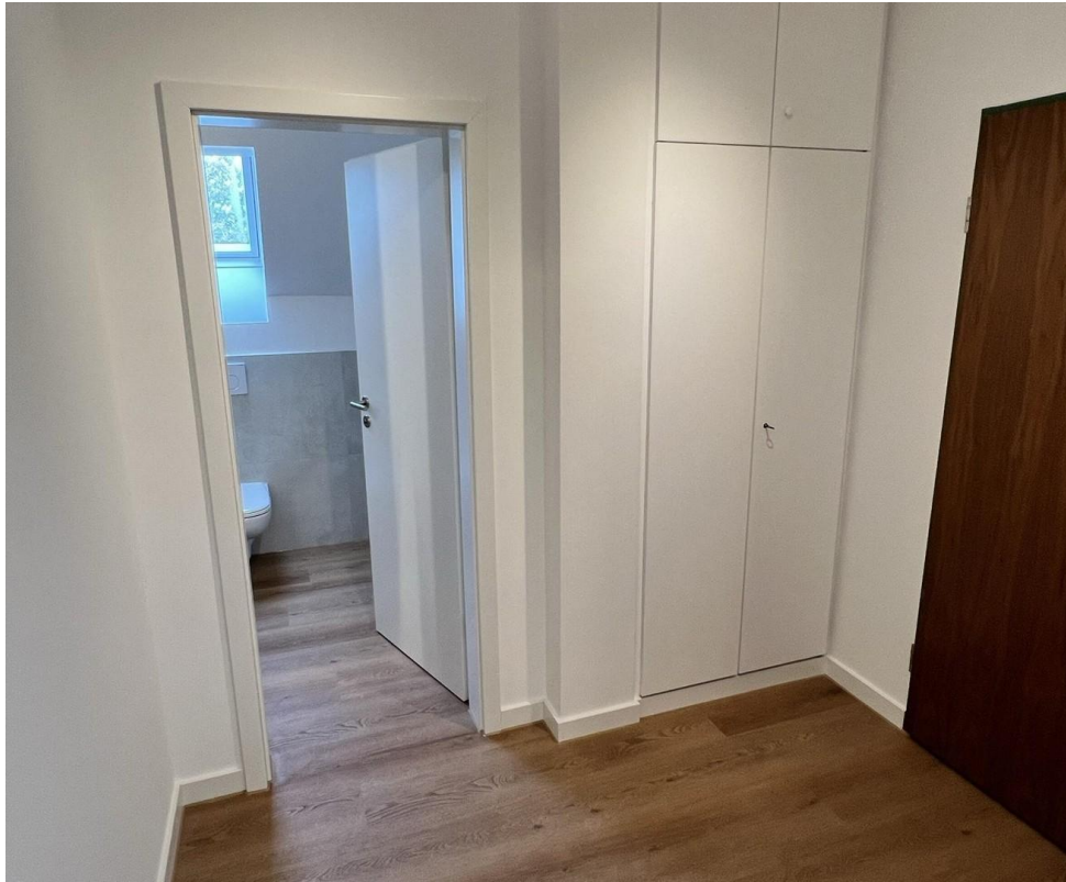
Flur mit Garderobenschrank