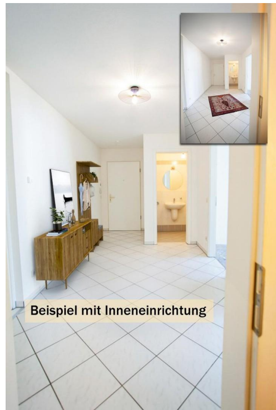
Beispiel mit Inneneinrichtung