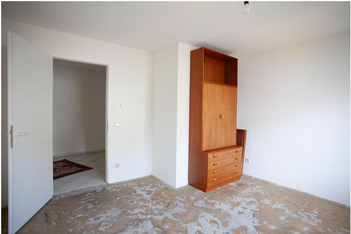
Schlafzimmer 2, Estrichboden