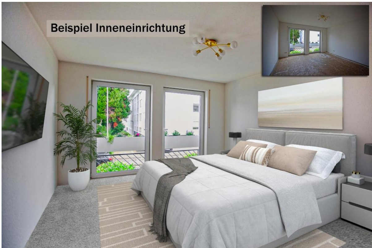
Schlafzimmer 1 / Design-Idee