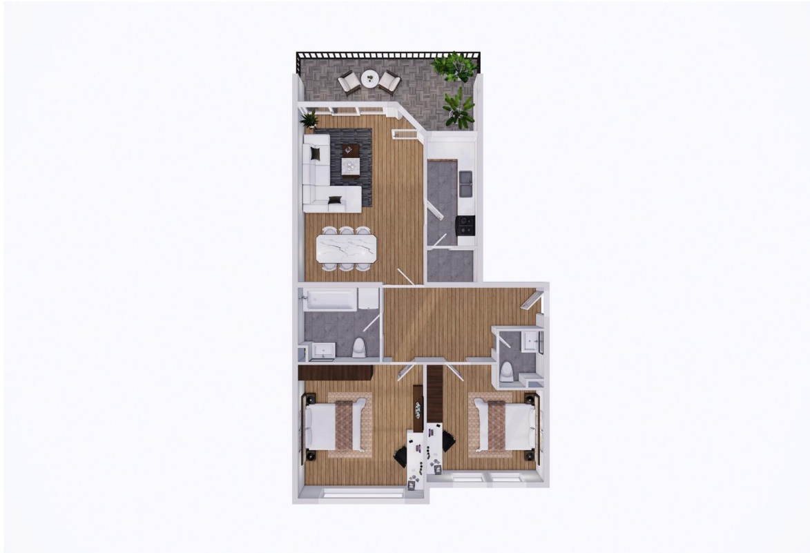
3D Grundriss top