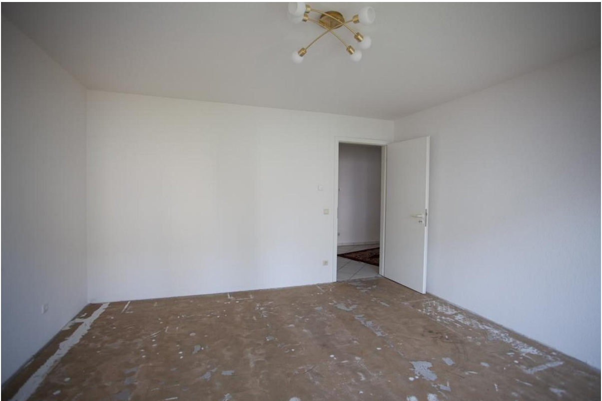
Schlafzimmer 1, Estrichboden