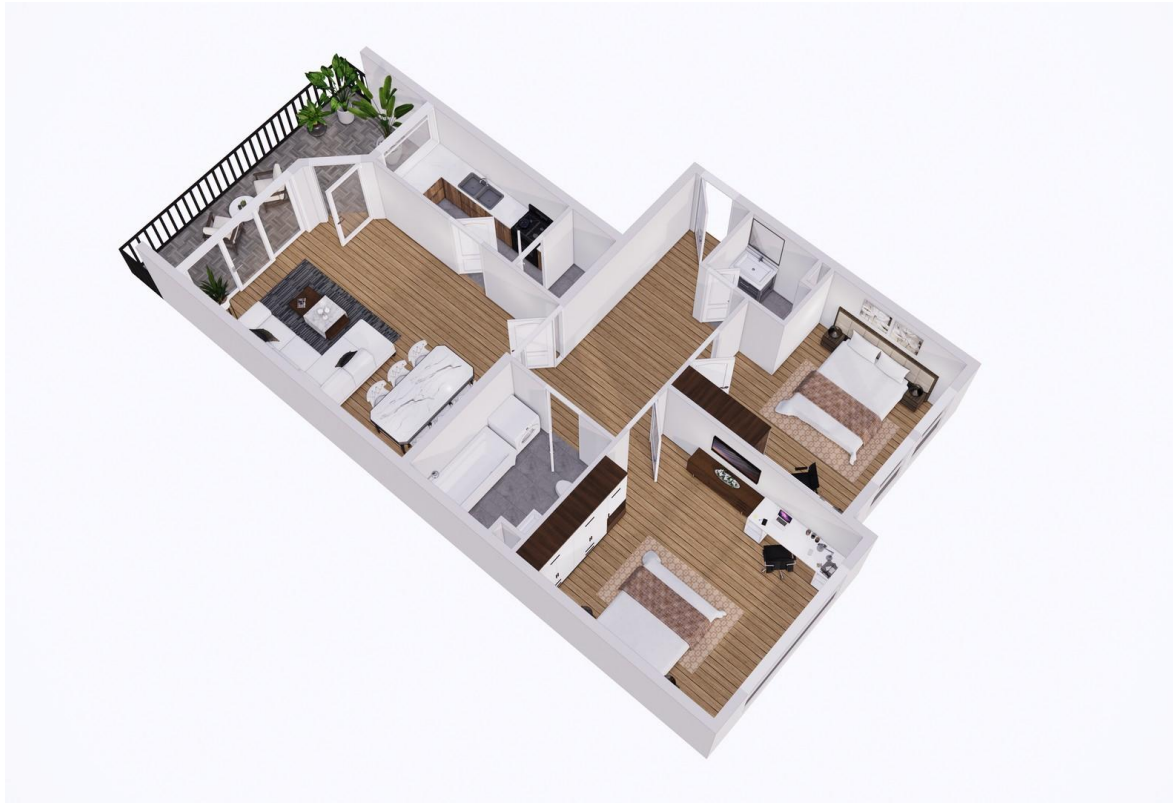
3D Grundriss links