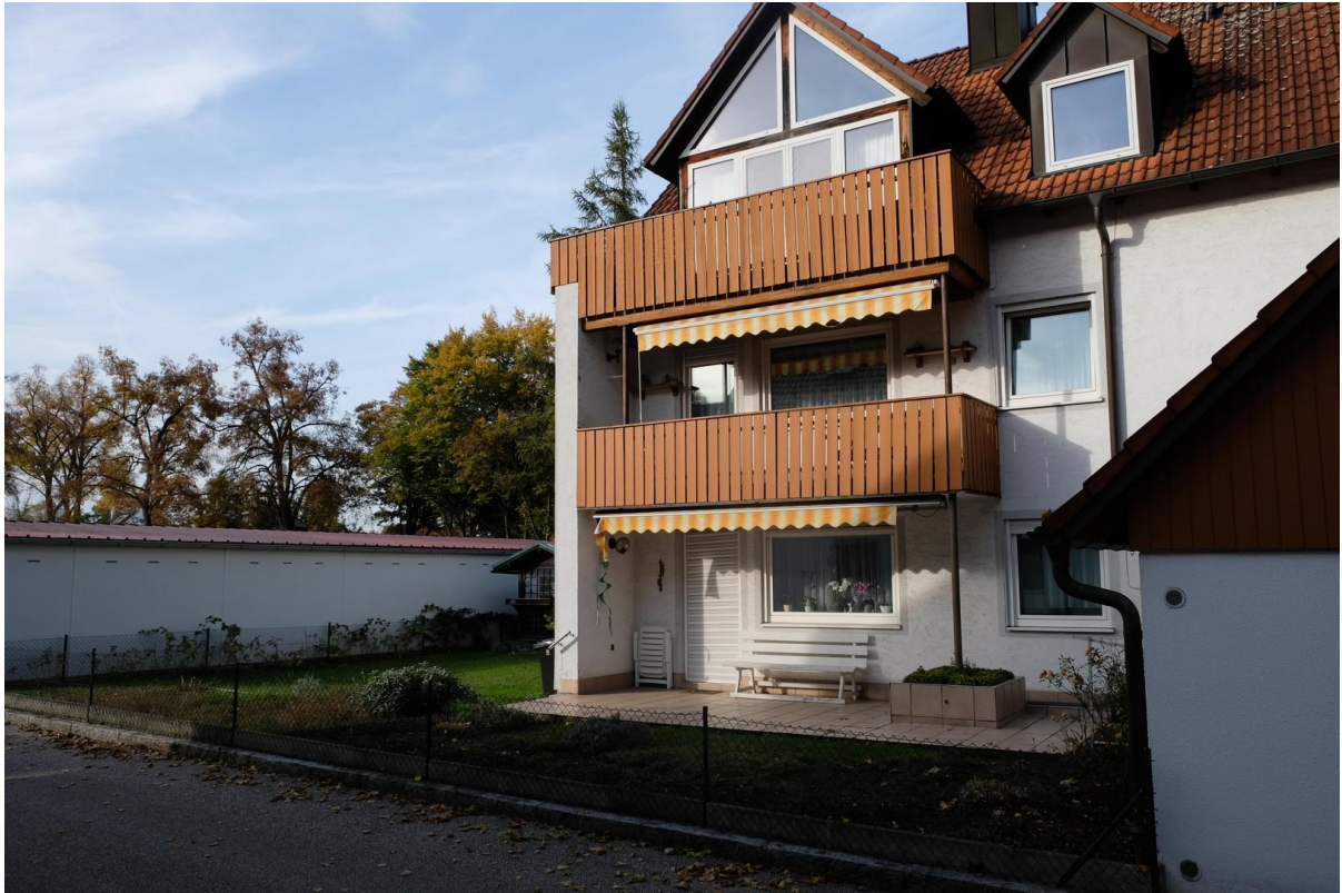
Balkone und Terrasse