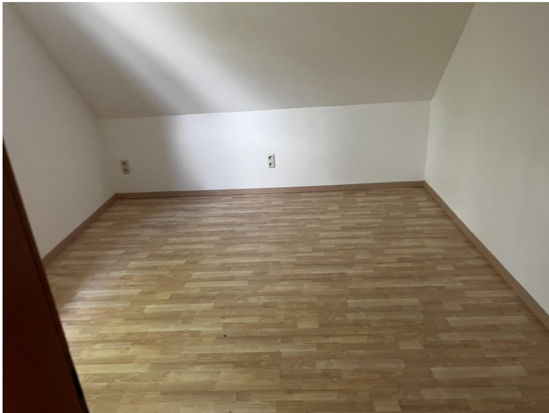
Schlafzimmer im DG