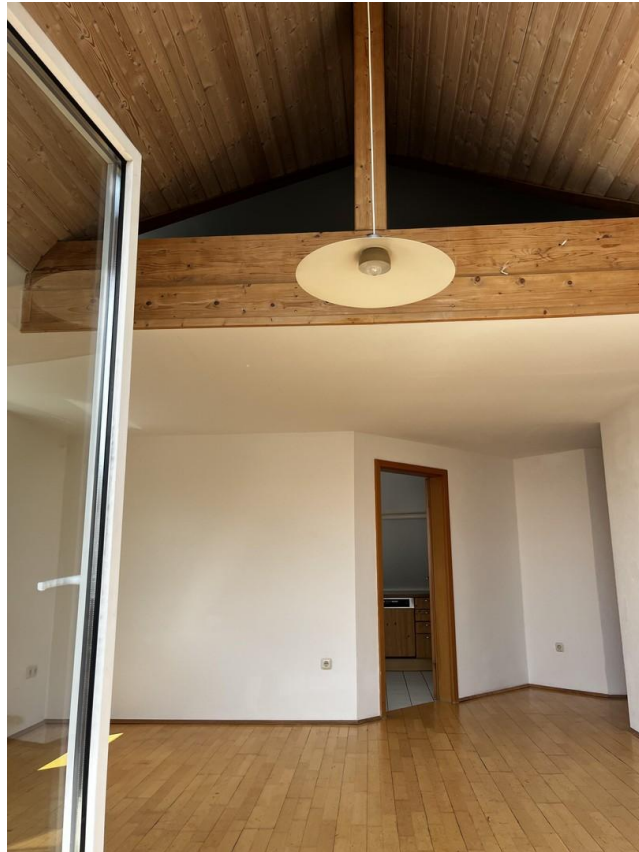
Einladendes Wohnzimmer im DG