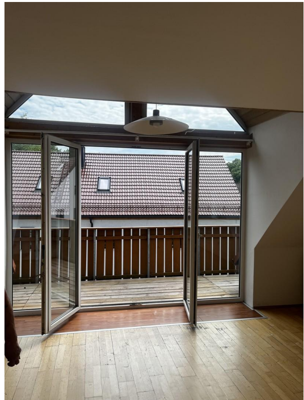
Blick auf Balkon DG