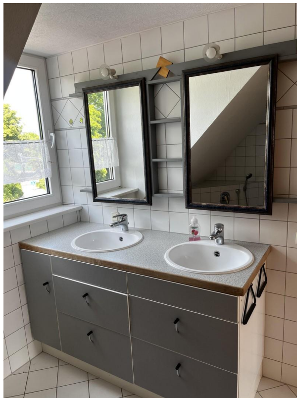
Bad im DG