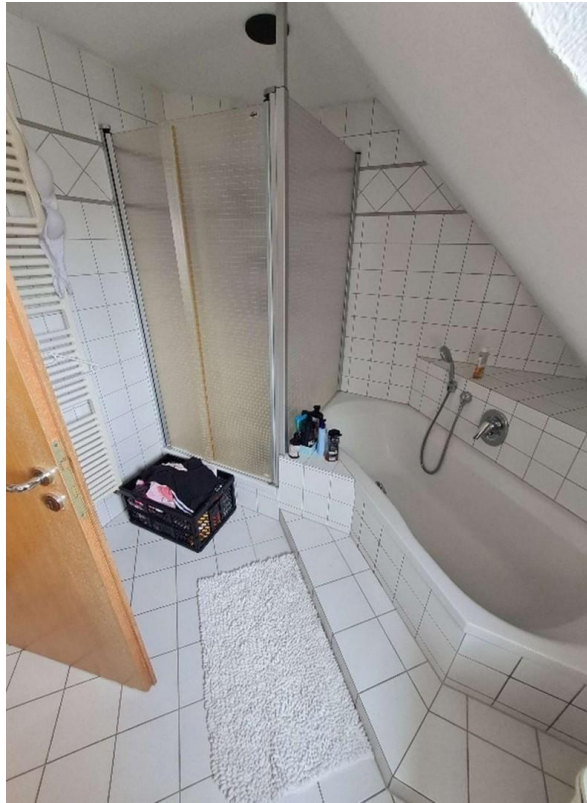
Bad im DG