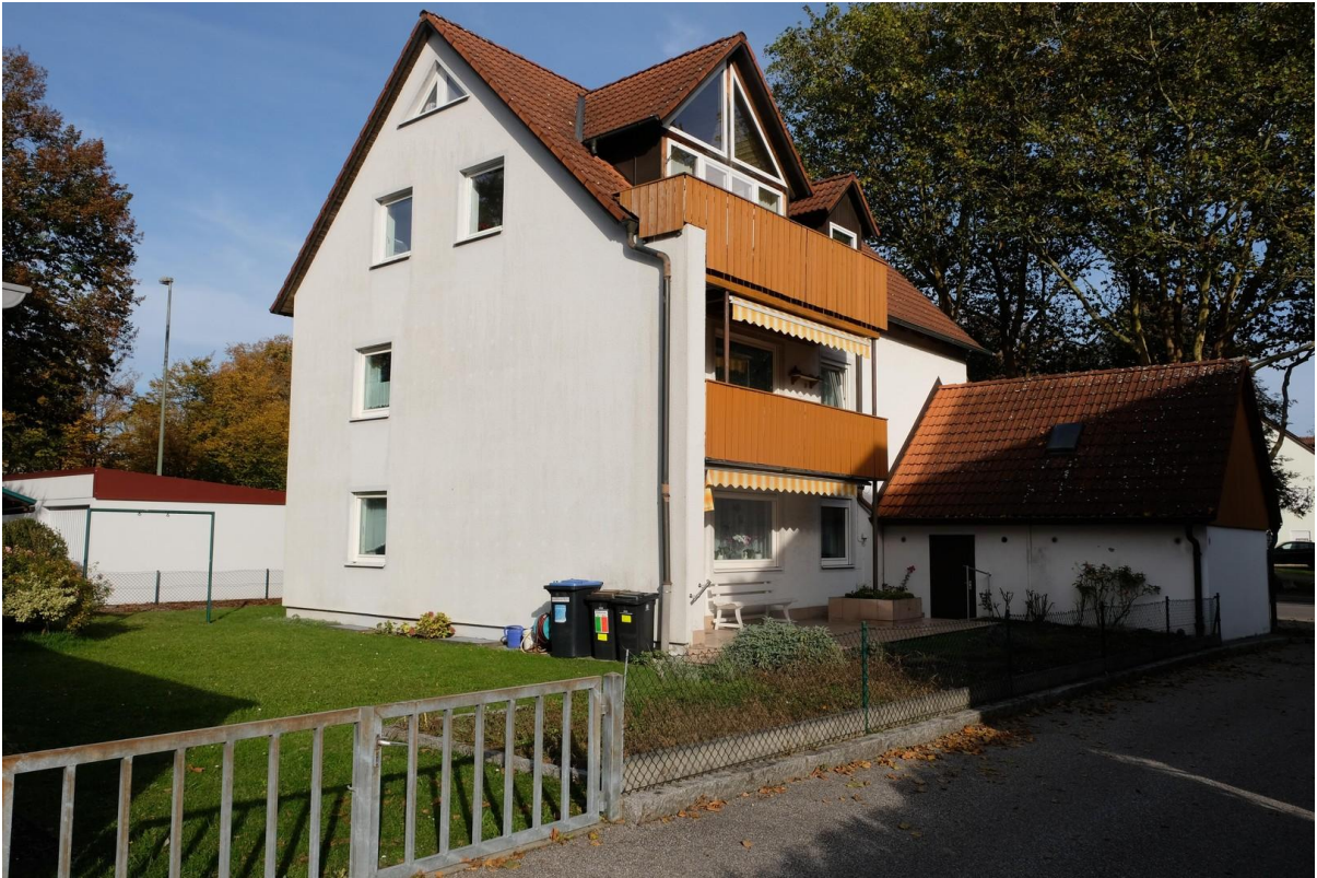
Blick von Nordwest