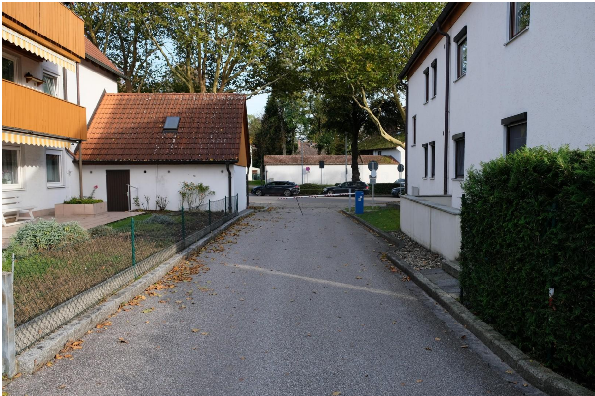
Straße hinter dem Haus (Süd)