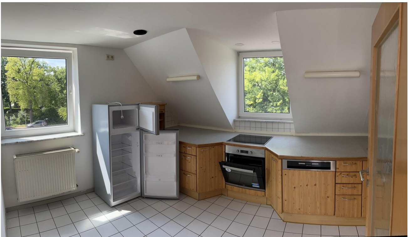
Küche im DG