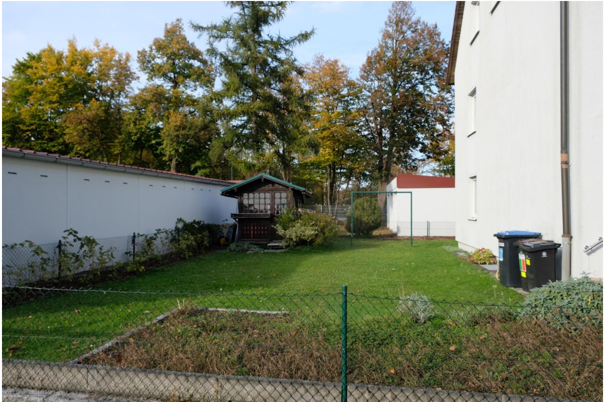
Blick in den Garten 2