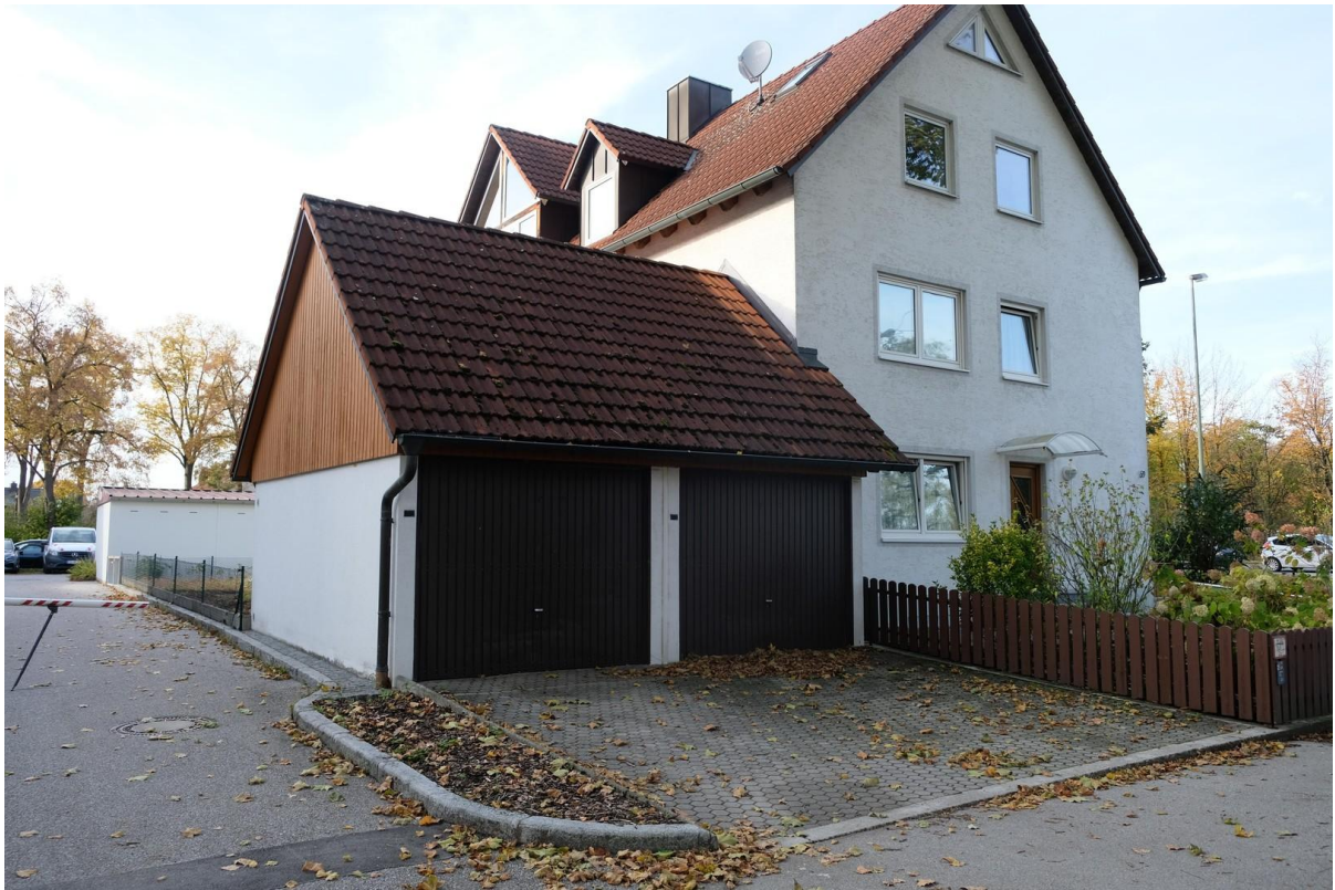
Doppelgarage neben Hauseingang