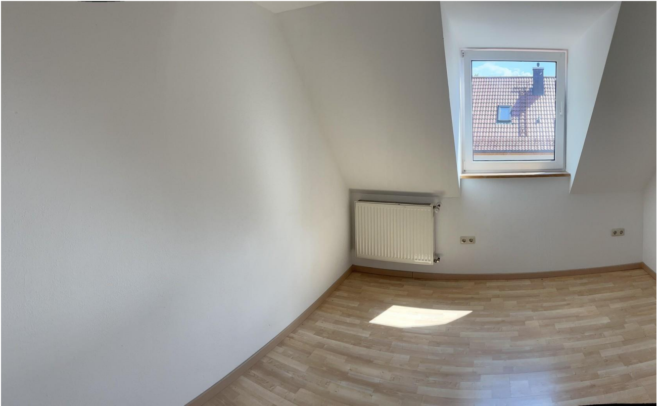
Schlafzimmer 2 DG