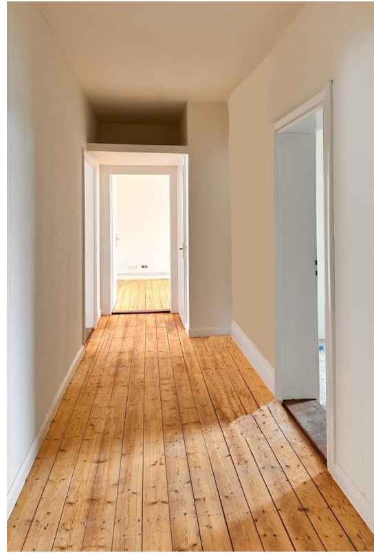
Eingangsflur mit Abstellfläche