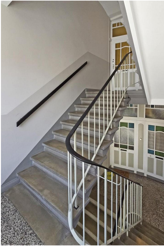
Sehr gepflegtes Treppenhaus