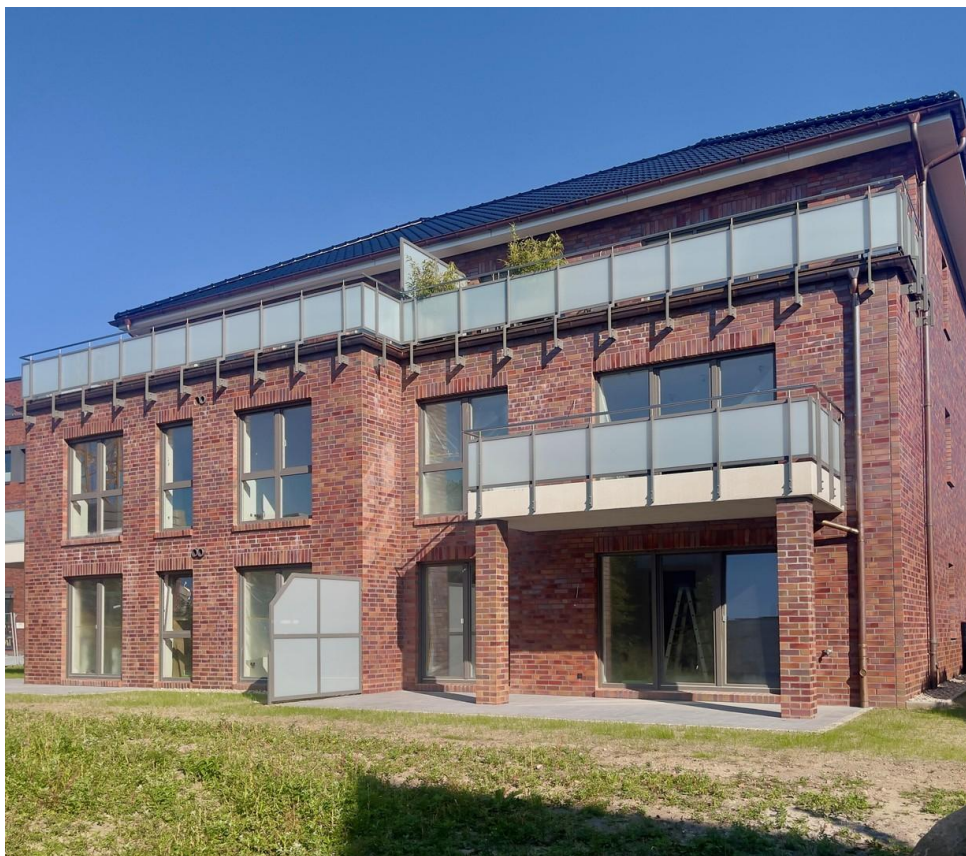
Sonniger Balkon in S/W