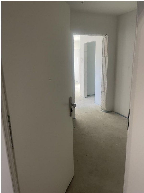
Eingang & Empfang