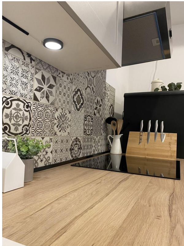
Küche mit Herd und Backofen