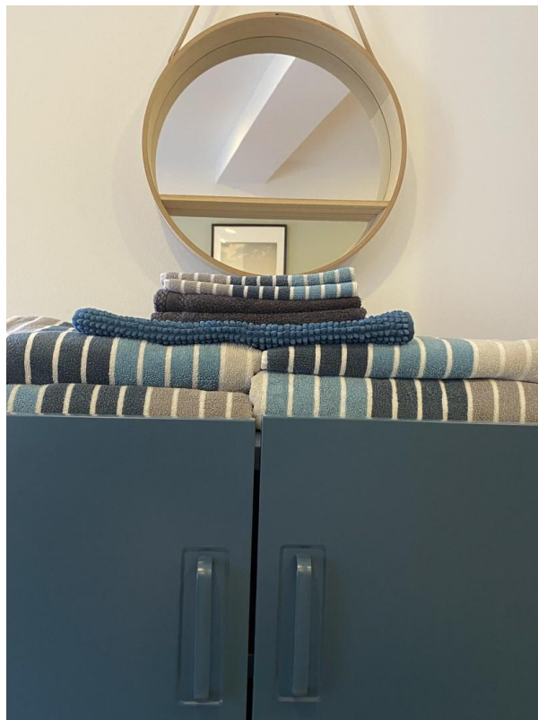
Kleiderschrank und Handtücher