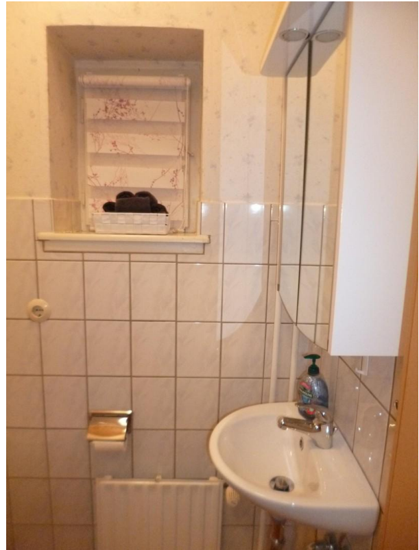
Gäste-WC im EG