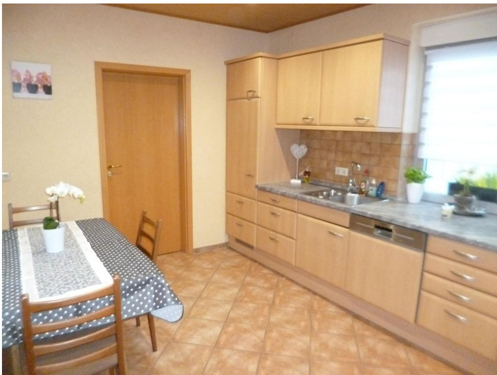
Küche mit Essplatz