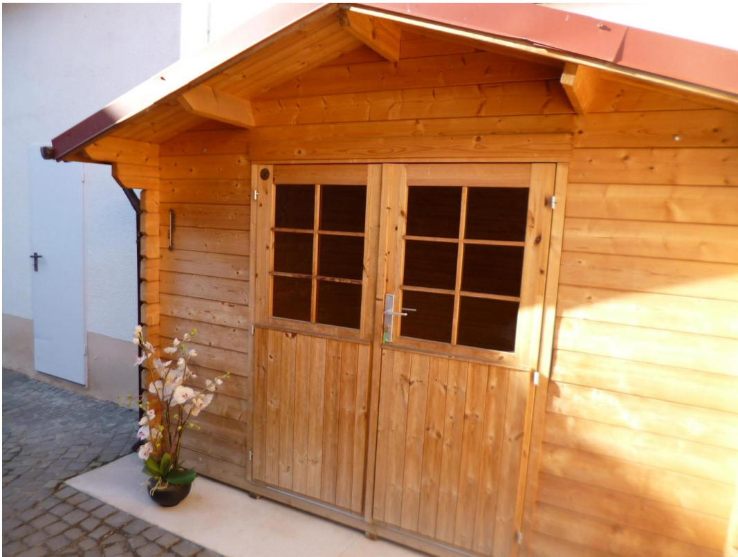
Platz für eine Outdoor-Sauna