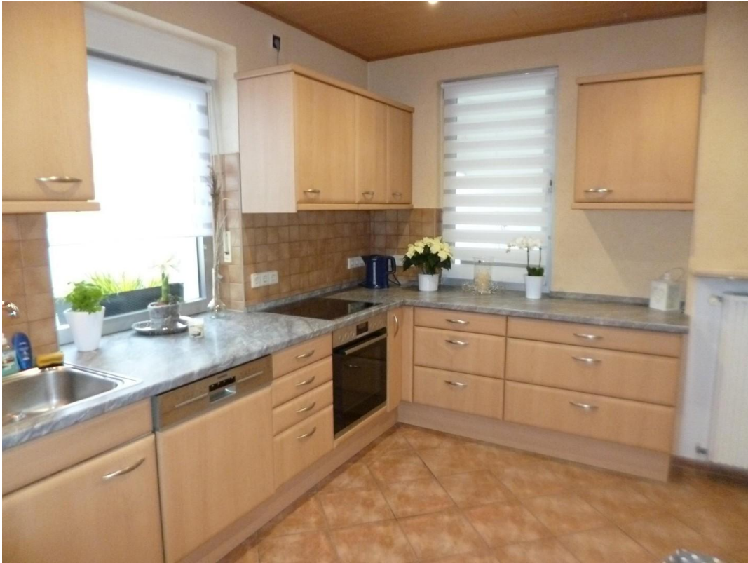
Küche mit 2 Fenstern