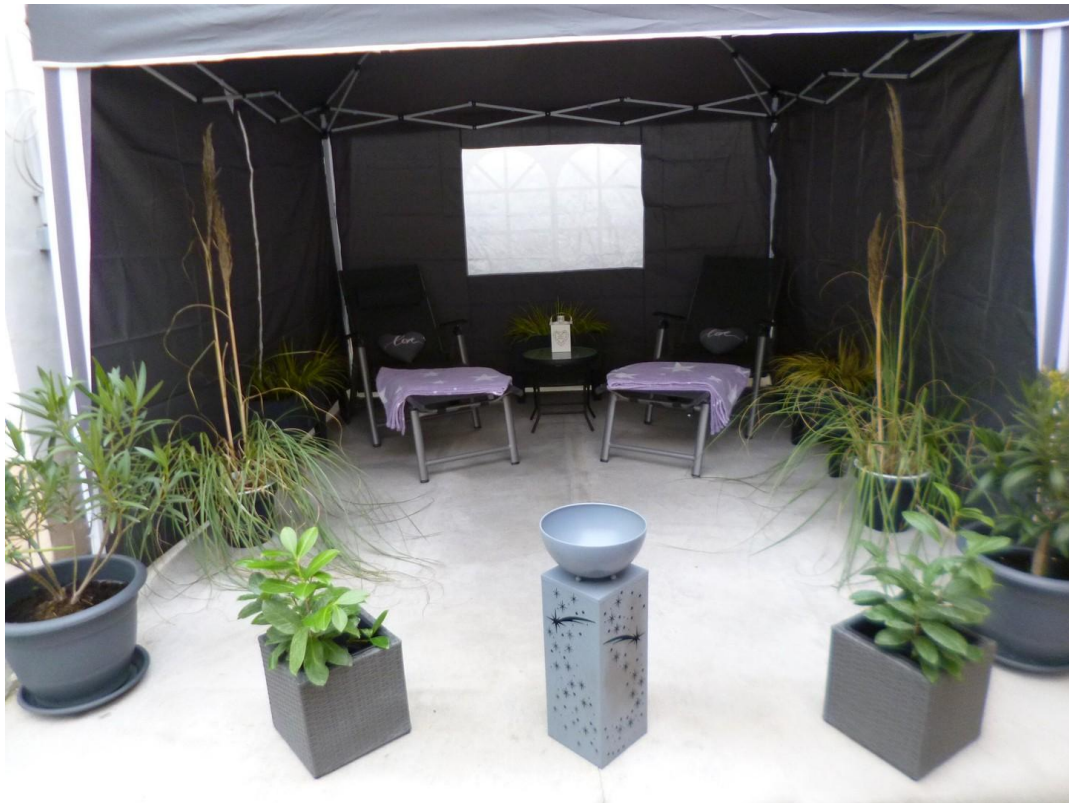
Platz für eine Relax-Area