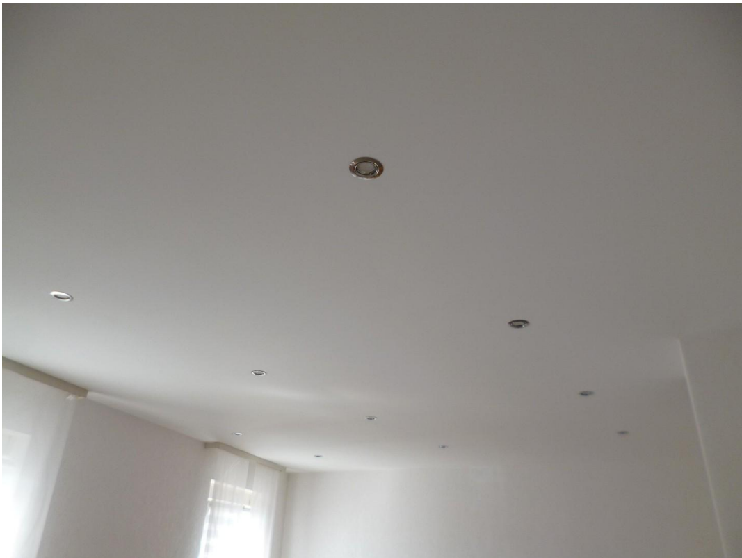
LED-Spots in den Decken OG