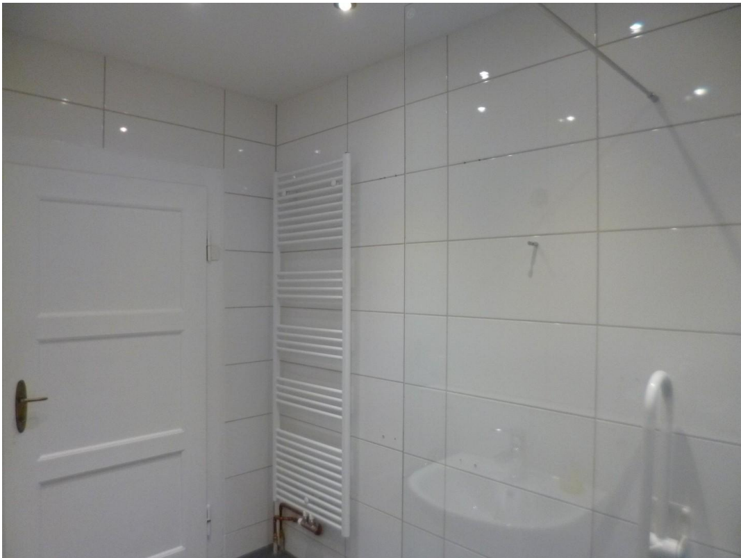
Handtuchheizkörper im Bad