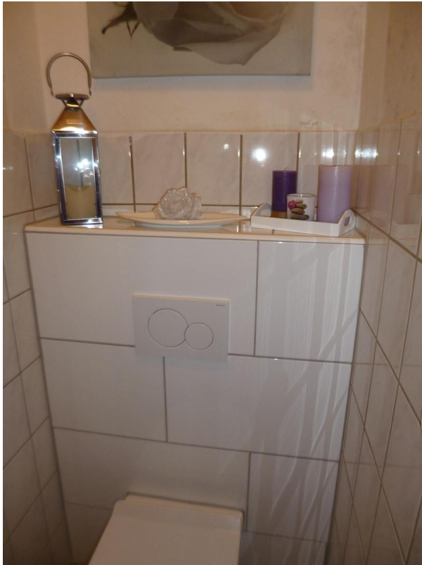
Gäste-WC im EG