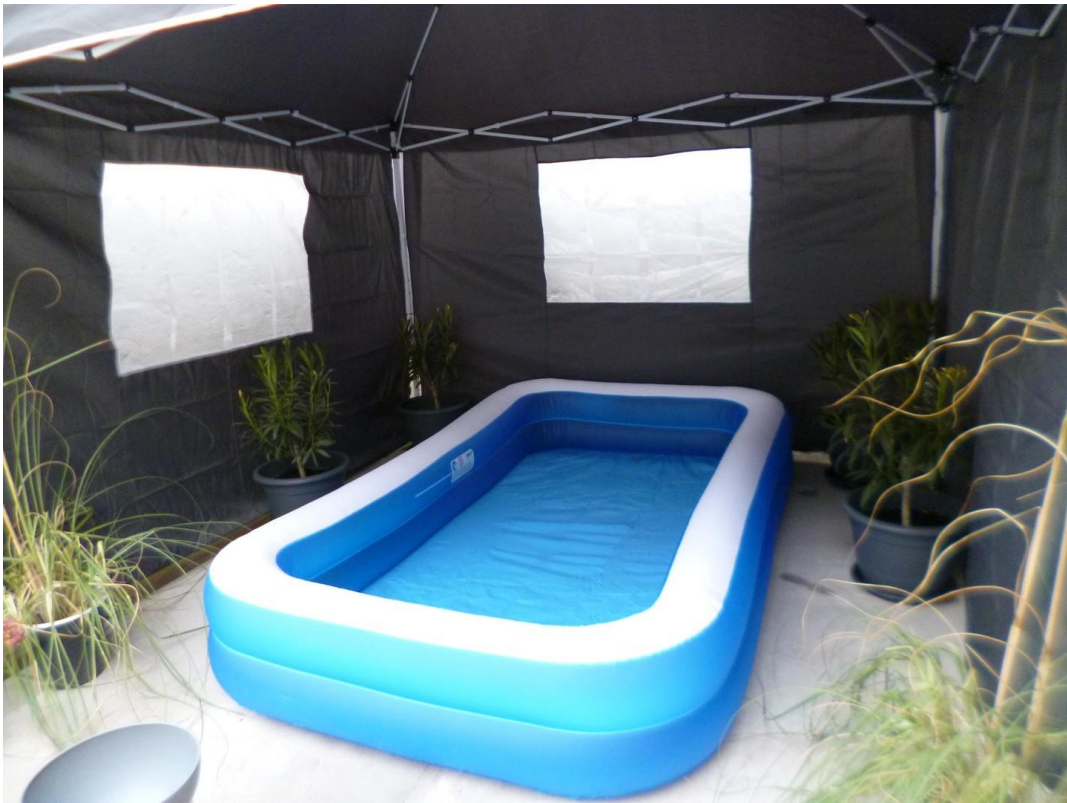
Platz für einen Outdoor-Pool