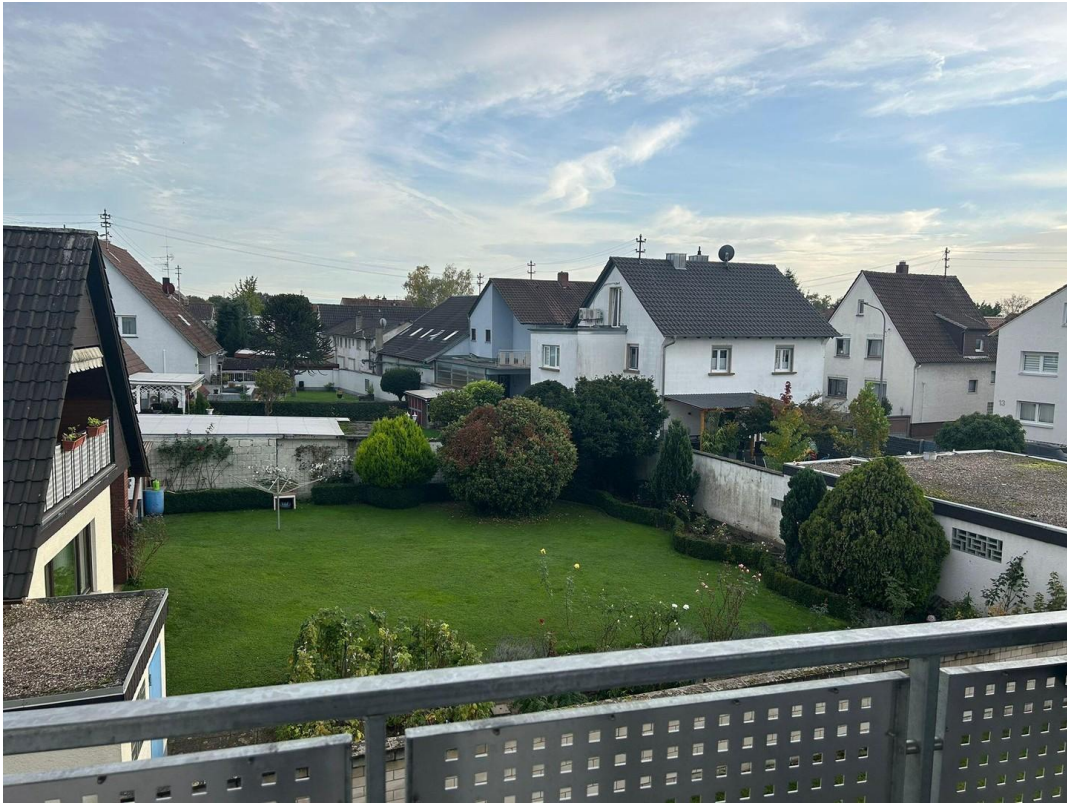
Ausblick Balkon Südseite