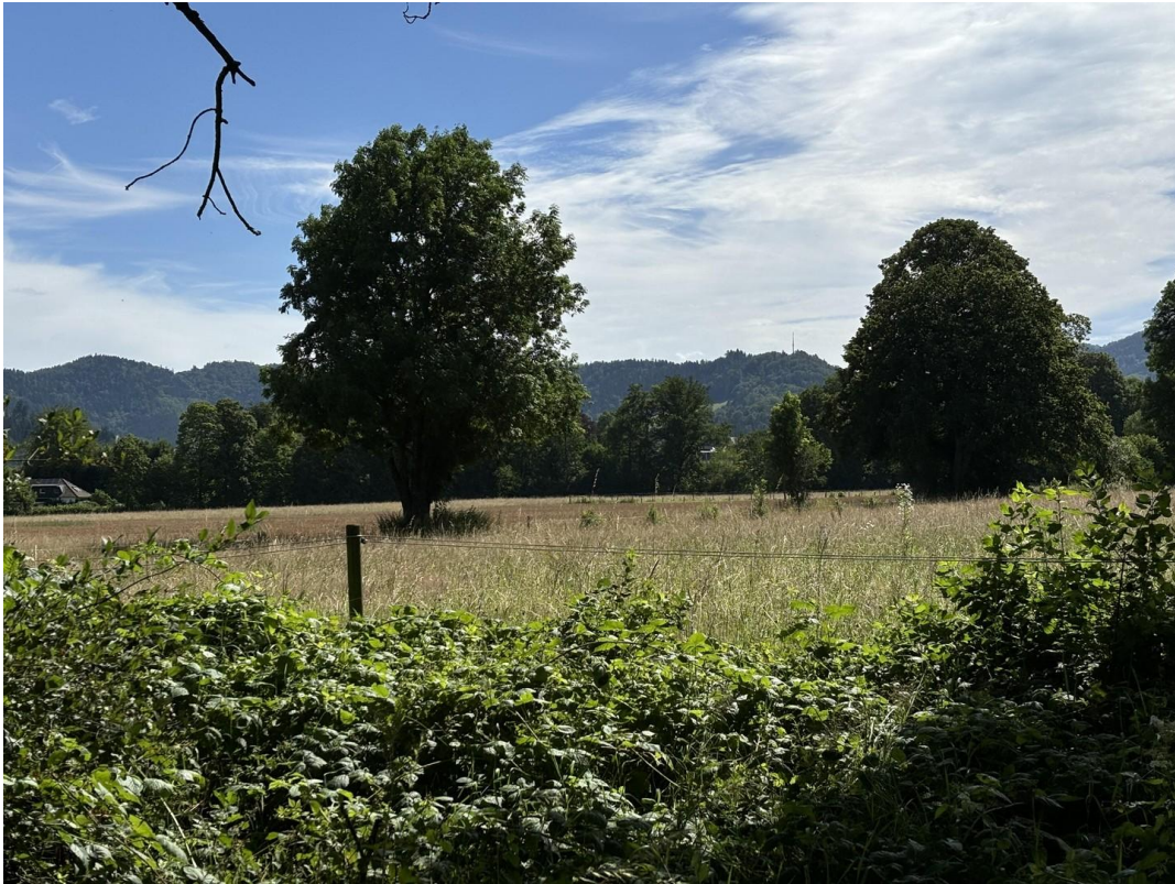
Blick nach Norden