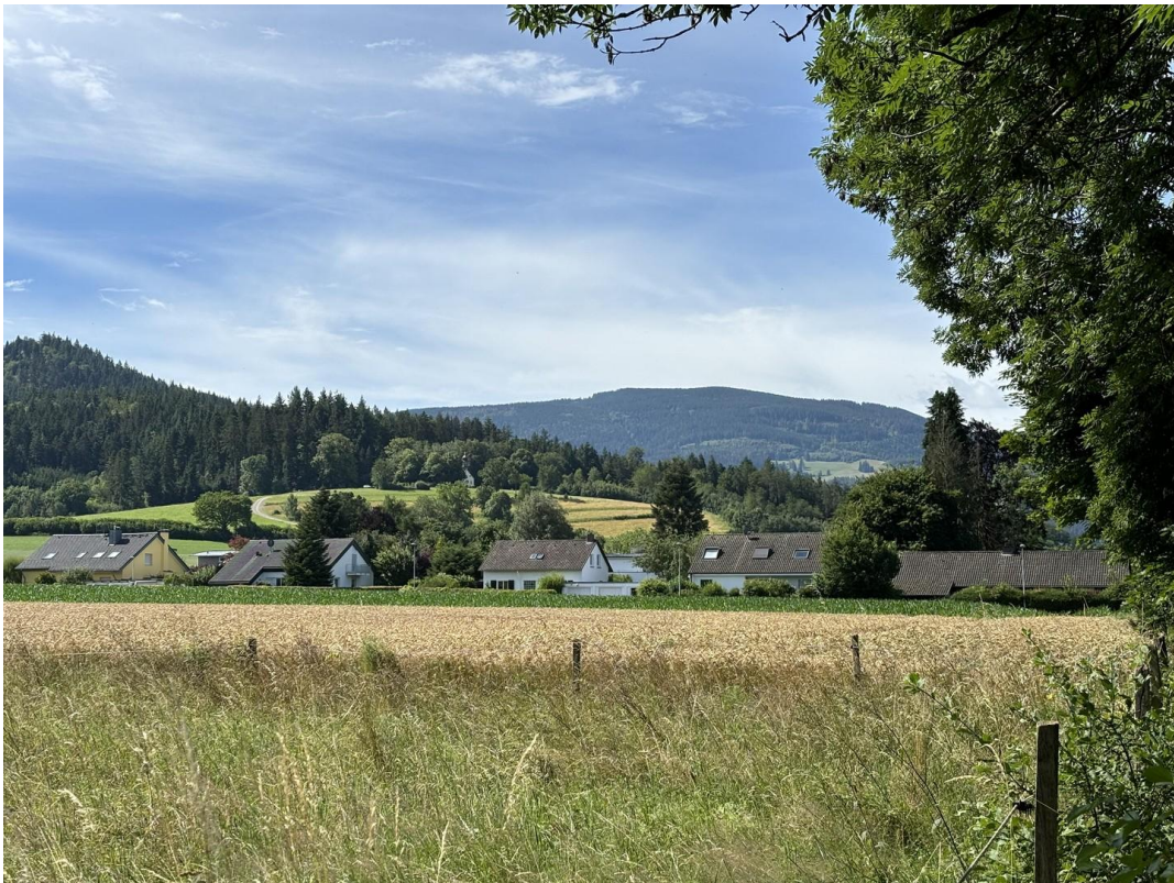
Blick nach Süden