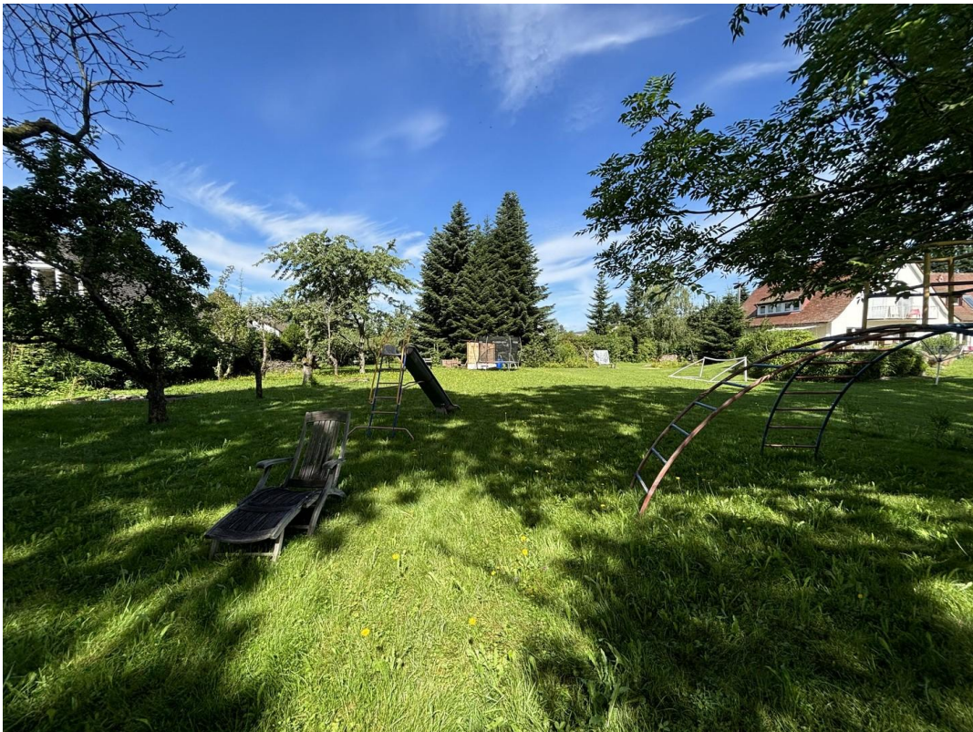
Blick Richtung Westen