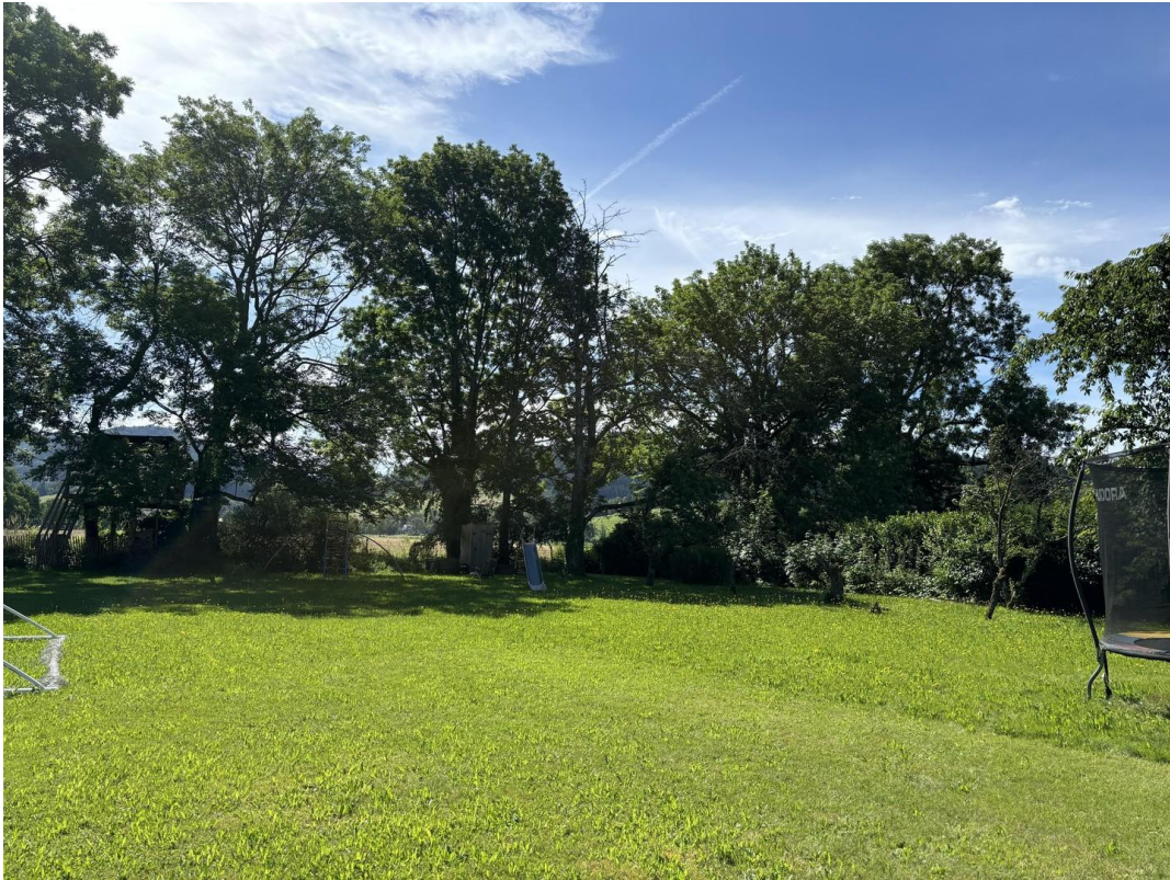
Blick nach Osten auf Felder