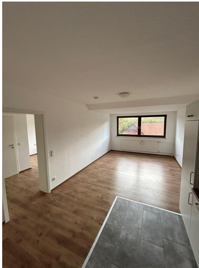
Wohn- und Küchenbereich