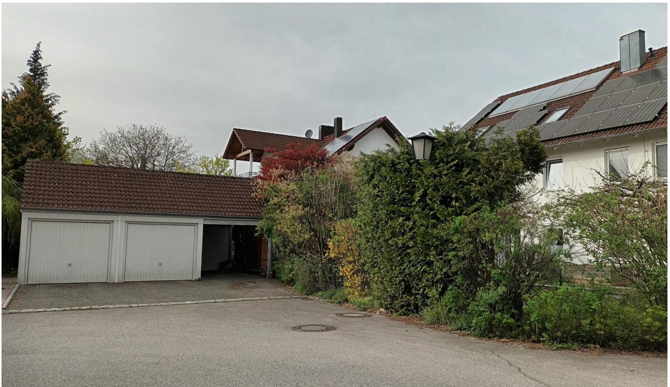
Garagen und Stellplatz