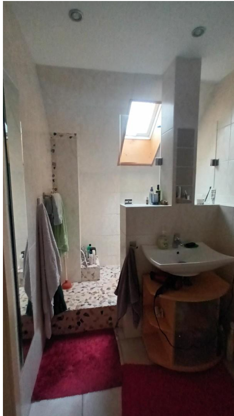
Bad in DG