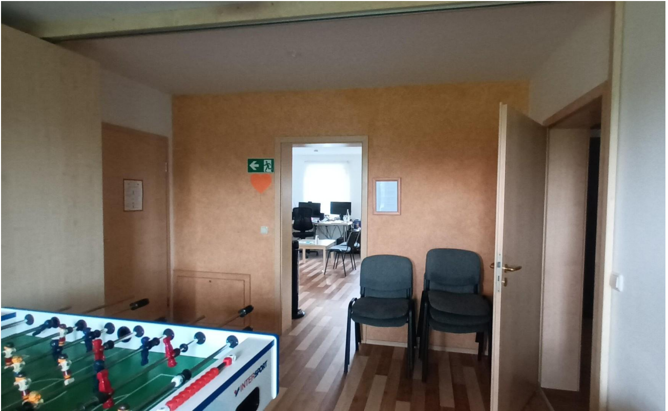
Büros in OG