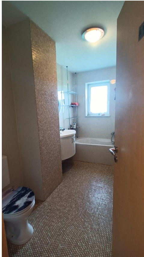
2.Bad in OG