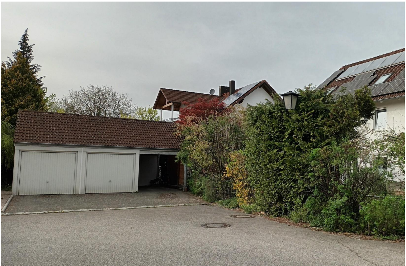
Garagen und Stellplatz