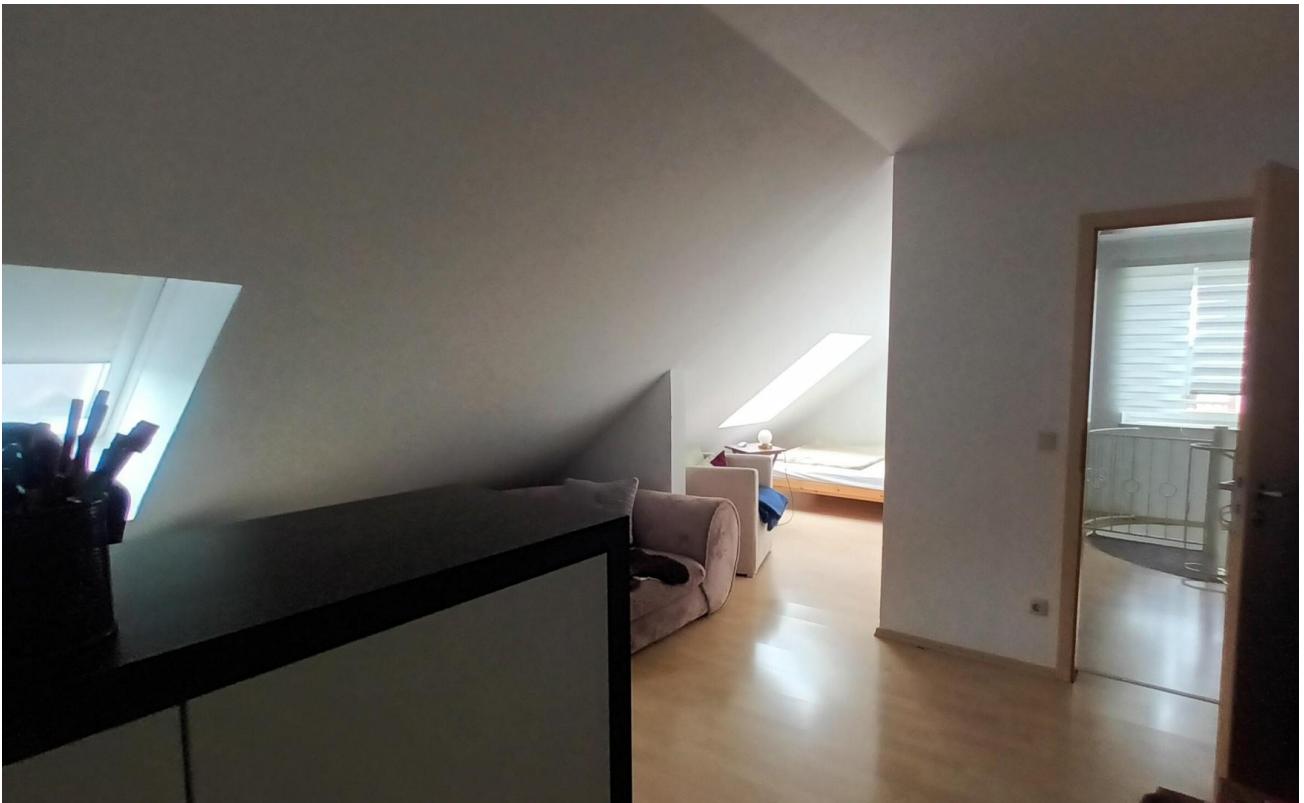
2.Schlafzimmer in DG