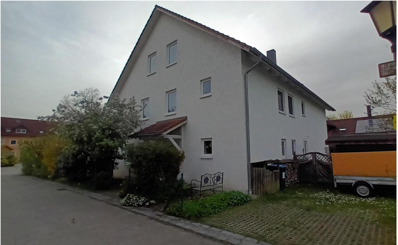
Eingang auf der Ostseite