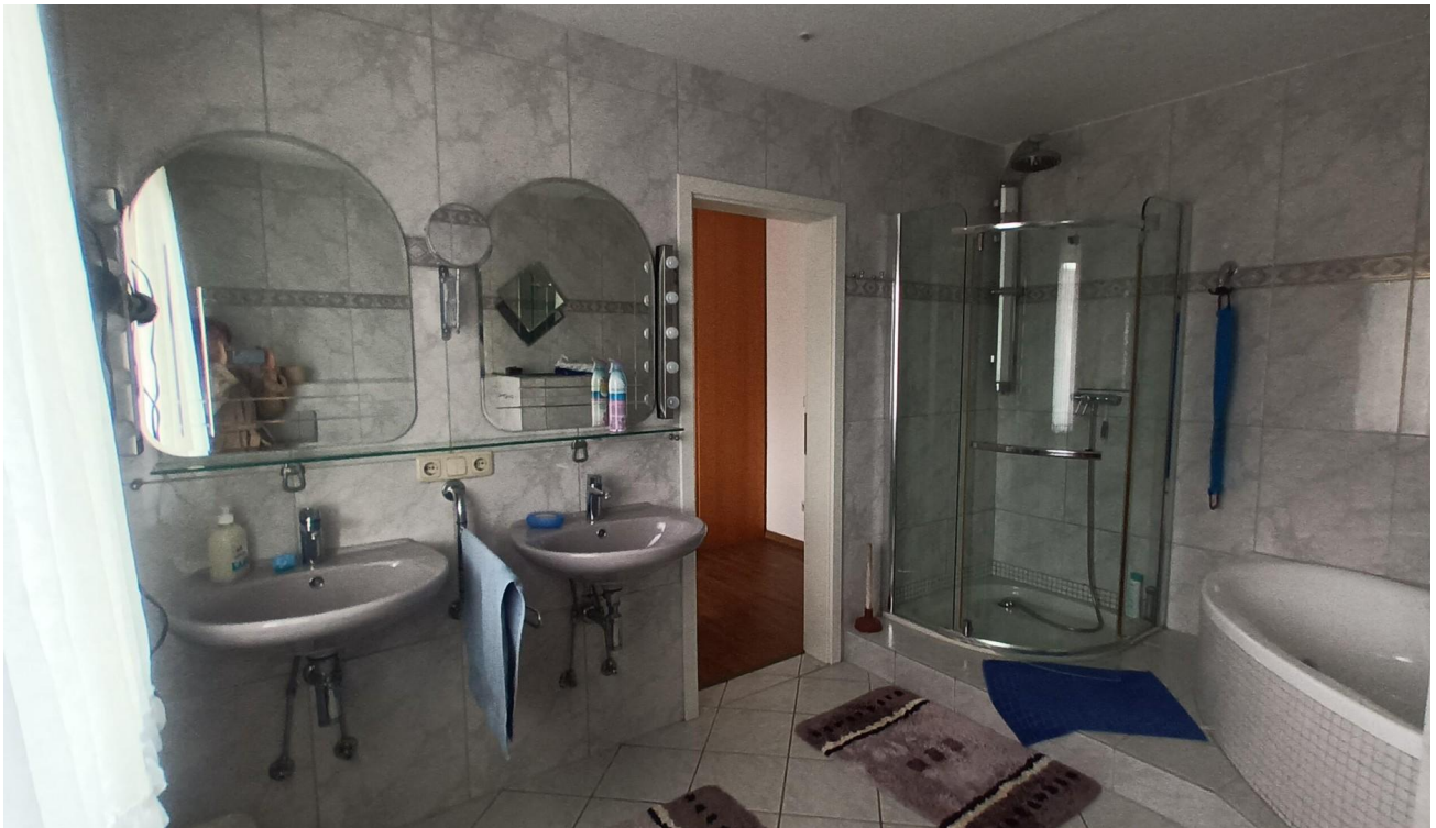
Bad in OG