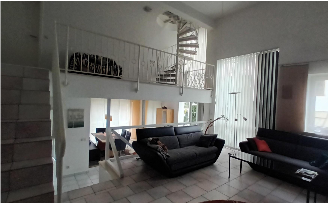
Wohnzimmer mit Galerie