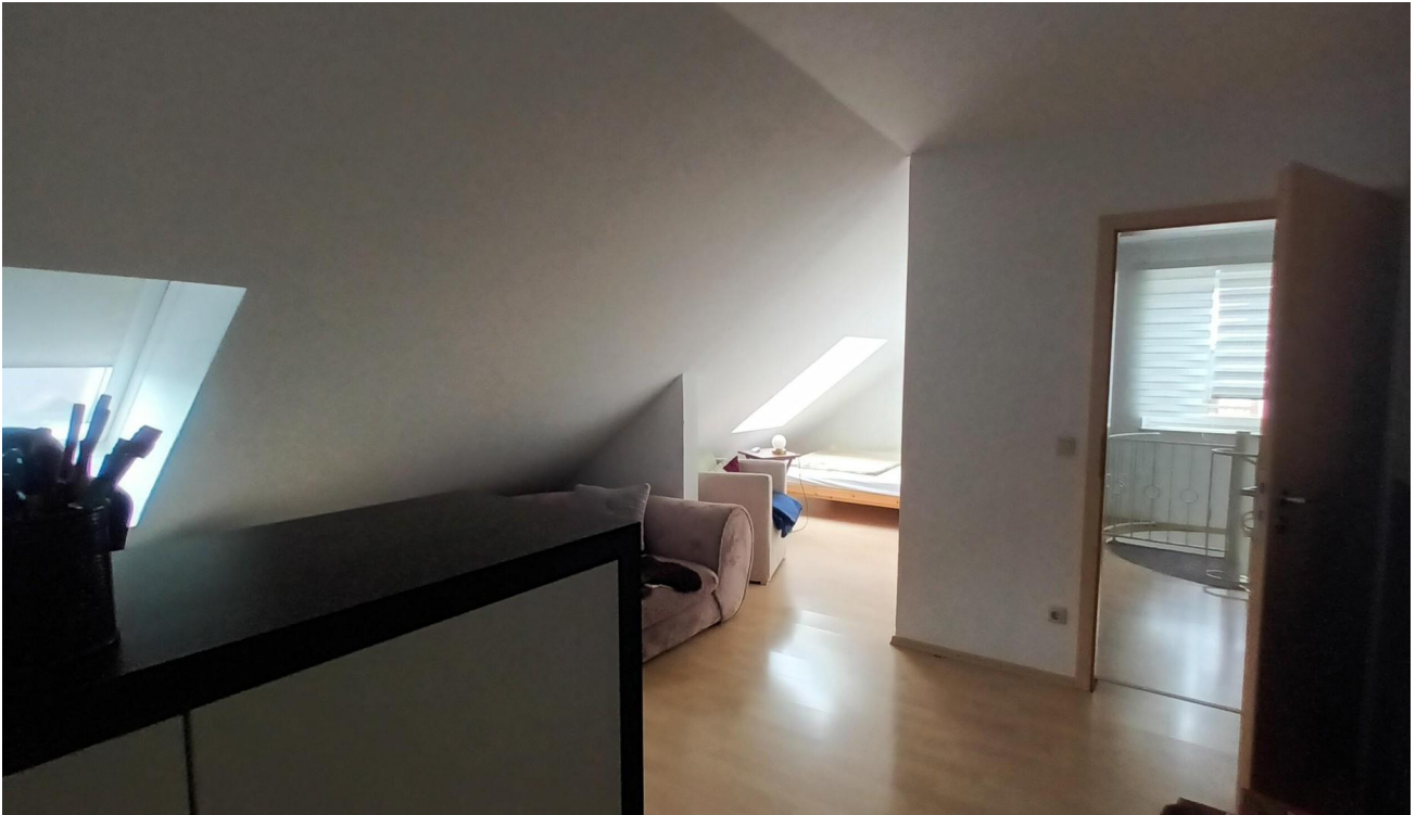
2.Schlafzimmer in DG