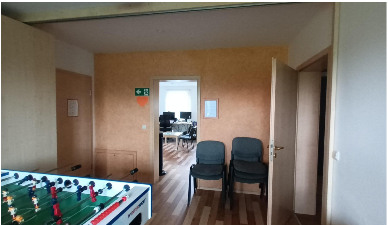
Büros in OG