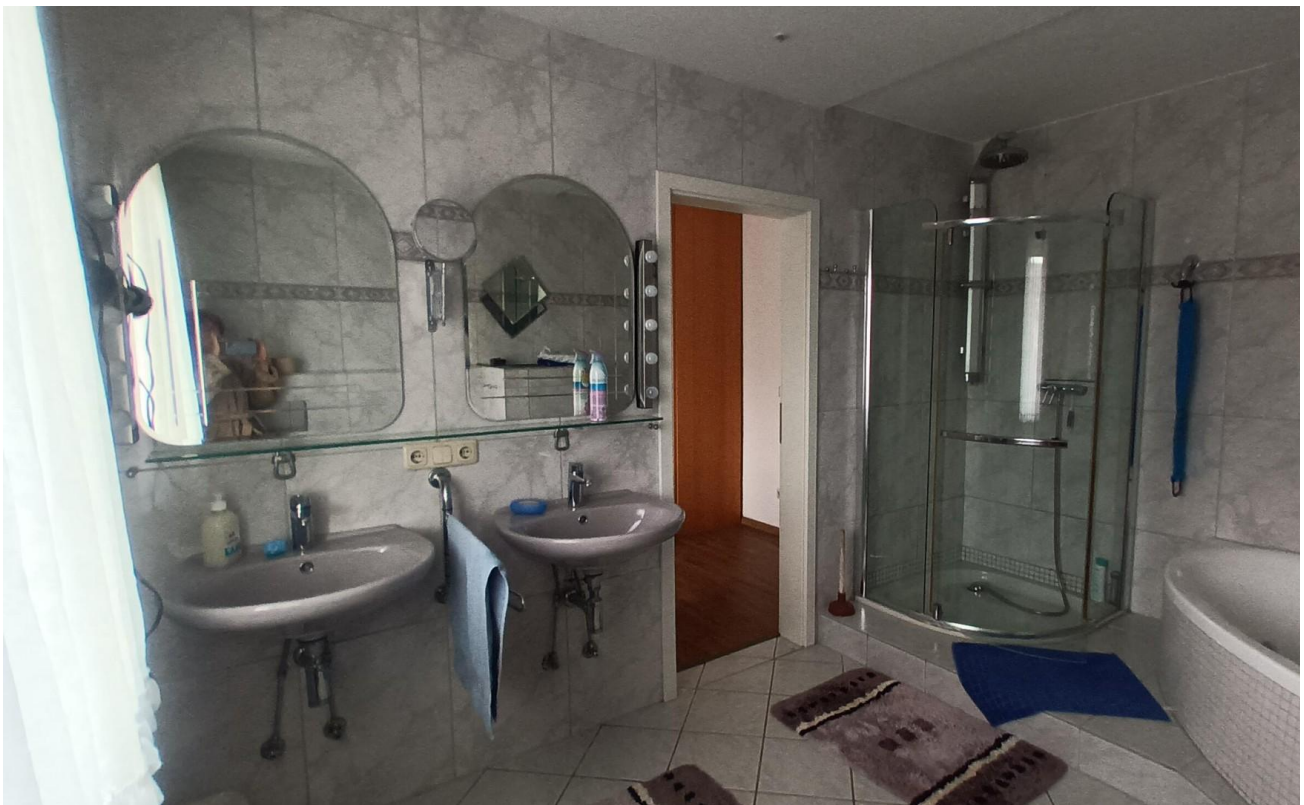
Bad in OG