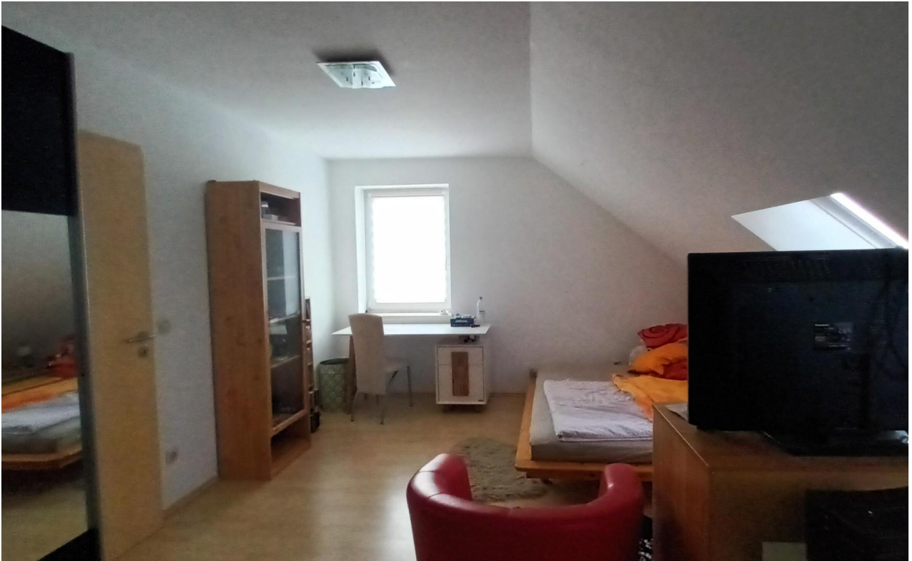
Schlafzimmer in DG