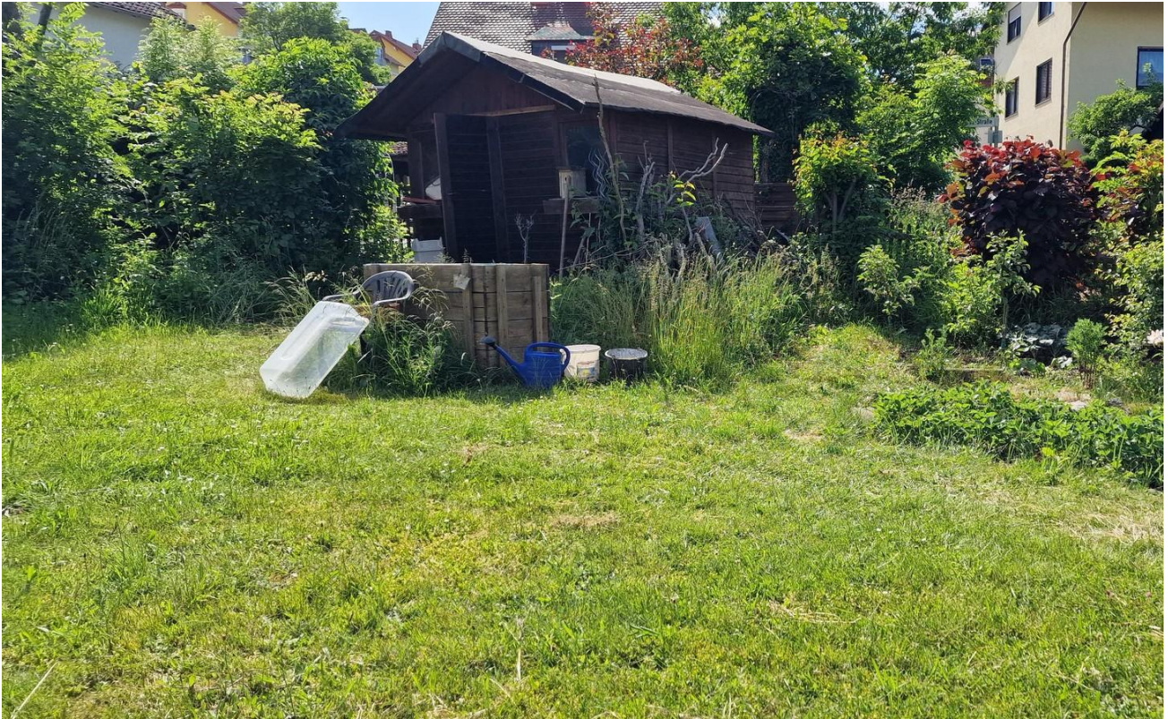
Garten mit Hütte