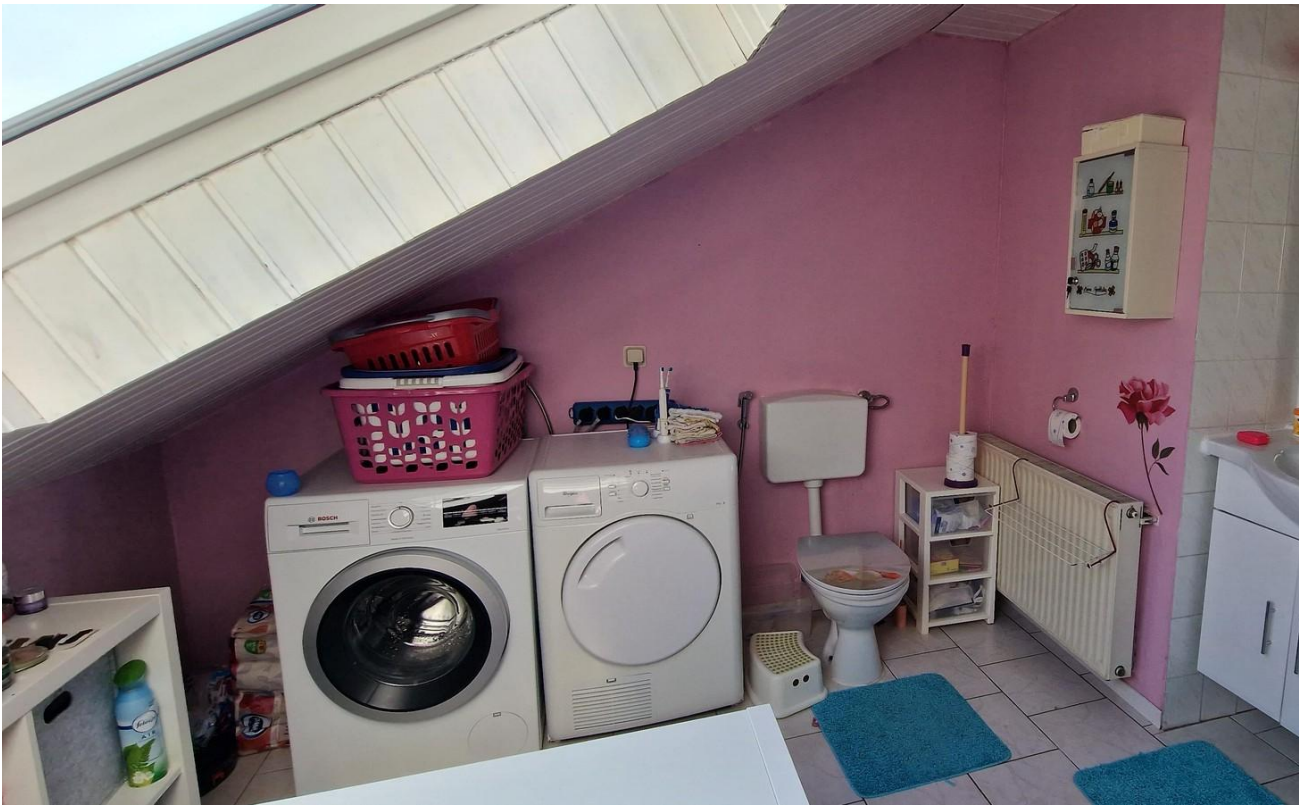
Bad mit Wanne