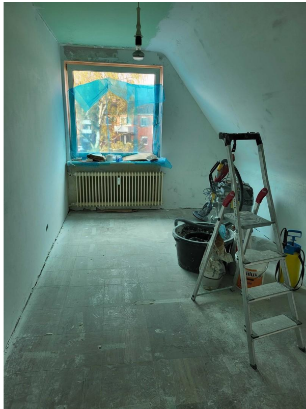
Zimmer 3/ Schlafzimmer