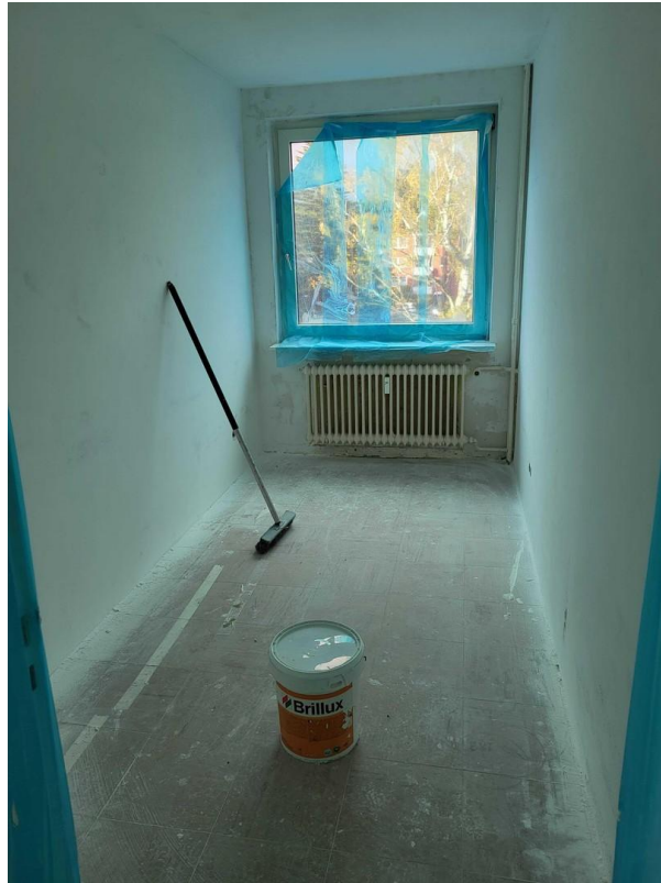
Zimmer 2/ halbes Zimmer