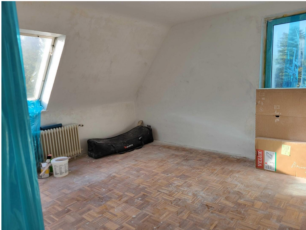
Zimmer 1/ Wohnzimmer