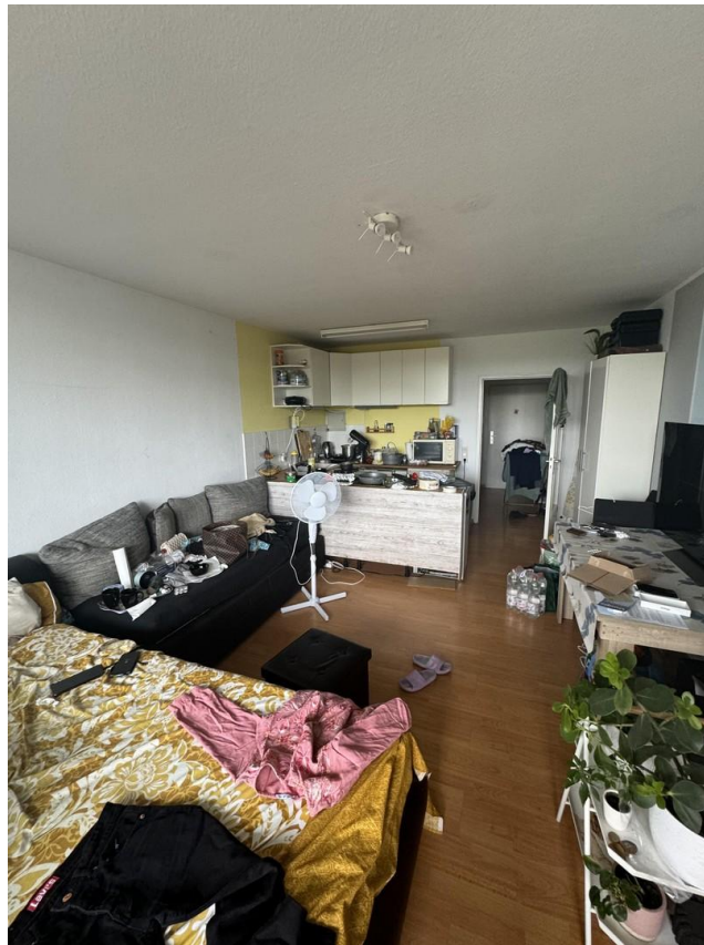
WE mit Balkon