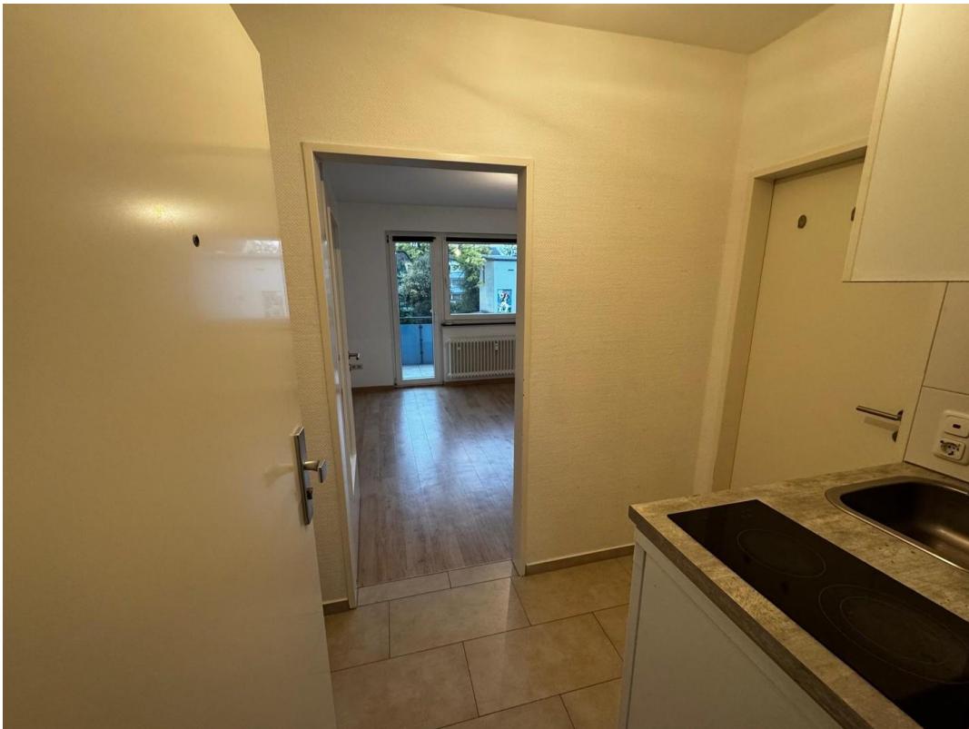
Flur Blick von Treppenhaus