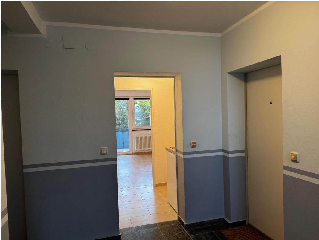
Wohnungstüre von Treppenhaus