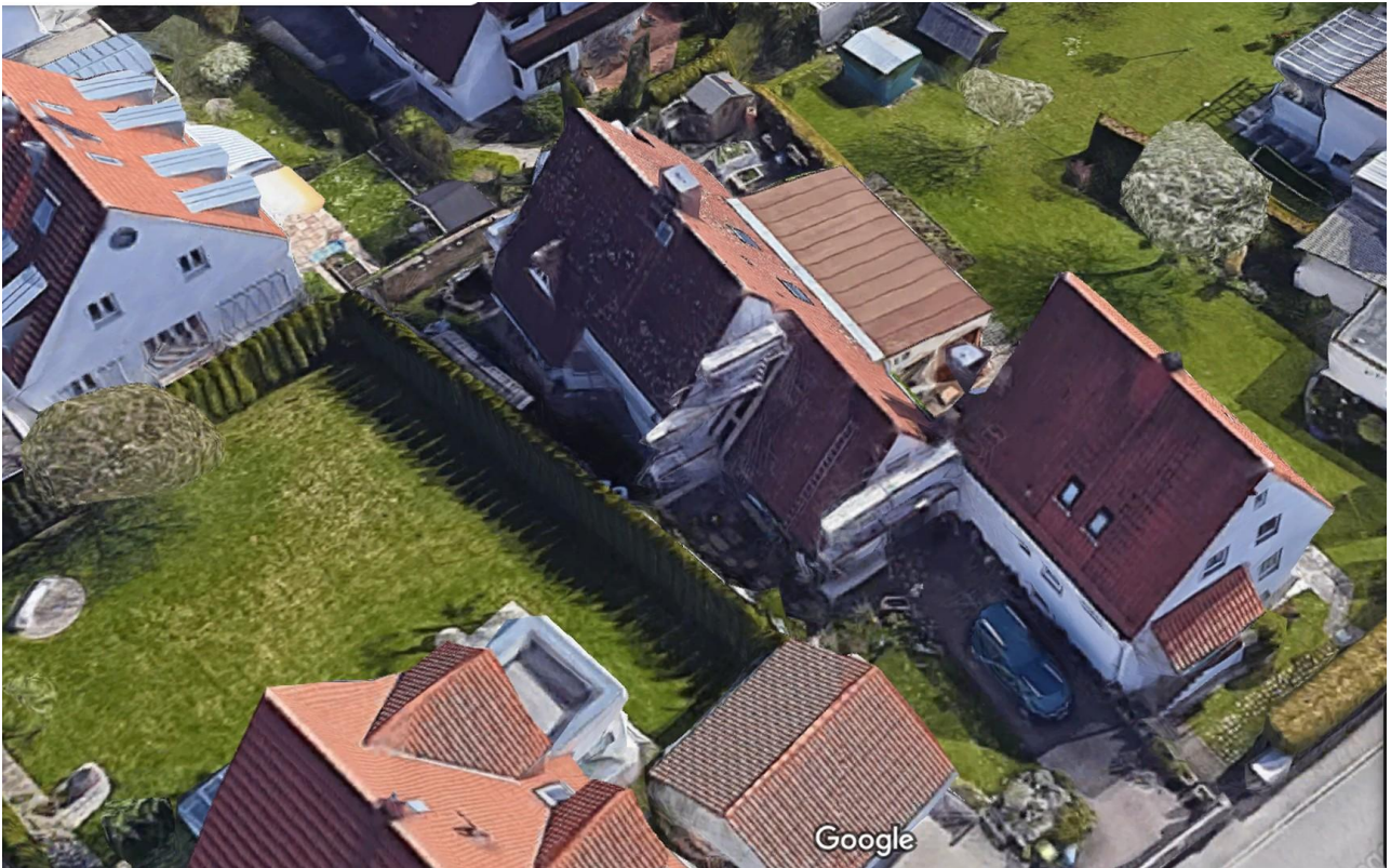
Luftbild Lage Umgebung