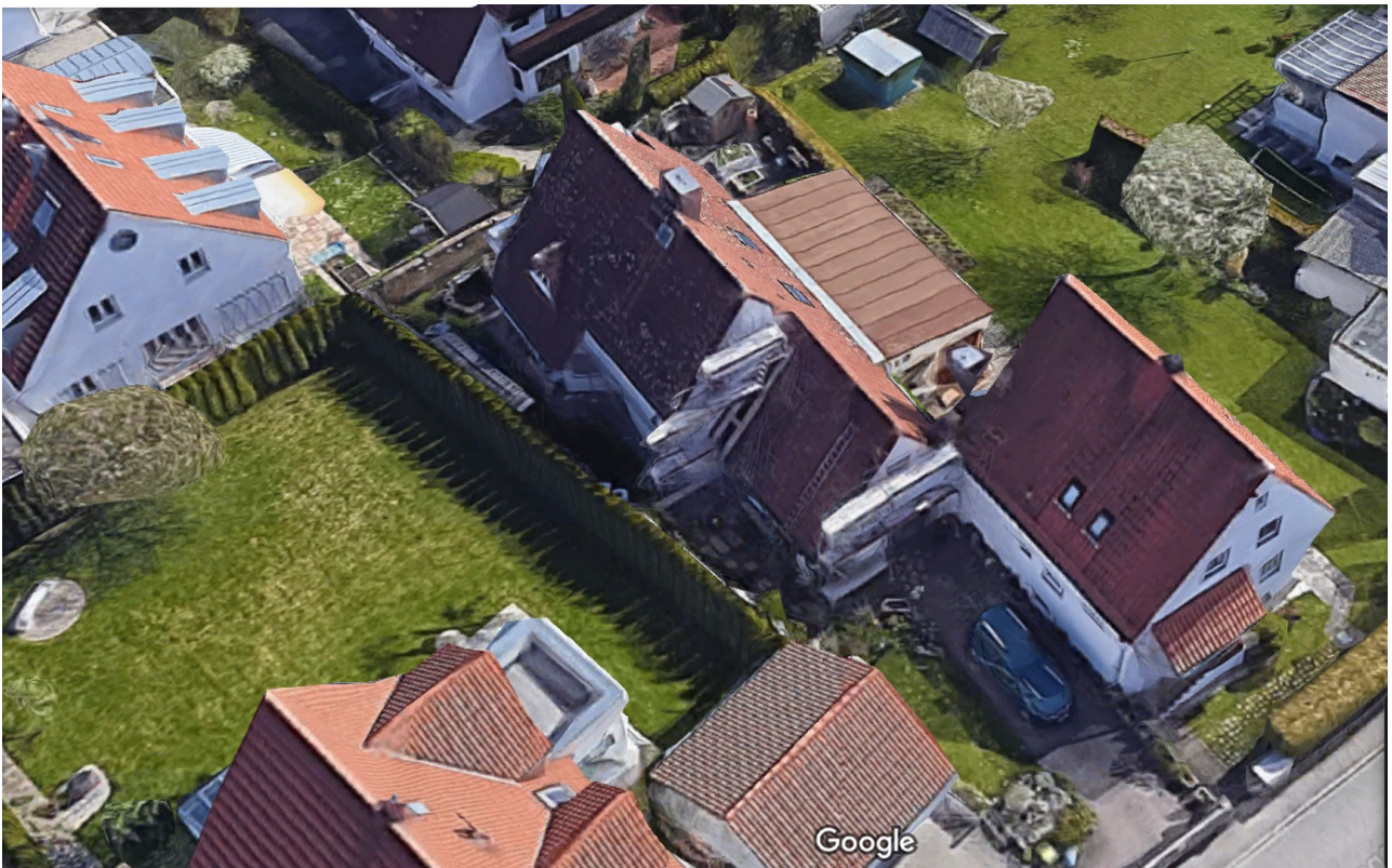
Luftbild Lage Umgebung