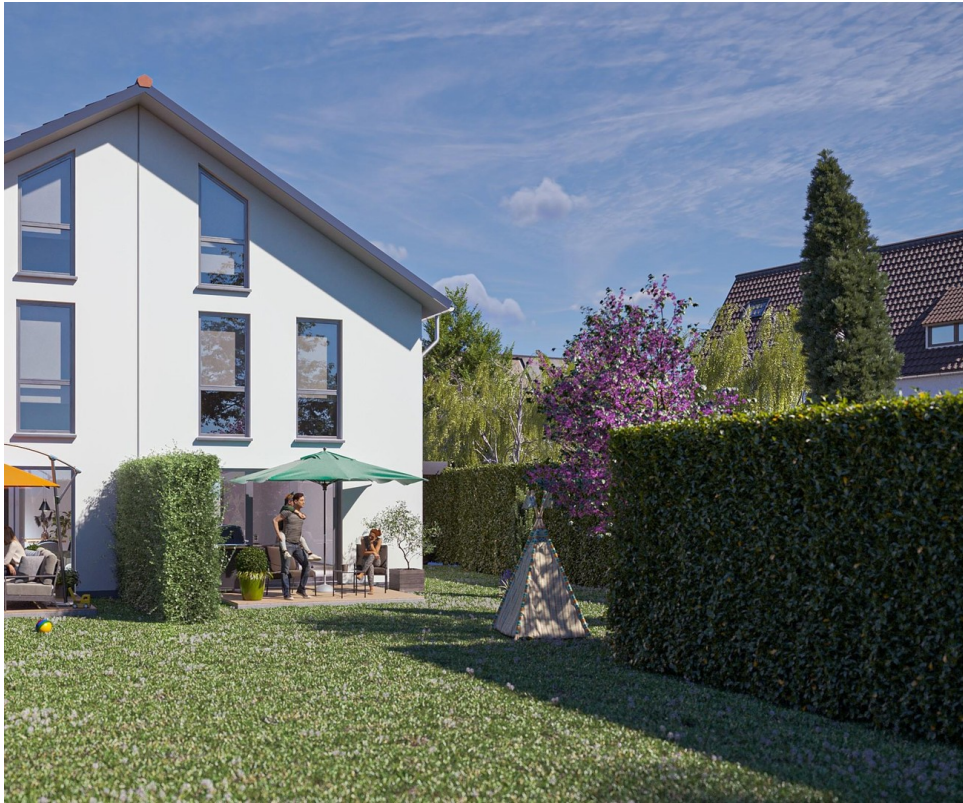
Haushälfte Neubau Visualisier