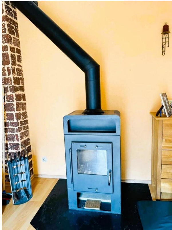
Kamin im EG